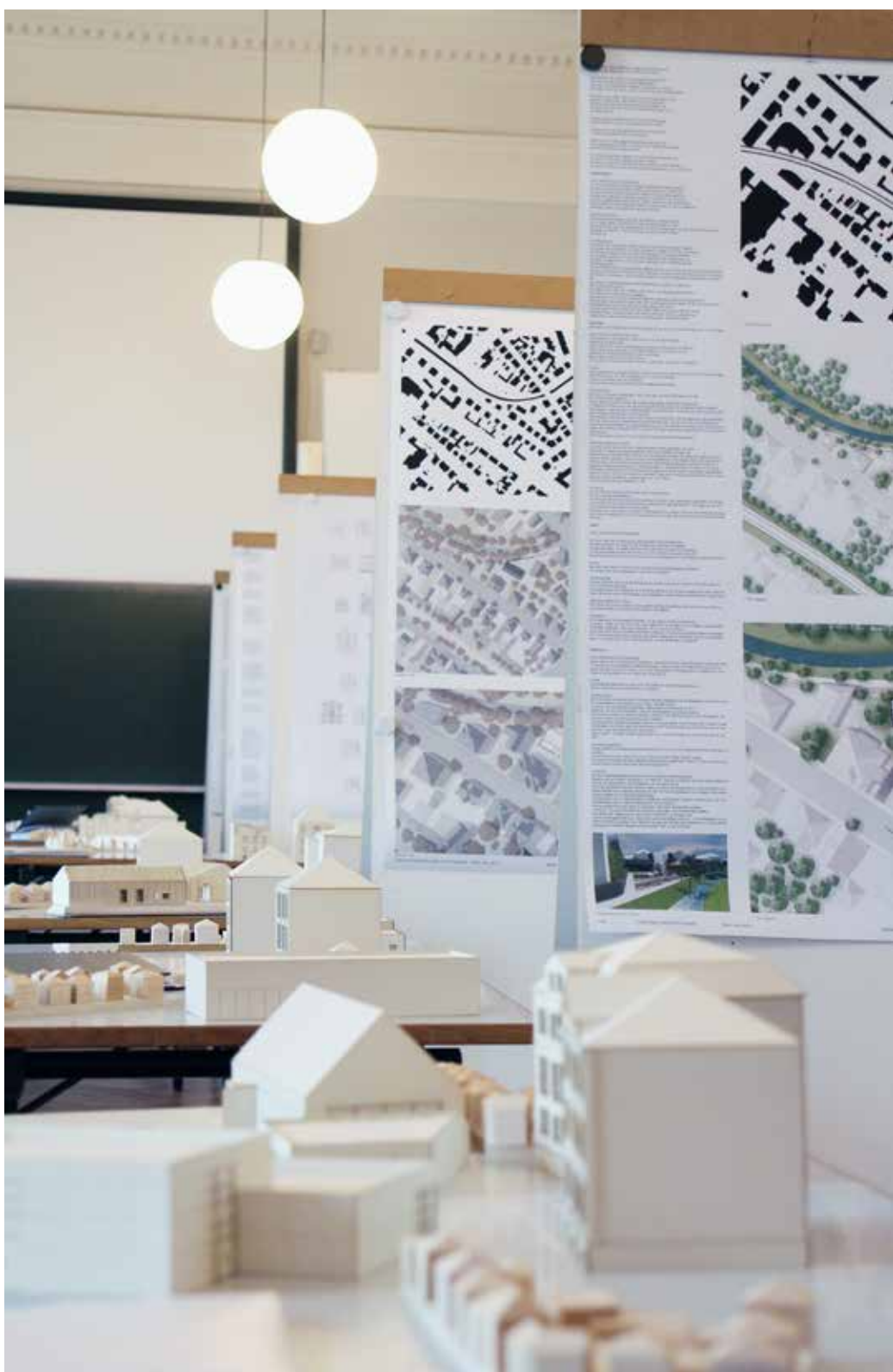
Die Aula des Hugo-von-Ritgen-Hauses bot einige Tage lang Einblicke in die mögliche Zukunft eines Gießener Innenstadtquartiers.

Eine Ausstellung im Hugo-von-Ritgen-Haus der THM versammelte zum Ende des Wintersemesters die ausgearbeiteten Lösungsmodelle. Die Qualität der Vorschläge, dieses Quartier aus seinem veralteten Korsett zu befreien und dort ein neues städtebauliches Konzept umzusetzen, beeindruckte nicht nur den betreuenden Professor und manchen Besucher. Die Entwürfe der Studierenden animierten auch die lokale Presse zum Lobgesang. „In gleich 27-facher Ausfer-