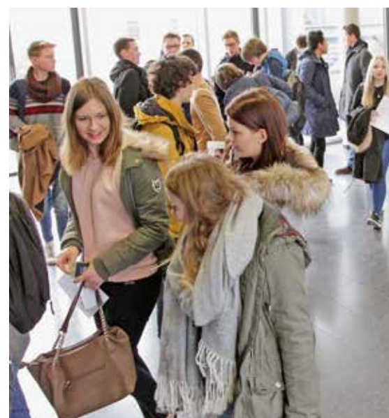
Nach der Vorstellung der Fachbereiche strömten die jugendlichen Gäste zu den Vorführungen in den Laboren.

Neben dem fachspezifischen Programm am Vormittag wurden am Nachmittag Zusatzveranstaltungen geboten, die sich