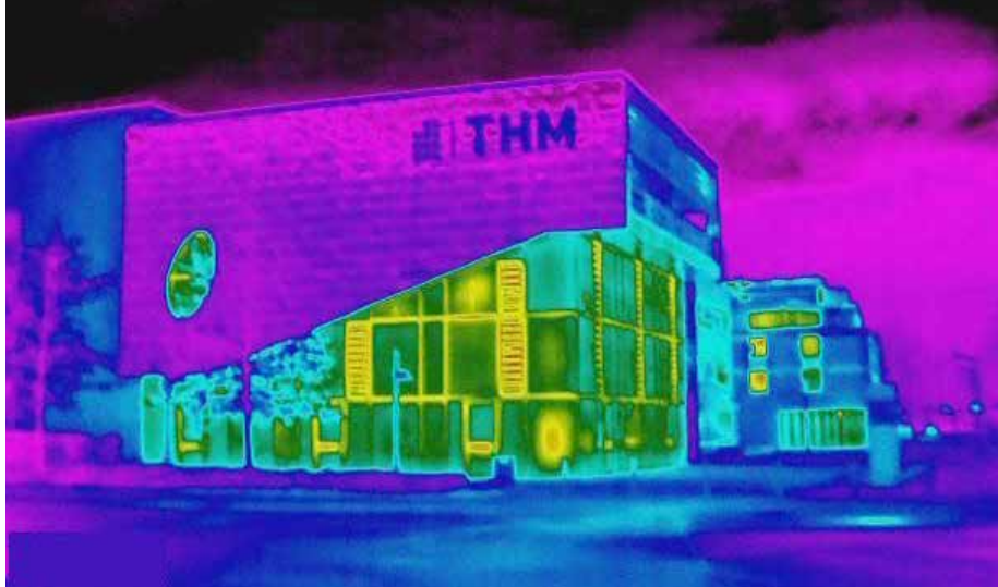
Das Thermografiebild vom Café Campustor in der Gießener Wiesenstraße zeigt, wo die Wärmeverluste am größten sind.