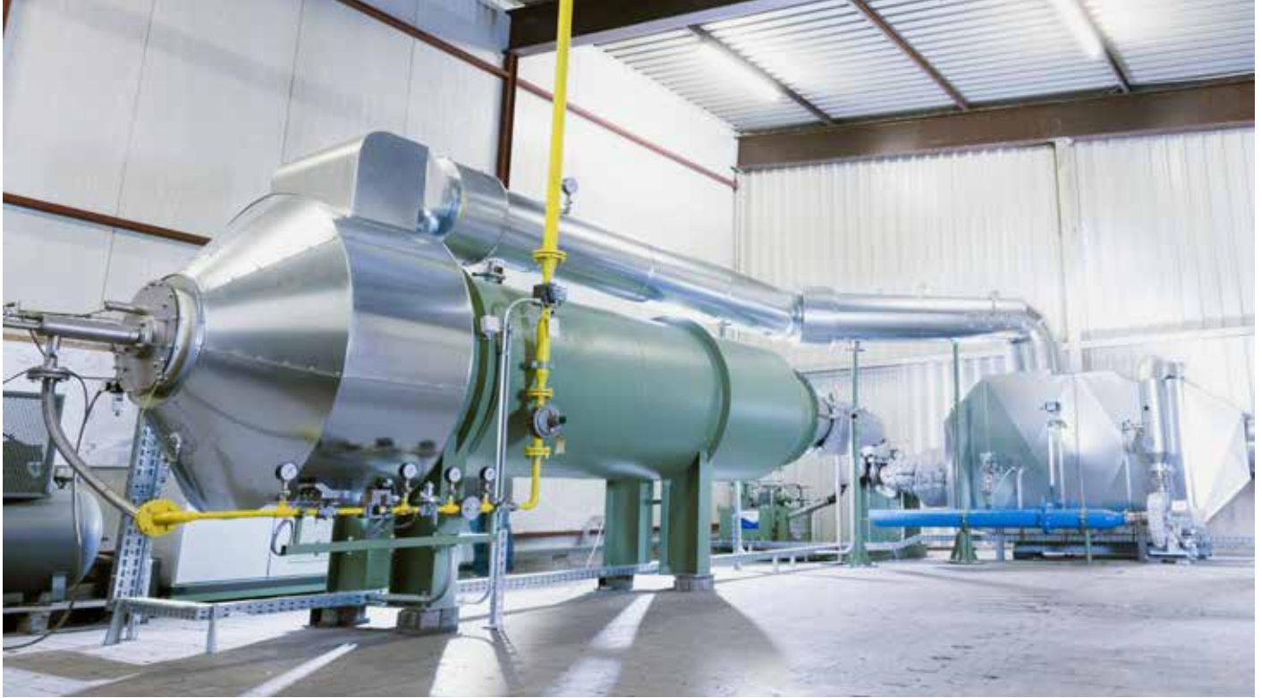
Versuchsbetrieb: Der Hochtemperatur-Wärmeübertrager (rechts) heizt das schadstoffbelastete Gas auf. Links die Brennkammer der thermischen Nachverbrennungsanlage