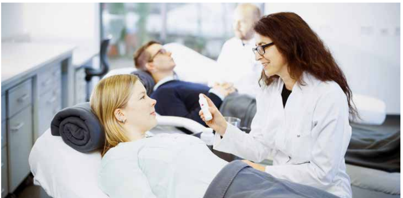
Zum Projekt der Gießener Wissenschaftler gehört auch eine Anwendungsstudie zur Überprüfung von Kosmetika.

Das Forschungsvorhaben läuft bis Ende 2018 und hat ein Gesamtvolumen von 530.000 Euro. Es wird im Rahmen der hessischen „Landes-Offensive zur Entwicklung Wissenschaftlich-ökonomischer Exzellenz“ (LOEWE) unterstützt. ■