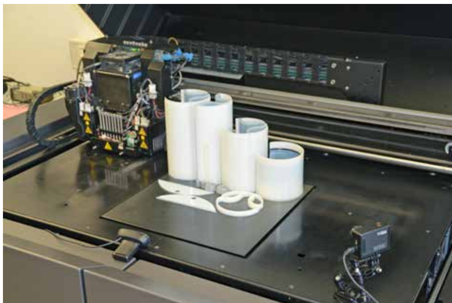
Aus der Kooperation resultierten die Komponenten eines kompletten Modells der Variokan-Testanlage.

Raum – für die Anwendung des Konzepts Variokan gibt es viele Gründe und gute ökonomisch-ökologische Argumente.