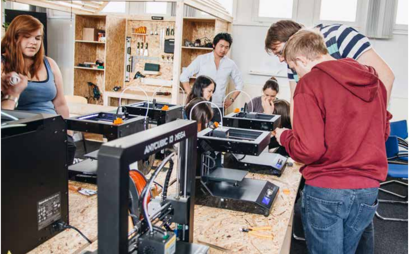
In Workshops lernten die Besucher den 3D-Druck in Theorie und Praxis kennen.