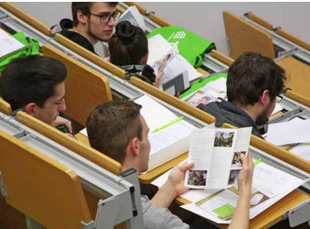
Begrüßungsveranstaltungen, schriftliches Informationsmaterial ...

Mit 17.400 Studentinnen und Studenten begann der Vorlesungsbetrieb an der THM im April. Das sind knapp drei Prozent mehr als im Vorjahr (16.937).