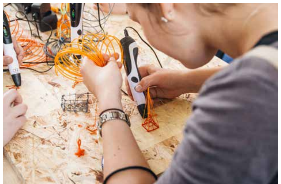
Experimentiert wurde auch mit 3D-Stiften.