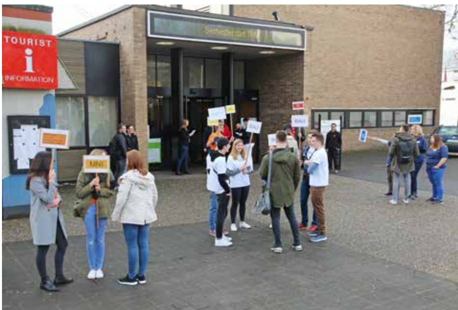
... und Campusführungen mit Scouts ihres Fachbereichs gehören in Gießen und Friedberg zum Einführungsprogramm für Erstsemester.