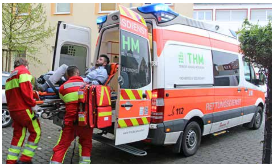
Der THM-Rettungswagen ist mit Kamera und Übertragungstechnik ausgestattet.