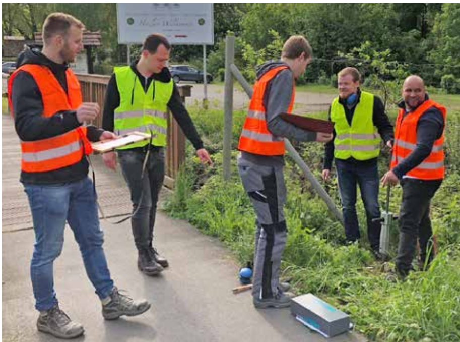
Ortstermin in Südhessen: Brückenvermessung, Schadensaufnahmen, Boden- und Baustoffuntersuchungen sind Grundlagen für die weitere Planung.

tet in einem Gemeinschaftsprojekt des Automobilherstellers Hyundai und der Universität Mostar als Berater mit. Gefördert von der Gesellschaft für internationale Zusammenarbeit soll in Mostar ein Studiengang „Fahrzeugmechatronik“ einrichtet werden. ■