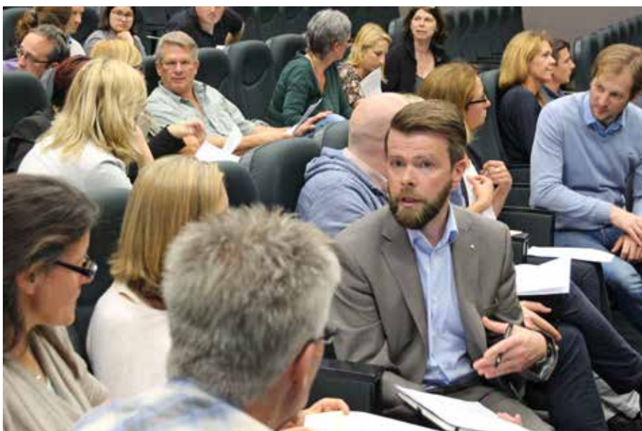
Die Leitlinien für die zukünftige Entwicklung der Hochschule diskutierten die THM-Mitglieder in kleinen Gruppen.