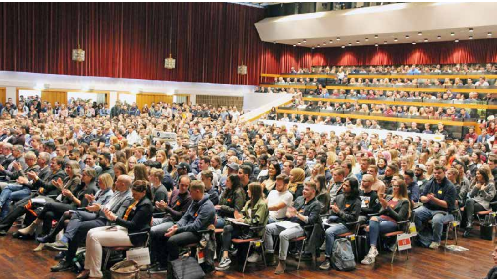
... die die Hochschule zu Semesterbeginn in der Halle empfing.