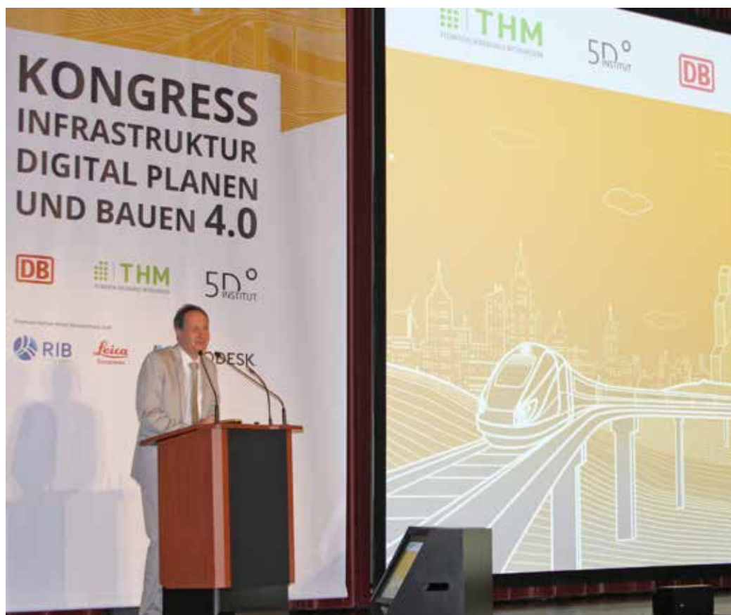
„Was Sie hier einbringen, wird unmittelbar in die Lehre am Fachbereich Bauwesen eingehen“, versprach THM-Vizepräsident Prof. Olaf Berger dem Auditorium bei der Eröffnung des BIM-Kongresses.

Im Programm der Tagung des Fachbereichs Bauwesen stieß man immer wieder auf das Kürzel BIM. Es steht für Building Information Modelling. Darunter versteht man die optimierte Planung, Ausführung und Bewirtschaftung von Bauwerken mit Software. Die THM hatte die Fortbildung zum fünften Mal gemeinsam mit der Deutschen Bahn und weiteren Unternehmenspartnern organisiert. An den beiden Kongresstagen widmeten sich Vorträge, Praxisberichte und Workshops digitalen Verfahren beim Planen und Realisieren zum Beispiel von