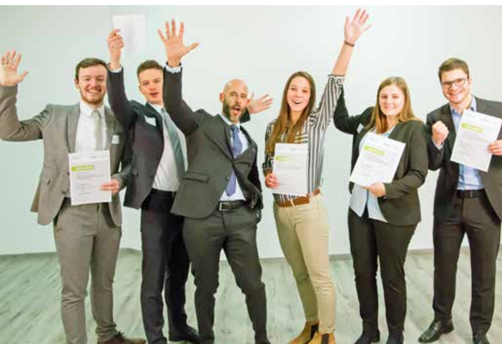
Sechs Glückliche im November 2018 in Friedberg: Wer ein Deutschlandstipendium bekommt, hat Grund zum Jubeln.

„Die Studienfinanzierung stellt viele junge Menschen vor Probleme, die sie von einer akademischen Ausbildung abhalten oder deren Verlauf erschweren. Die THM tritt dafür ein, die Förderangebote durch Stipendien auszuweiten. Das bundesweit initiierte Modell Deutschlandstipendium gibt uns Gelegenheit, durch Ansprache und Motivierung von Partnern Fördermittel zu gewinnen, die gezielt Studierenden unserer Hochschule zugutekommen.“ So erläuterte seinerzeit das Präsidium den Einstieg der Hochschule in ihr Engagement. Dessen erfolgreiche Fortsetzung führte zur siebten Vergaberunde, die das Dossier dieses THMmagazins dokumentiert. ■