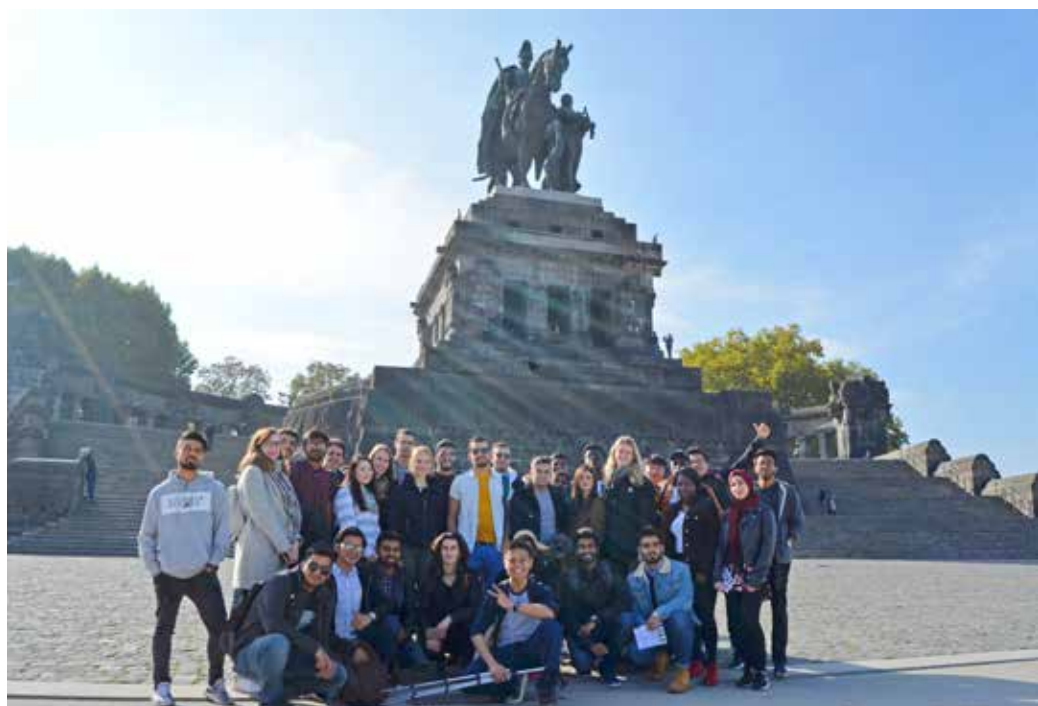
In Koblenz besuchten die Exkursionsteilnehmer unter anderem das „Deutsche Eck“.