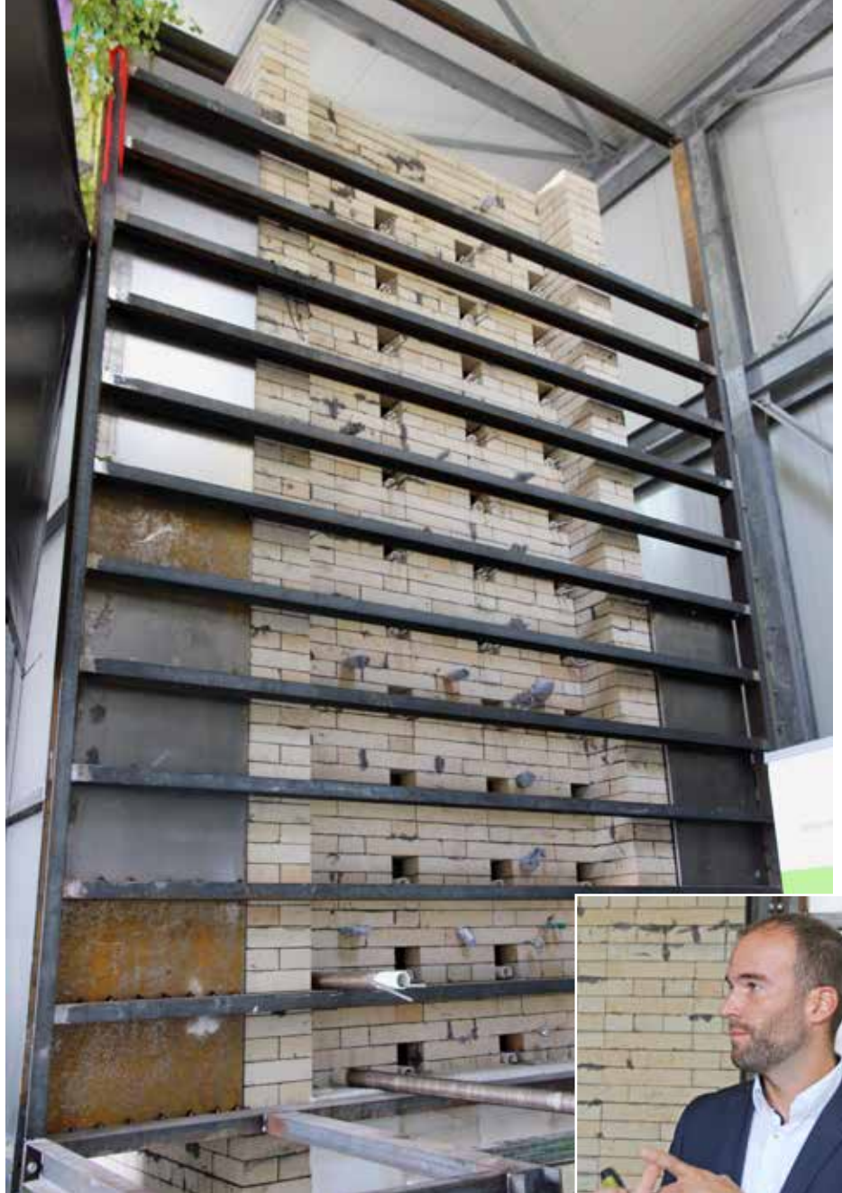
Der Hochtemperaturspeicher besteht aus Schamottestein-Mauerwerk mit vertikalen und horizontalen Öffnungen und elektrischen Heizelementen.

Der Wärmespeicher hat ein Gesamtgewicht von 47 Tonnen. Er besteht aus Schamottestein-Mauerwerk mit vertikalen und horizontalen Öffnungen, elektrischen Heizelementen und einer Isolierung aus Vermiculit, einem Mineral mit sehr geringer Wärmeleitfähigkeit. Zurzeit laufen die Montagearbeiten. Inbetriebnahme und Einweihung sind im ersten Quartal 2019 vorgesehen. Der