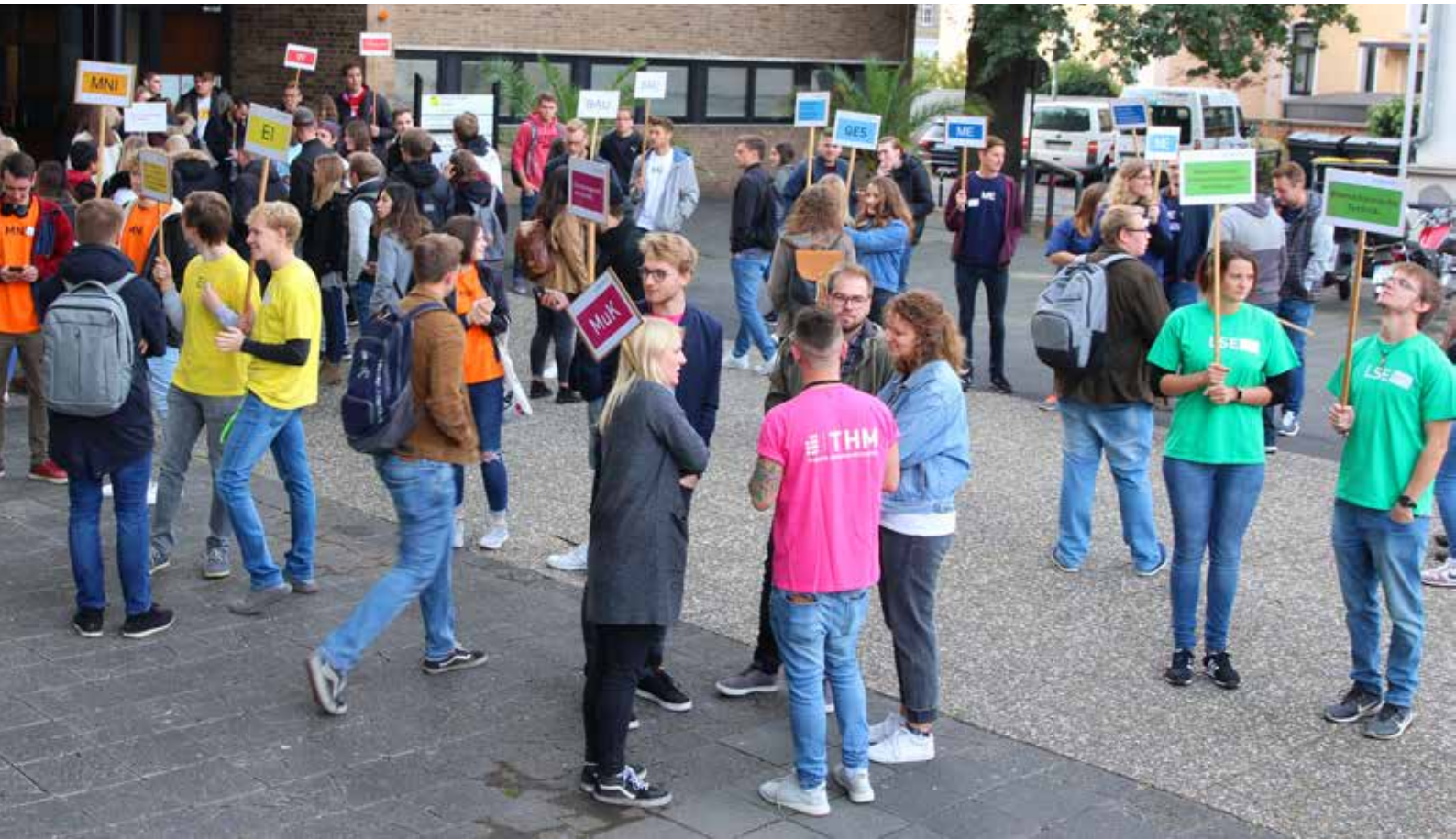
Vor der Gießener Kongresshalle warteten Mentorinnen und Mentoren der Fachbereiche auf die Erstsemester, ...