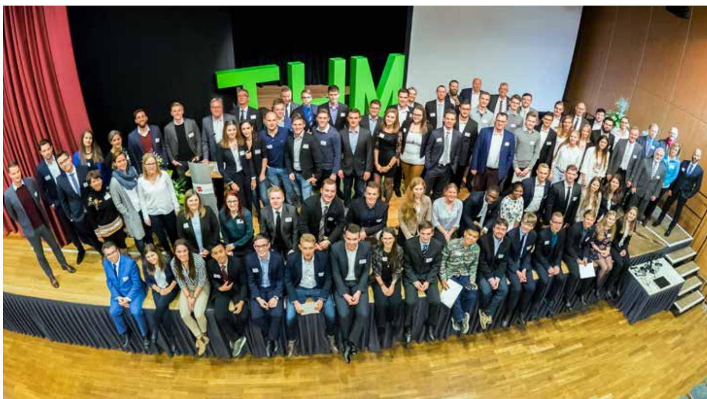
Geförderte, Förderer und Verantwortliche der THM teilten ihre Freude bei der Feier in der Friedberger Stadthalle.

werben, wodurch ihnen eine großartige Chance entgeht.“