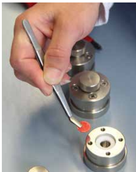
In einer Permeationskammer wird der Wirkstofftransport durch die künstliche Nagelplatte getestet.

Der Pilzbefall ist die häufigste Erkrankung des Nagels. Bis zu 70 Prozent der Menschen sind irgendwann in ihrem Leben davon betroffen. Dabei handelt es sich nicht um ein rein kosmetisches Problem. Eine Behandlung ist nötig, um die Ausweitung der Infektion auf angrenzende Hautareale und die Übertragung auf andere Personen einzudämmen. Die Therapie ist schwierig, da die Wirkstoffe schwer löslich sind und deren Transport über den Nagel limitiert ist. „Verbesserungen sind durch die Entwicklung von neuen Trägersystemen für Arzneimittel (Drug Delivery Systems) und die Identifikation von Hilfsstoffen möglich, die den Wirkstofftransport durch die Nagelplatte fördern (Penetra-