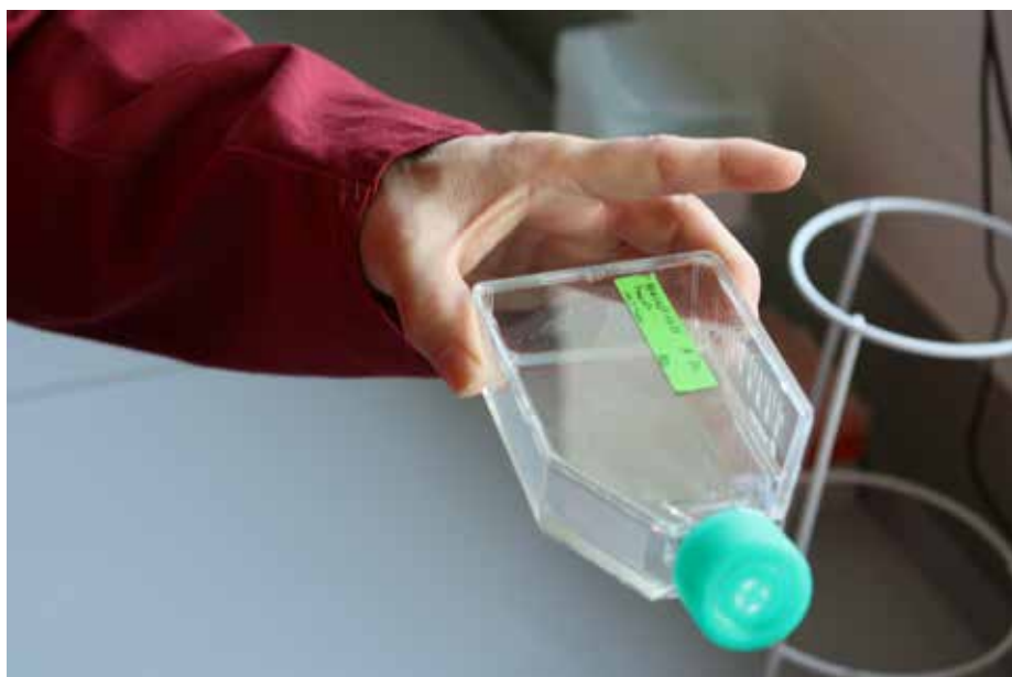
Die Zellkulturtechnik gehört seit langem zu den Forschungsschwerpunkten der THM.

Die Laborarbeit an Forschungsprojekten geschieht in kleinen Gruppen. Zu Massenansammlungen kommt es dabei nicht. Deshalb können auch unter den rigiden Auflagen, die während der aktuellen Pandemie an der Hochschule gelten, Versuchsszenarien aufgebaut, Untersuchungen gestartet oder fortgesetzt und Entwicklungsvorhaben weiter betrieben werden. Auch die Kooperation mit Projektpartnern, die charakteristisch für die anwendungsbezogene Forschung der Technischen Hochschule Mittelhessen ist, läuft weiter.