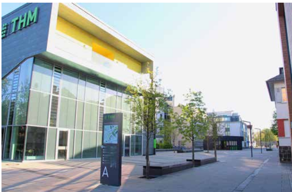
So sah es zum Semesterstart am 20. April vormittags auf dem Campus in Gießen aus.

Am Standort Gießen hat der Bachelor-Studiengang Betriebswirtschaft mit 133 die meisten Neulinge. Es folgen Social Media Systems (122), Informatik (119) und Bauingenieurwesen (69). Die gefragtesten Bachelor-Studiengänge in Friedberg sind Wirtschaftsmathematik (54) und Wirtschaftsingenieurwesen – Industrie (48).