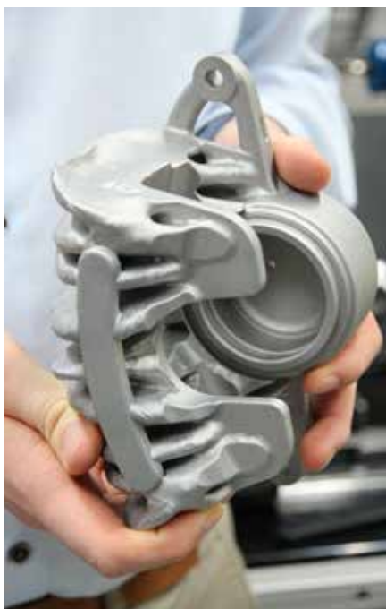
Ein Bremsattel, der mit der 3D-Druck-Technik hergestellt wurde

Diese additive Fertigung hat gegenüber konventionellen Verfahren verschiedene Vorteile. Beschränkungen herkömmlicher Produktion, die zum Beispiel bei Gussteilen Hohlräume oder Hinterschnidungen vermeiden muss, gibt es nicht. Jedes Bauteil lässt sich ohne Werkzeugwechsel anders herstellen als das vorherige. Dadurch wird zum Beispiel eine Kleinserien- oder Einzelteilfertigung attraktiver. Ersatzteile können bei Bedarf dezentral produziert