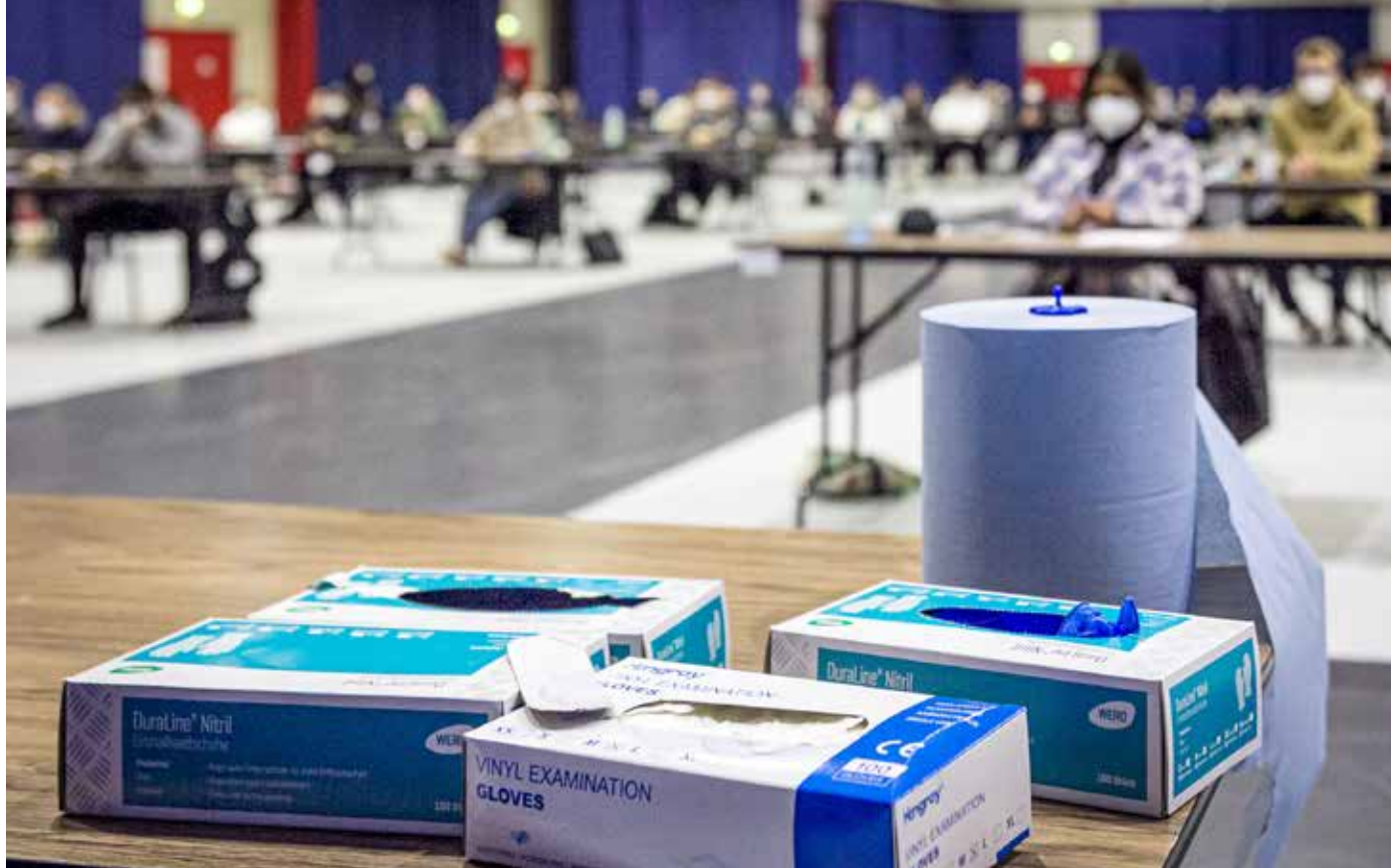
Aus epidemiologischer Sicht haben die Klausurwochen an der THM keinen nachweisbaren Schaden angerichtet.