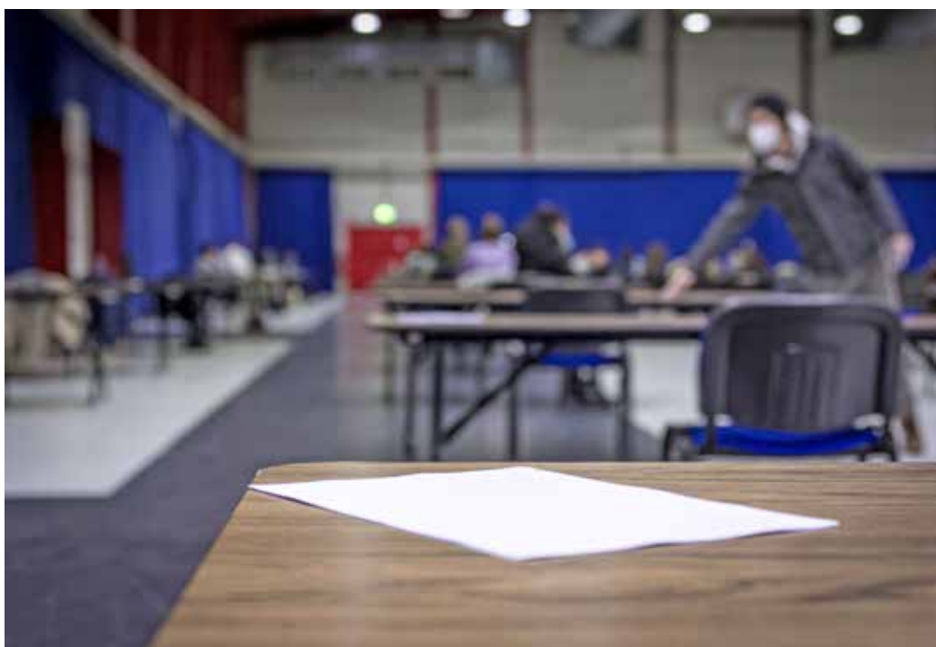
Auch während einer Pandemie haben die Immatrikulierten einen Rechtsanspruch auf Prüfungen.

Die THM ist zur Durchführung von Prüfungen verpflichtet; Studierende haben einen Anspruch darauf, geprüft zu werden. Der das gesamte Prüfungsrecht beherrschende Gleichbehandlungsgrundsatz verlangt, dass für vergleichbare Prüflinge so weit wie möglich vergleichbare Prüfungsbedingungen zu gelten haben. Da fangen die Schwierigkeiten an. Ein Beispiel: Die derzeit in Hessen