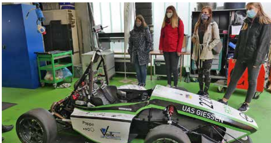
Einer der wenigen realen Termine für die Technikantinnen: Der Besuch beim THM Motorsport Rennteam

Neu wurde die monatliche Online-Reflexion mit den anderen Standorten in Hessen eingeführt, um das Netzwerk der Technikantinnen zu stärken. Außerdem hat jede Hochschule einen Online-Schnuppertag gestaltet. Das erlaubte es den jungen Frauen, auch andere MINT-Studiengänge und Studienorte kennenzulernen. Schwierig war hingegen die Praktikumsituation, da einige Unternehmen auf Grund von Co-