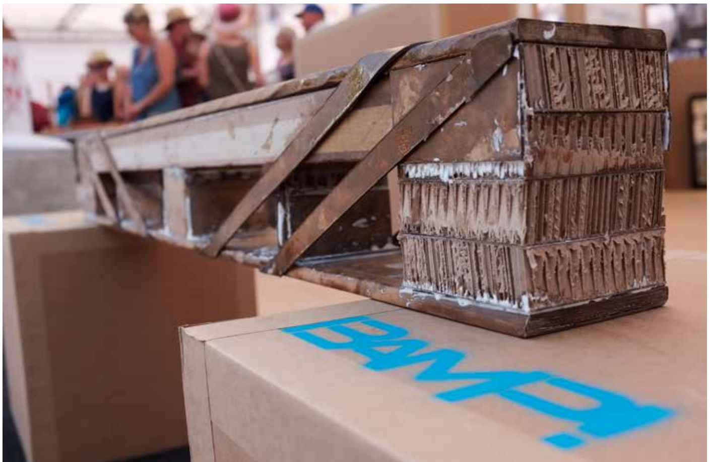
Ein Papierbalken kann die gleiche Biegesteifigkeit haben wie einer aus Holz, Beton oder Stahl.

Das Land Hessen hat das Projekt im Rahmen der „LandesOffensive zur Entwicklung Wissenschaftlich-ökonomischer Exzellenz (Loewe)“ vier Jahre mit 4,6 Millionen Euro gefördert. ■