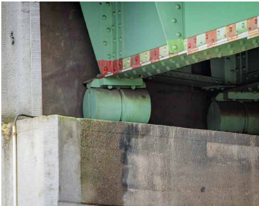
Brückenaufleger können ermüden und spröde werden. Wie das vermieden werden kann, soll ein Forschungsprojekt der THM untersuchen.

Gefährlicher wäre ein solcher Sprödbruch im Bahnverkehr. „Es gibt Regelungen, wie sprödes Versagen ausgeschlossen werden kann“, erklärt Kühn. DIN-Normen regeln die Details. Weil es aber dennoch vorkommt – etwa bei Brückenauflagern – soll nun Kühn forschend aktiv werden. Denn die Sprödigkeit des Materials bei tiefen Temperaturen wird gefährlicher, wenn sie auf Ermüdung trifft. „Man dachte bislang, das geschieht bei Lagern nicht“, sagt Kühn. Bei Brückenauflagern seien häufig dicke Bleche im Einsatz, auf denen