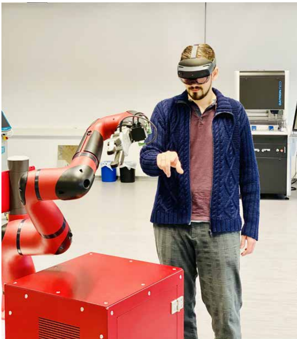
Unterschiedliche Robotertypen gehören ebenso zur Ausstattung der Smart Factory Mittelhessen wie verschiedene Software zur Produktionsplanung.

Die „Smart Factory Mittelhessen“ soll helfen, diese Hürden zu überwinden. In der Produktionsstätte werden verschiedene Maschinen im Einsatz sein, an denen die Digitalisierung demonstriert werden kann. Vorhanden sind zum Beispiel eine Spritzgussanlage, eine CNC-Fräse, ein Laser, 3D-Drucker, verschiedene Robotertypen und ein autonomes Flurförderfahrzeug. Zur Ausrüstung gehören außerdem Computerbrillen, ein Echtzeitortungssystem und verschiedene Software für die Produktionsplanung.