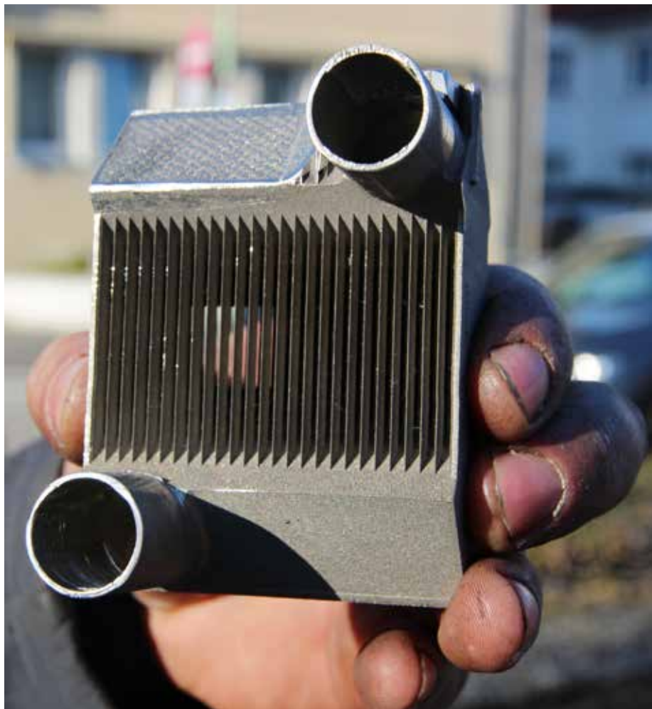
Gedruckt mit dem selektiven Laserstrahlschmelzverfahren: der Prototyp des neuartigen Kühlers