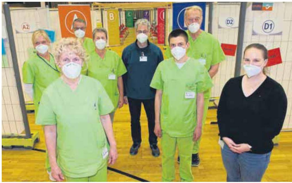
Hat alles in allem mehr als 86 000 Spritzen gesetzt: Die Mannschaft des Impfzentrums des Landkreises Hersfeld-Rotenburg in Rotenburg.