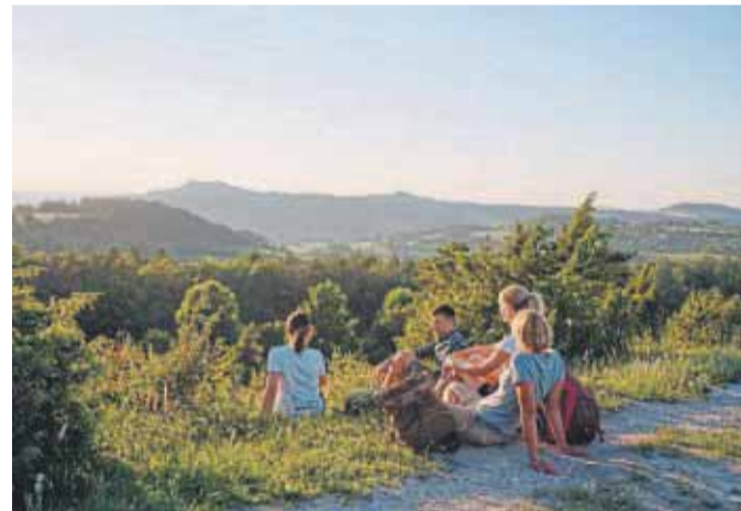
Unterwegs auf einem der acht Keltenwege: Rast mit Blick auf den Staffelberg.

Wenn im Herbst der Laubwald in strahlenden Farben leuchtet und die Sonne die Landschaft in goldenes Licht taucht, ist die beste Zeit für einen aktiven Kurzurlaub in der Tourismusregion ObermainoJura. Der felsige Jura und das liebliche Maintal können beim Radeln, beim Klettern am Fels oder beim Paddeln auf dem Main erkundet werden. Über 1.000 beschilderte Wanderkilometer machen Lust auf gemütliche Spaziergänge oder mehrtägige Wanderungen. Die beeindruckenden Barockbauten Kloster Banz und die Basilika Vierzehnheiligen sind zusammen mit dem Staffelberg die Wahrzeichen der Region. Alle Infos gibt es unter www.obermain-jura.de . Nach