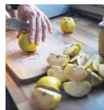
Die Fleischbräune bei Quitten ist unbedenklich, sie tritt bei ungünstigen Wachstumsbedingungen auf.