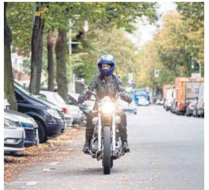
Motorradfahren in der kalten Jahreszeit ist aufgrund verschiedener Einflussfaktoren besonders gefährlich.

Um diese Temperatur zu erreichen, muss der Reifen mechanisch belastet werden. Das passiert sowohl beim Rollen, als auch beim Beschleunigen und Bremsen sowie bei der Kurvenfahrt.