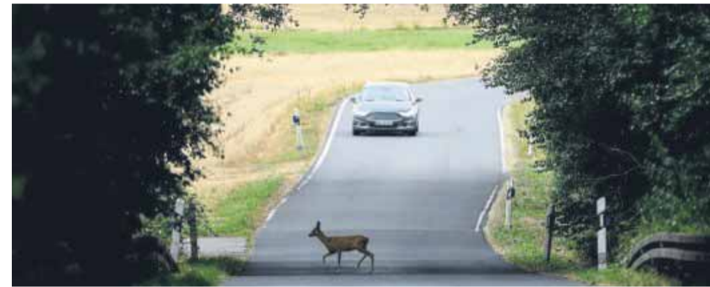
Achtung Reh! Jetzt schön langsam fahren und mit Nachzüglern im Wildwechsel rechnen.

Wichtig: Viele Versicherer fordern zur Schadenregulierung eine Wildunfallbescheinigung. Diese sollte die Polizei bei der Unfallaufnahme ausstellen. Schäden nach einem Unfall mit Haarwild - wie zum Beispiel Wildschwein, Reh, Hirsch, Fuchs oder Hase - können über die Teil- oder Vollkaskoversicherung reguliert werden. tmn