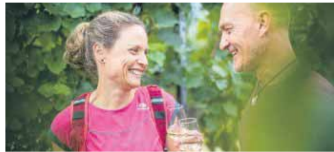
aktivsein und Genießen - das gehört im sonnenreichen Südwesten Deutschlands zusammen.

Weingegenden verfügen über reizvolle Landschaften, ein angenehmes Klima und eine vielfältige Kulinarik. So bietet auch der Naturgarten Kaiserstuhl im sonnenreichen Südwesten Deutschlands alle Voraussetzungen für einen gelungenen Genusurlaub. Die grünen Anhöhen von Kaiserstuhl und Tuniberg mit ihren Rebterrassen, Obstgärten und uralten Winzerdörfern lassen sich auch per Rad oder E-Bike entdecken. Unter www.naturgarten-kaiserstuhl.de gibt es ausführliche Infos zu Wandern, Wein und anderen Genüssen, etwa eine Broschüre mit Tipps für Radler zum