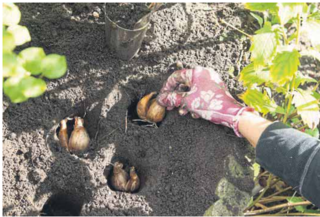
Solange die Herbstsonne noch scheint: Jetzt ist die richtige Zeit, Zwiebelblumen, die im Frühjahr blühen sollen, in die Erde zu geben.