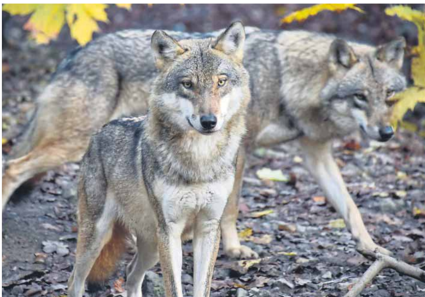
Wer auf den Wolf trifft: Eine Begegnung mit dem Raubtier beim Spaziergang im Wald ist zwar selten, aber für viele doch eine bedrohliche Vorstellung. Unser Foto entstand allerdings im Gehege des Tierparks Knüll.