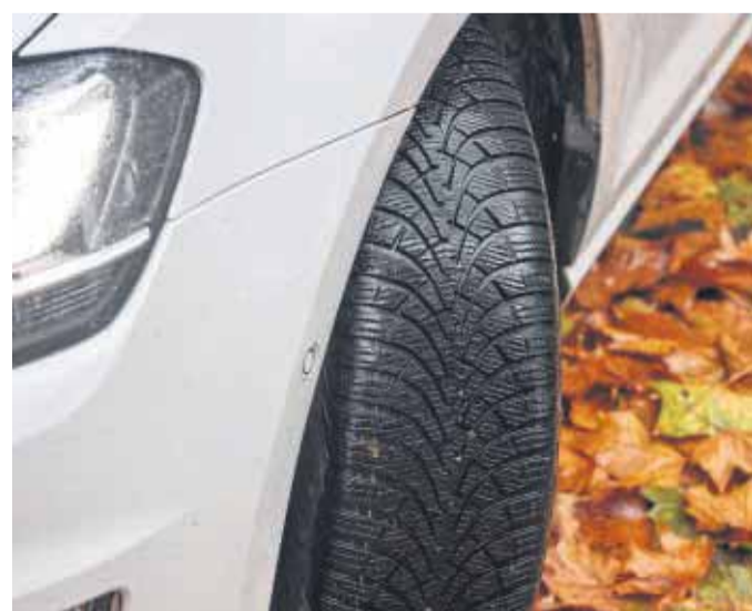
Von Oktober bis Ostern auf Winterreifen: An dieser Faustregel kann man sich grob orientieren, um die Winterreifen aufziehen zu lassen.

Wegen der situativen Winterreifenpflicht müssen Winterreifen immer dann am Auto sein, wenn Reif- oder Eisglätte, Glatteis, Schneematsch oder Schnee auf den Straßen ist. Ansonsten drohen Bußgelder und Punkte in Flensburg. tmn