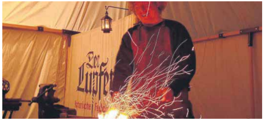
red/czi Wenn die Funken fliegen: Beim Mittelaltermarkt ist auch ein Schmied dabei.

genschließen, Schmieden und bei Harlekingspielen versu-chen oder auf dem handbe-triebenen Riesenrad ihre Runden bis auf 38 Meter Hö-he drehen. Geöffnet ist am Samstag von 12 bis 22 Uhr und am Sonntag von 11 bis 18 Uhr. Der Eintritt kostet 6 Euro (4 Euro ermäßigt). Aufgrund des Lollslaufs kann es zu Verkehrsbehinde-rungen kommen. Es wird dar-um gebeten, das Parkleitsys-tem zu den Parkhäusern zu nutzen.