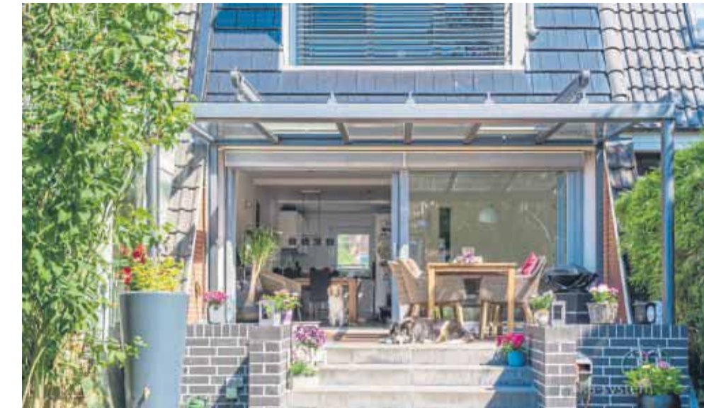
Mit einem Glasdach erhält das Wohnzimmer eine Verlängerung bis auf die Terrasse.

Damit das Glasdach die Bewohner vor Nässe, Kälte oder Böen schützen kann, muss es selbst stabil und solide ausgeführt sein. Aluminium eignet sich als langlebiges und rostfreies Material für die Rahmenkonstruktion, auf die dann das Sicherheitsglas montiert wird.