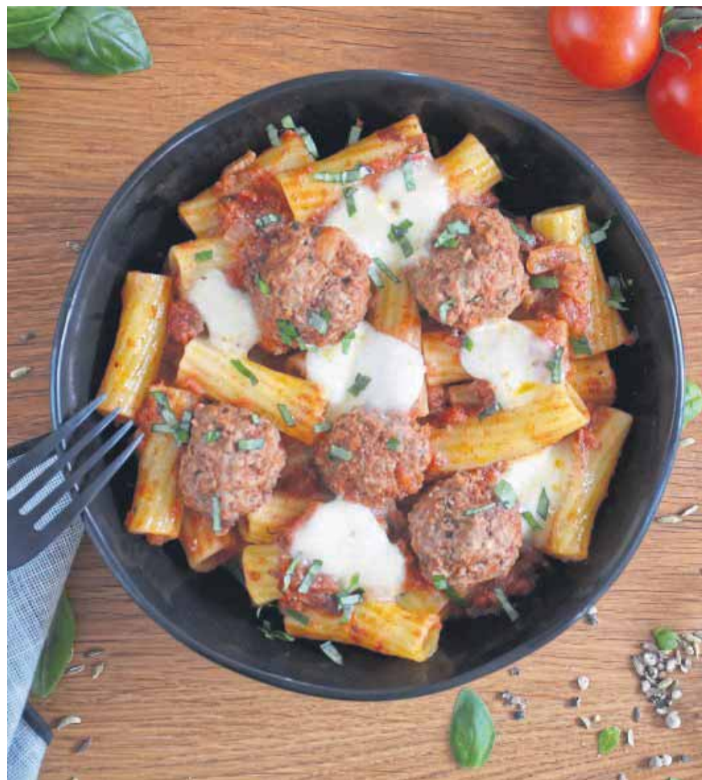
Die mit dem Mozzarella überbackenen Hackfleischbällchen werden mit der Tomatensoße über den heißen Rigatoni verteilt.

1 Zwiebel 1 Zehe Knoblauch 1 Bio Zitrone 15 g Petersilie (glatt) 50 g Parmesan (am Stück), 250 g Rinderhackfleisch 50 g Paniermehl 1 Ei 1 TL Oregano Salz, Pfeffer 1 EL Butterschmalz Für die Pasta: 500 g Rigatoni 15 g Basilikum 125 g Mozzarella