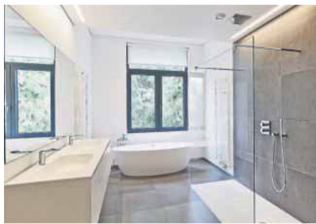
Umso größer die Fliesen, desto weniger Fugen gibt es im Bad, was sehr schick aussieht.

„Je nach Farbwahl, Formatgröße oder Oberflächenstruktur wirkt das Bad bei gleichem Grundriss und gleicher Ausstattung vollkommen unterschiedlich“, so Fellhauer. Pastellige und helle Farben an der Wand seien etwa gut geeignet für kleine Badezimmer, da sie den Raum größer wirken lassen. Zur optischen Streckung tragen auch XL-Fliesen oder Querformate bei. Beliebte sind Holz- oder Na-