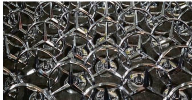
Strahlende Sterne: Wohl eines der bekanntesten Markenzeichen ist der Mercedes-Stern.

Nur weil sie die Kühlerfiguren ausgemustert haben, mangelt es aber auch den anderen Marken nicht gleich an der Liebe zum eigenen Label. Klar, der Opel-Blitz, der Peugeot-Löwe und selbst der berühmte Dreizack von Maserati, die platt auf dem Blech kleben, sind Massenartikel aus dem Aluminium- oder Kunststoff-Spritzguss und kosten nur ein paar Cent. Doch beweisen andere Marken, dass