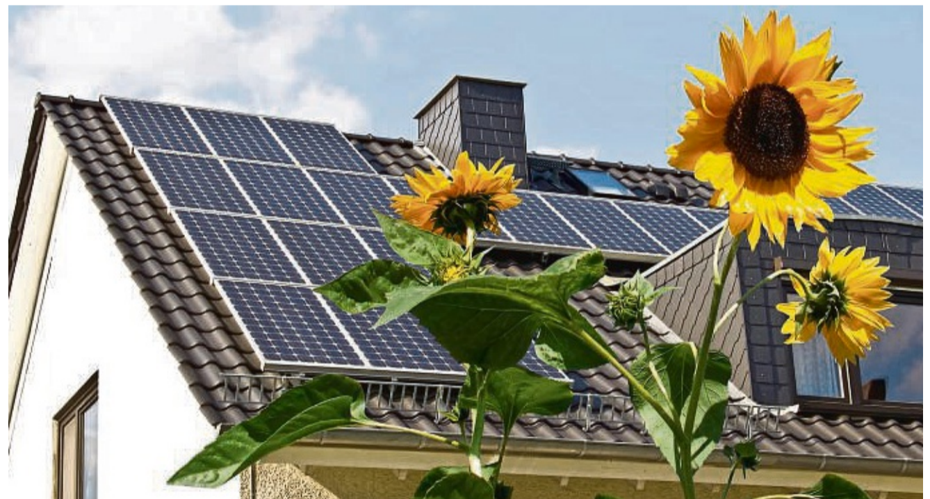
Solarzellen können auf fast jedem Dach Platz finden.