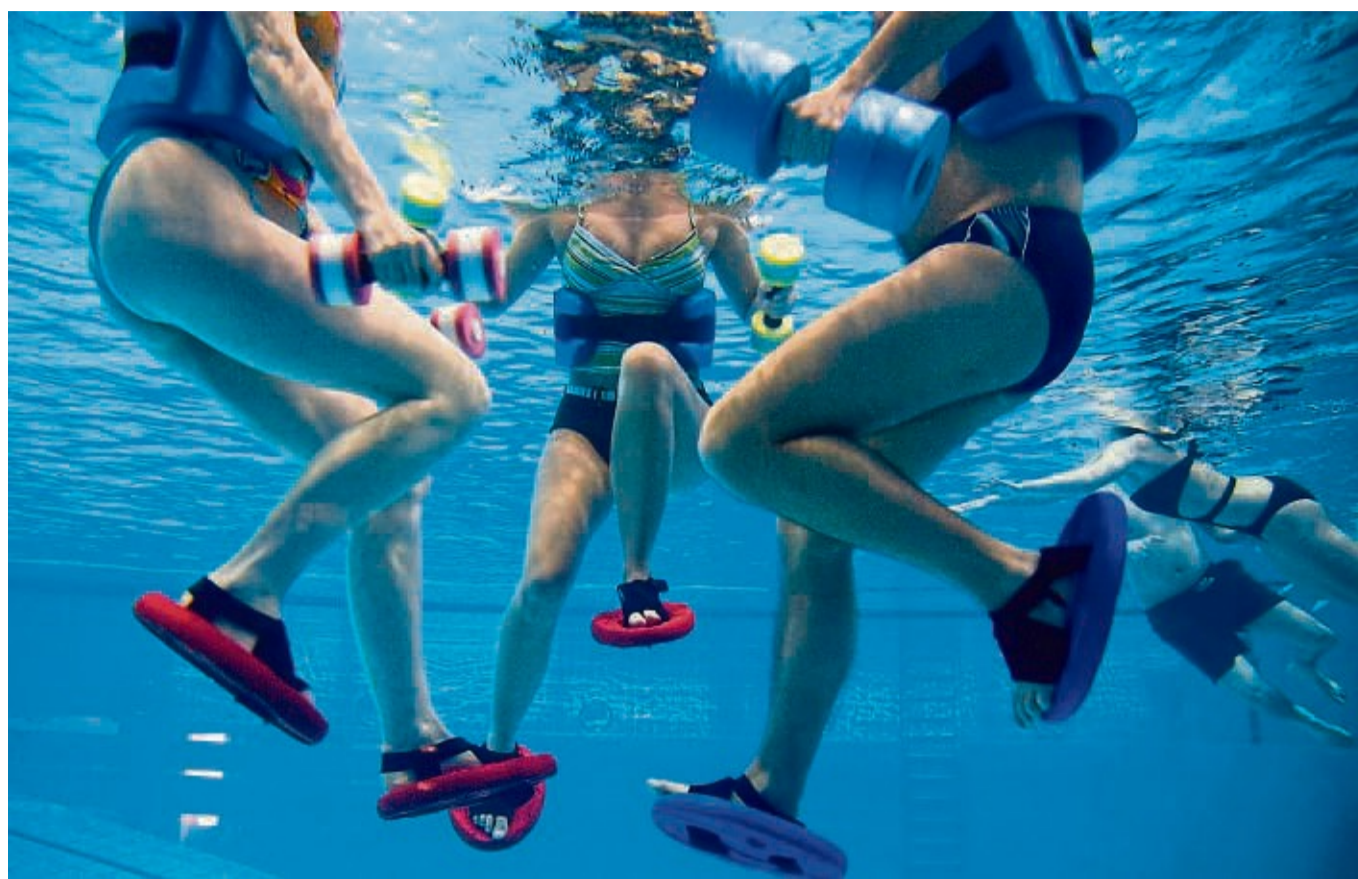
Entlastung dank Auftrieb: Im Wasser trainiert man nur mit einem Bruchteil des eigenen Körpergewichts.

Wichtig beim Aquajogging ist, dass man aufrecht bleibt und sich nicht unwillkürlich nach vorne lehnt. Abwechs-