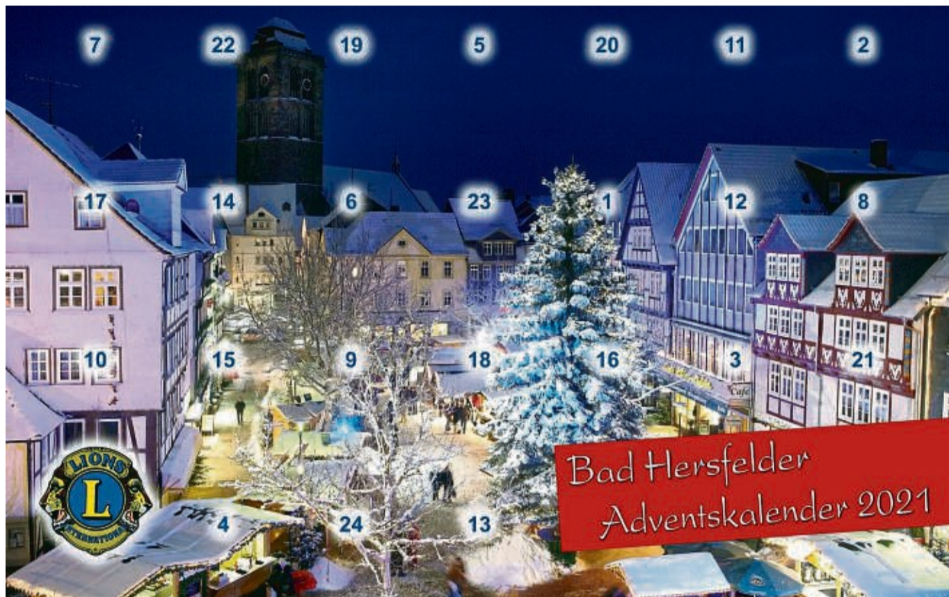
◀Lions-Adventskalender: So sieht der Hersfelder Kalender aus, der ab sofort erhältlich ist.