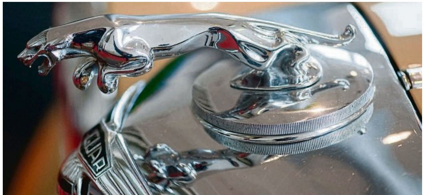
Katze auf Kühler: Richtige Figuren an der Fahrzeugfront sind heute selten, auf klassischen Autos wie diesem Jaguar aus den 1950er Jahren sieht man sie häufiger.

„Der Fußgängerschutz und die Aerodynamik machen der Kühlerfigur das Leben schwer“, sagt Ruth Schumacher. Wo es früher zuring wie im Skulpturengarten, ist