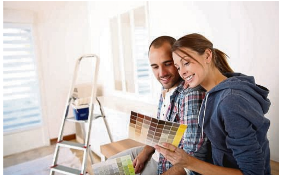
Der Griff zur hochwertigen Farbe erspart nerviges und unnötiges wiederholtes Streichen.

Bei Wandfarben auf hohe Deckkraft achten