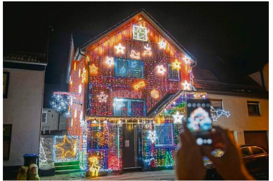
Zu Weihnachten holen viele ihre Lichterketten wieder raus. Doch wer zu viel aufhängt, kann mit dem Licht den Nachbarn um den Schlaf bringen.

Wohnungstür/Fenster: Grundsätzlich dürfen Mieterinnen und Mieter an der Wohnungstür und an den Fenstern der Wohnung Weihnachtsdeko anbringen.