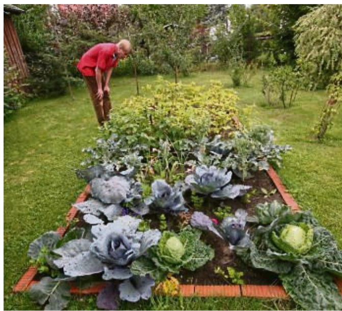
Der Kohlanbau bringt nicht nur was auf den Teller, sondern auch hübsche Pflanzen ins Beet.

Kohl ist anspruchsvoll. Daher sollte man schon jetzt im