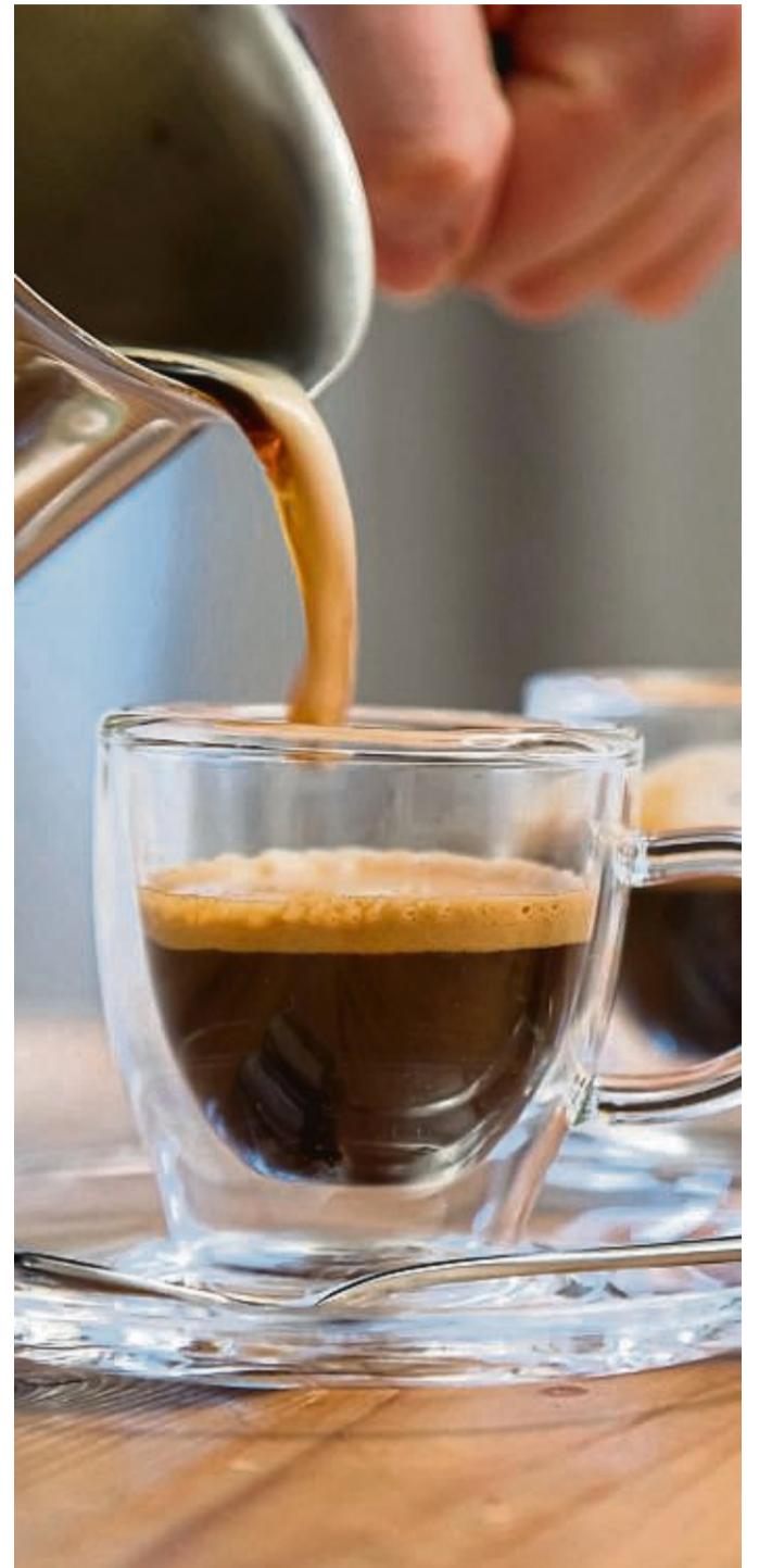
Eine Flüssigkeit wie jede andere: Kaffee entzieht dem Körper kein Wasser, auch wenn das oft behauptet wird.

Da das Koffein verdauungsanregend wirke, werde entkoffeinierter Kaffee zum Teil auch besser vertragen als koffeinhaltiger. Er sei natürlich vor allem dann auch eine gute Alternative, wenn man auf die anregende und wachmachende Wirkung des Koffeins verzichten möchte.