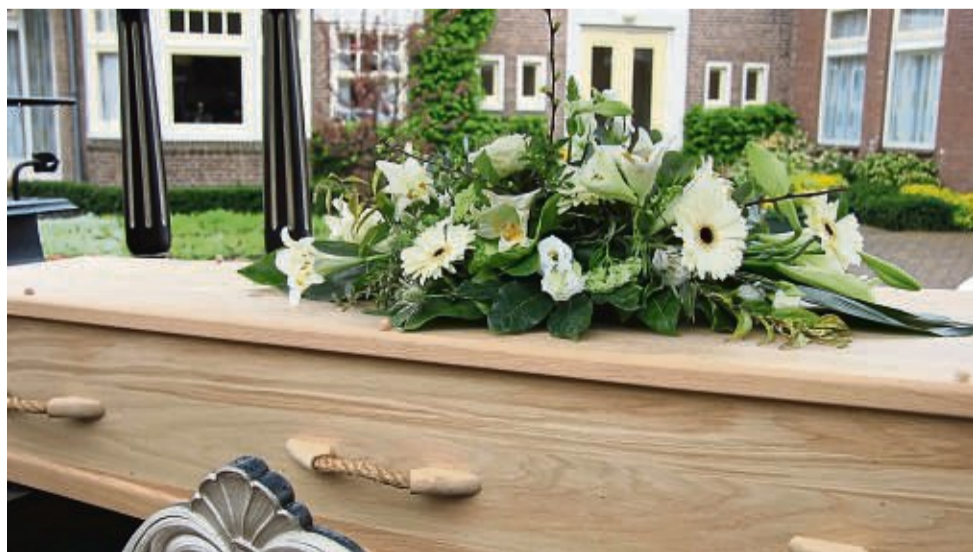
Auch Beerdigungsblumen auf einem Sarg können ein wichtiger Bestandteil bei einer Trauerfeier sein.