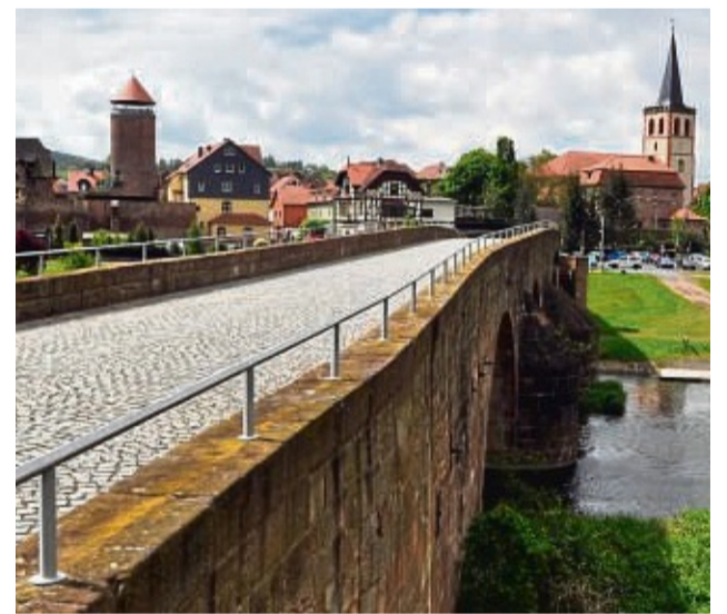
Zwar muss der Herzermarkt in diesem Jahr ausfallen, doch gibt es mit den wiederkehrenden Festen sowie der reichhaltigen Geschichte zahlreiche Gründe Vacha einen Besuch abzustatten.

Als eine der längsten Sandsteinbrücken führt die „Brücke der Einheit“ seit 1342 den Weg über die Werra in die Stadt. Neben vielen Berühmtheiten haben auch Goethe und Napoleon ihren Fuß darauf gesetzt. Aber Vacha ist weit mehr: Der ökumenische Pilgerweg endet in Vacha und ist Teil des berühmten mittelalterlichen Jacobsweg nach Santiago de Compostella. Vacha bietet eine tolle Pilgerherberge für Pilger an.