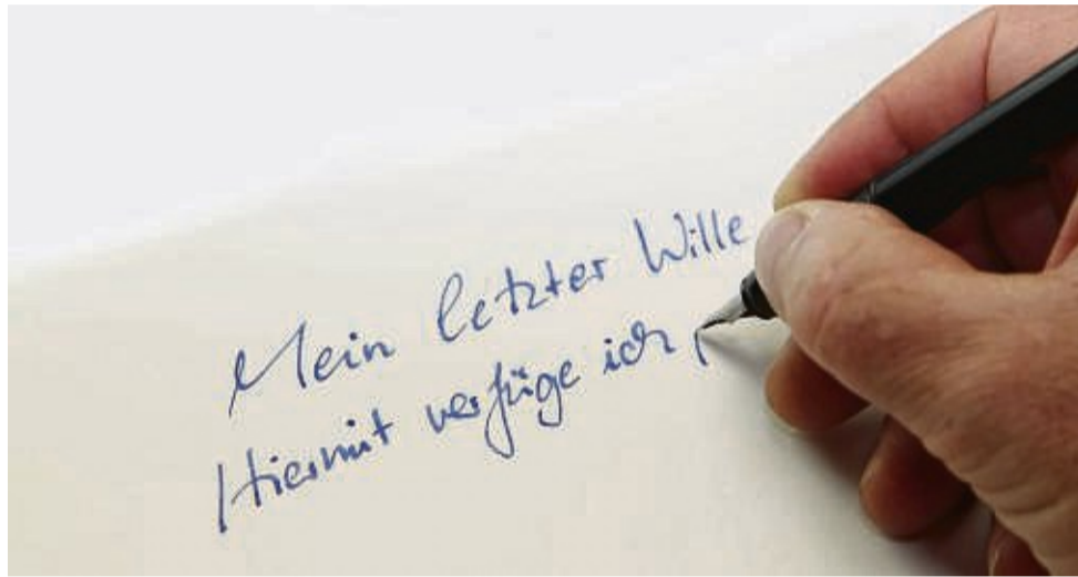
Sich frühzeitig über die Inhalte eines Testamentes Gedanken zu machen, ist nicht verkehrt.

Sie unterwerfen sich nicht nur umfangreichen Prüfungen durch die Behörden, sondern haben sich darüber hinaus zu klaren ethischen Richtlinien verpflichtet. „Dazu gehört eine respektvolle und sorgfältige Beratung, bei der die Interessen und Wünsche der potenziellen Erblasser oberste Priorität haben“, erklären die Berater.