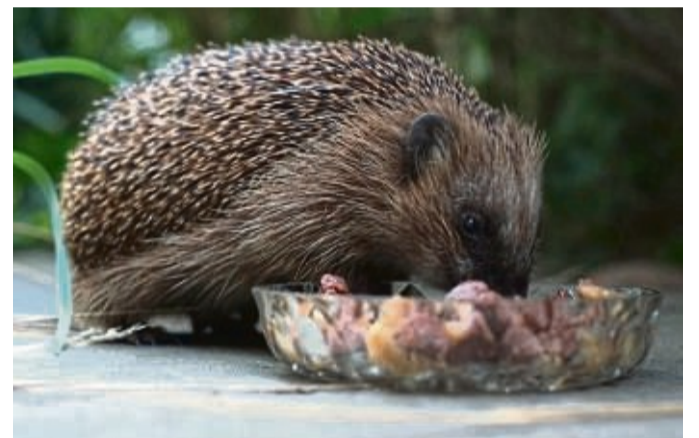
Igel können mit fettreichem Katzenfutter oder ungewürztem Rührei gefüttert werden.