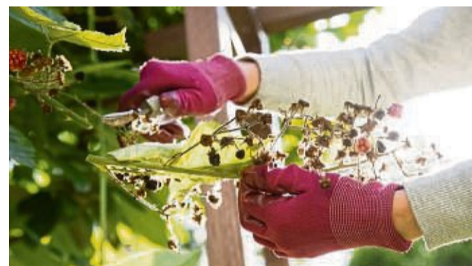
Es ist gut für die Tierwelt, den Rückschnitt von Gehölzen und Stauden lange hinauszuzögern.