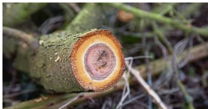
Wann eine Pflanze zurückgeschnitten wird, hat Einfluss auf ihre Entwicklung.

Den besten Zeitpunkt für den Gehölzschnitt finden