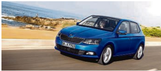
Fabelhafter Fabia? Wie der kleine Tscheche als Gebrauchtwagen abschneidet, sagen Experten von ADAC und TÜV.

Wer einen gebrauchten Kleinwagen sucht, kann zu Modellen wie Opel Corsa, VW Polo, Kia Rio und vielen weiteren greifen. Auch Skoda hat mit dem Fabia einen Kleinen im Programm – mit viel Polo-Technik.