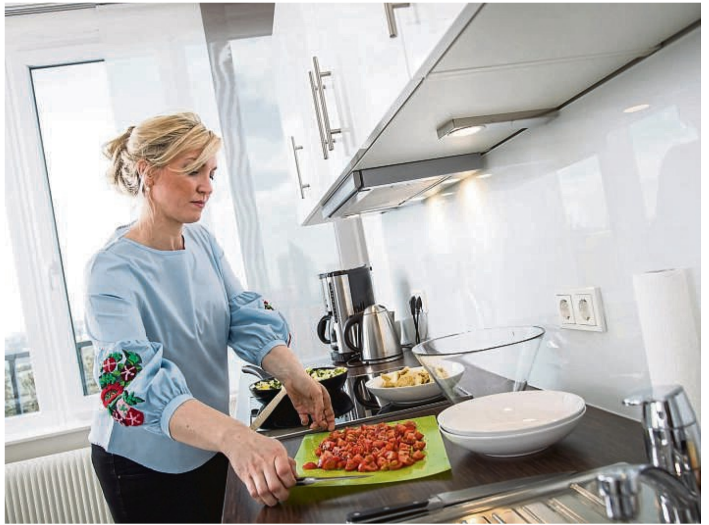
Was bekommt mir wann am besten? Ernährungspläne auf der Basis von DNA-Analysen sollen Antworten liefern.

„Es ist vollkommen richtig, dass Menschen Gen-Variationen aufweisen, die sich unterschiedlich auf den Stoffwechsel auswirken können“, sagt Verbraucherschützerin Dierks. Die Wissenschaft sei bei diesem Thema jedoch noch nicht weit genug. „Es