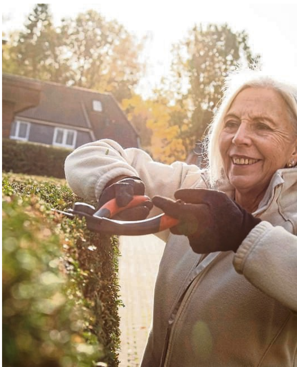
Nach dem Bundesnaturschutzgesetz ist es von Anfang Oktober bis Ende Februar erlaubt, Hecken, lebende Zäune und andere Gehölze stärker zu schneiden.

Wann geschnitten wird, hat auch Einfluss auf die Entwicklung der Pflanze. „Im Sommer schneiden wir zur