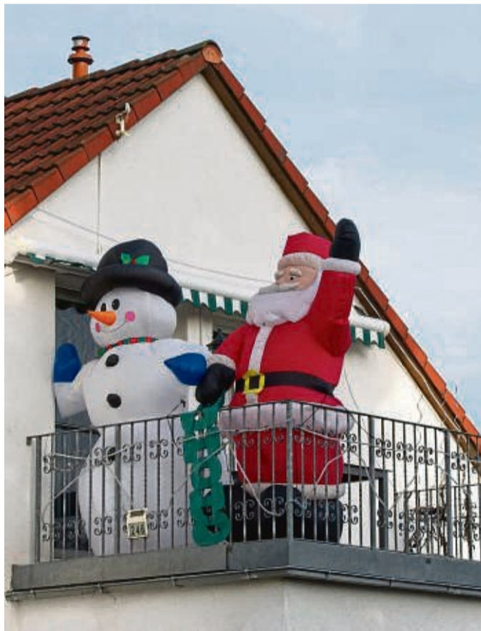
Wer riesige Deko auf dem Balkon aufstellt, muss dafür sorgen, dass sie gut gesichert ist.