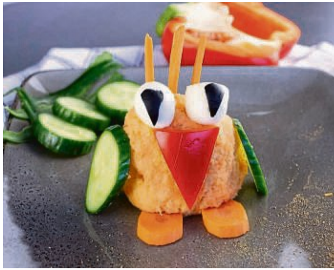
Aus Kartoffelbrei lassen sich niedliche Kartoffelbrei-Eulen zubereiten. Auch Kartoffel-Muffins sind aus übrig gebliebenen Kartoffeln schnell gemacht.