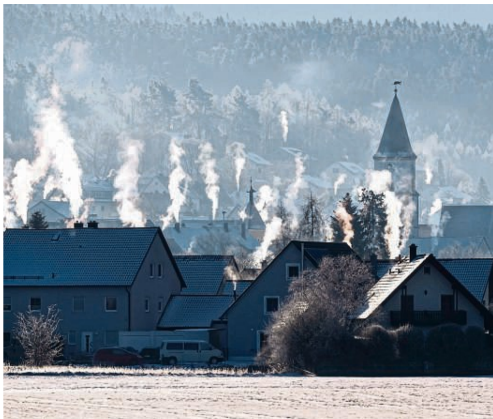
Schön anzusehen, aber nicht gut für die Umwelt: Auch Öfen in privaten Haushalten verursachen Feinstaub und schädliche Emissionen.

Es darf nur Holz im Ofen landen, dessen Wassergehalt bei maximal 20 Prozent beziehungsweise dessen Feuchtegehalt bei rund 25 Prozent liegt. Dies lässt sich mit einem Feuchte-Messgerät bestimmen, das im Handel erhältlich ist. Zur groben Orientierung: Für diese Werte ist, je nach Holzart, ein bis zwei Jahre Trocknungszeit nötig.