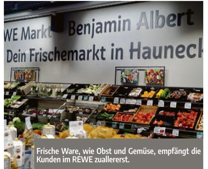
Frische Ware, wie Obst und Gemüse, empfängt die Kunden im REWE zuallererst.