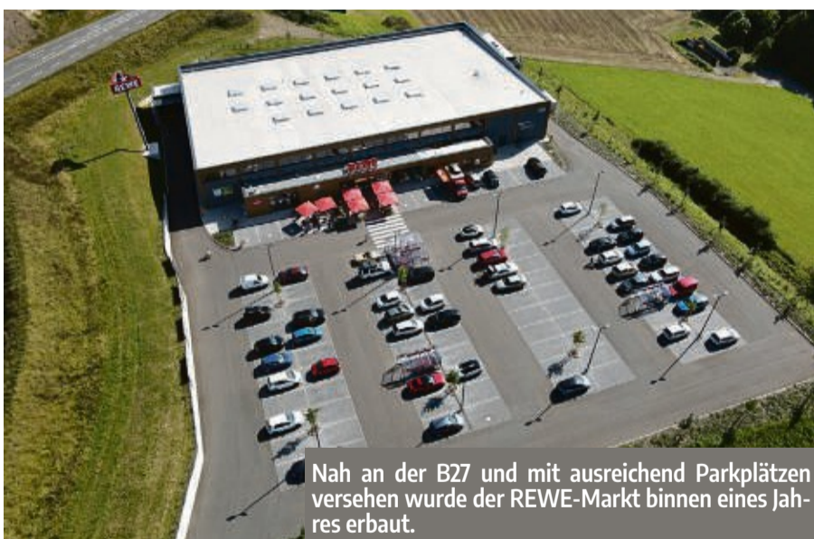
Nah an der B27 und mit ausreichend Parkplätzen versehen wurde der REWE-Markt binnen eines Jahres erbaut.