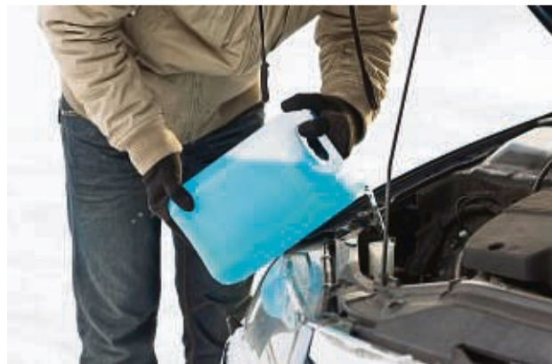
Sollte stets im korrekten Mischverhältnis im Auto sein: Frostschutzmittel für die Reinigung der Fenster während der Fahrt.

Immer noch häufig zu beobachten, jedoch verboten, ist das Warmlaufenlassen des Motors. Dies schadet nicht nur der Umwelt, sondern macht auch unnötig Lärm. Es droht ein Bußgeld von bis zu 80 Euro.