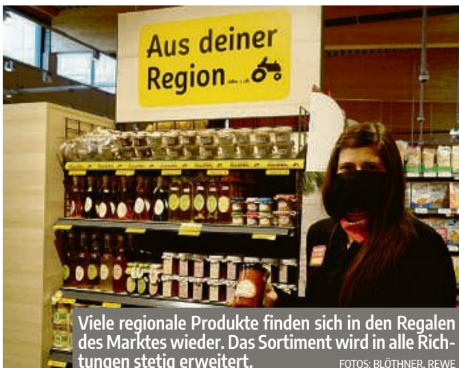
Viele regionale Produkte finden sich in den Regalen des Marktes wieder. Das Sortiment wird in alle Richtungen stetig erweitert.