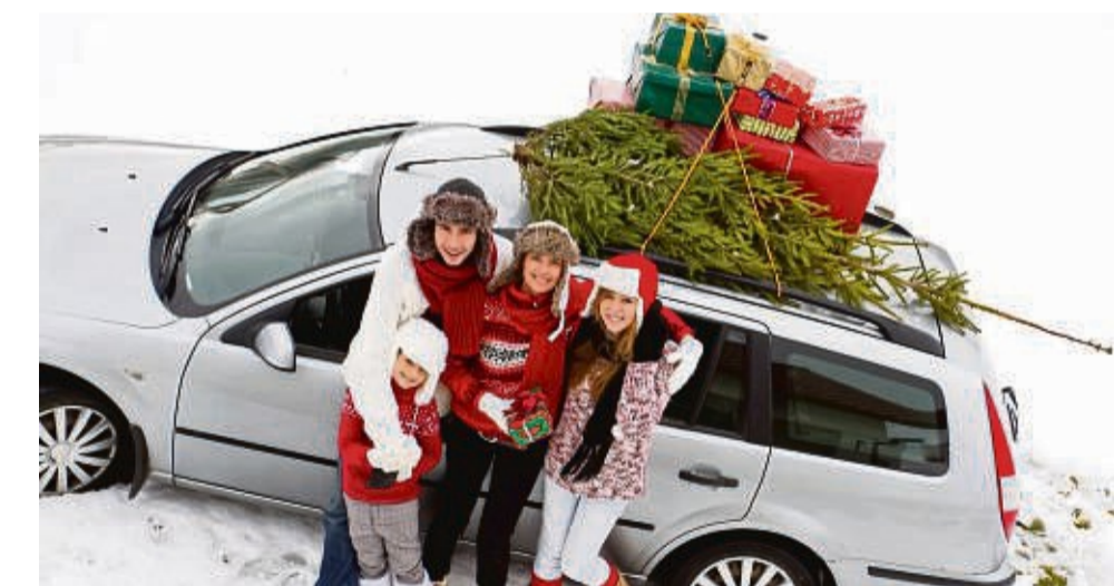
Damit Autofahrten im Winter gut gelingen, sollten Vorbereitungen getroffen werden, um im Ernstfall alles parat zu haben.

Beste und sicherste Lösung ist laut ADAC ein stabiler Eiskratzer aus Kunststoff. Eine umweltschädlichere Alternative sind Enteisungssprays. Dass man für freie Sicht die Finger von einem Kessel mit heißem Wasser lassen sollte, dürfte sich mittlerweile überall he-