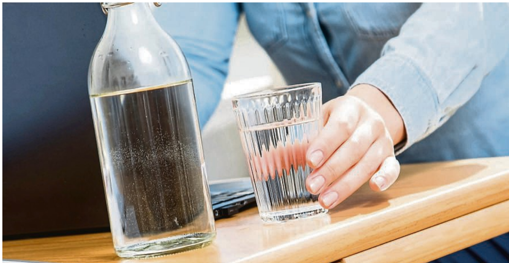
In Sachen Flüssigkeitsaufnahme ist es ratsam, auf das eigene Durstgefühl zu hören.