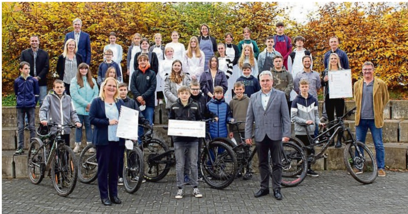
Bei der Verleihung des Gesamtzertifikats „Gesundheitsfördernde Schule“ an die Gesamtschule Niederaula.

Gesamtschule Niederaula erhält Zertifikat