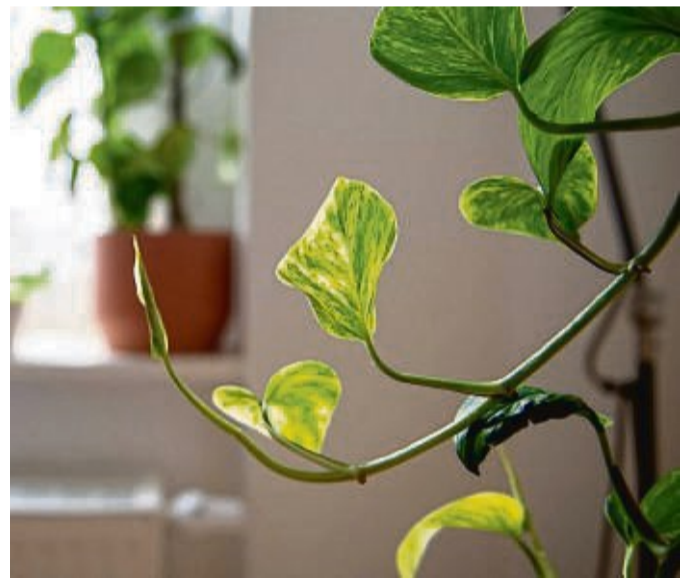
Es ist besser für Pflanzen, wenn sie nicht unmittelbar der Heizungswärme ausgesetzt sind.