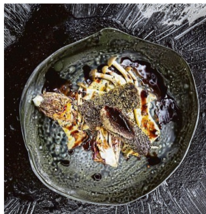
Rehrücken vom Grill, der auch wunderbar zum Weihnachtsmenü passt, kann mit ebenfalls gegrilltem Radicchio und Pilzen serviert werden.