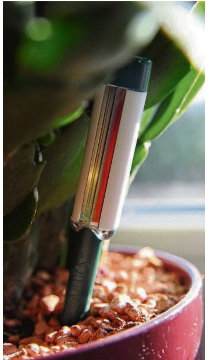
Mit einem Bewässerungssystem kann auch im Winter gut im Blick gehalten, wann eine Zimmerpflanzen Nachschub braucht.

Das Lüften an kalten Wintertagen ist auch nicht immer gut für die Zimmerpflanzen. „Wenn sich der Mensch im Zug unwohl fühlt, tut es die Pflanze auch“, sagt Jürgen Herrmannsdorfer. Gefährlich werden kann Zugluft mit Temperaturen von unter zehn Grad für Pflanzen mit kleinen und weichen Blättern, etwa das Einblatt. Stellen Sie die Pflanze während des Stoßlüftens einfach kurz woanders hin.