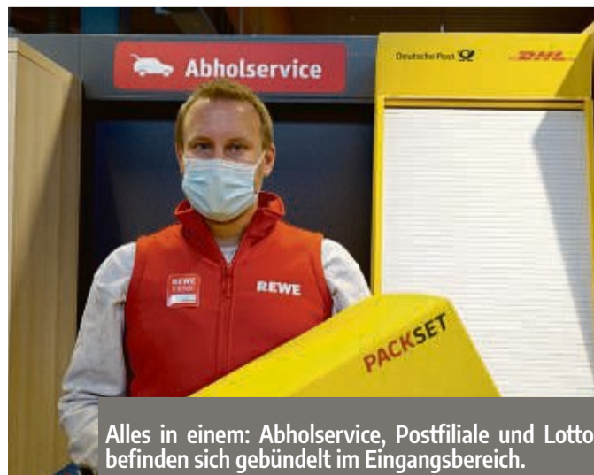
Alles in einem: Abholservice, Postfiliale und Lotto befinden sich gebündelt im Eingangsbereich.