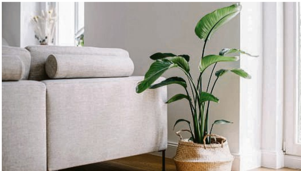
Vor allem im Winter brauchen die meisten Zimmerpflanzen einen Standort, der nah am Fenster liegt.