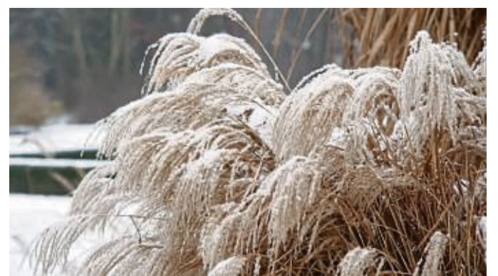
Gräser wie das Chinaschilf sind mit Schnee bedeckt ein schöner Hingucker im Garten.