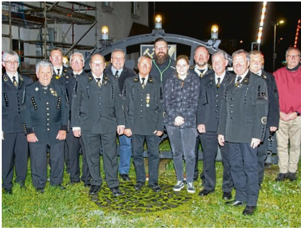
Neuer Vorstand des Bergmannsvereins Glückauf Wintershall vor dem Schwißbogen.