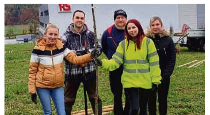
Pflanzaktion: Mitarbeiter von RS Components und Vertreter des Nabu haben auf dem RS-Betriebsgelände 30 Apfelbäume gepflanzt.

Bad Hersfeld – Das Unternehmen RS Components hat an seinem Standort Bad Hersfeld ein Zeichen in Richtung Nachhaltigkeit gesetzt. Während eines Freiwilligenprojektes pflanzten Mitarbeiter 30 Apfelbäume unweit des kürzlich erweiterten RS Distributionszentrums, teilt das Unternehmen mit. Auch die regionale Gruppe des Naturschutzbundes war vertreten und unterstützte bei der fachgerechten Ausführung. So entstand neuer Lebensraum für Insekten und Vögel. Die Zahl 30 ergab sich aus der Tatsache, dass RS in diesem Jahr seit 30 Jahren auf dem deutschen Markt präsent ist. Das Thema Nachhaltigkeit hat bei RS einen hohen Stellenwert. Dank einer Fotovoltaikanlage auf dem Dach gewinnt RS am Standort Bad Hersfeld einen großen Teil der notwendigen Energie aus regenerativen Quellen. Gleichzeitig sorgen optimier-