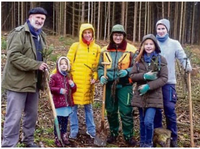
Fleißige Helfer bei der Baumpflanzaktion der Sparkasse Bad Hersfeld-Rotenburg und Hessen Forst.

Auf einer etwa zwei Fußballfelder großen Fläche im Wald bei Schenklengsfeld