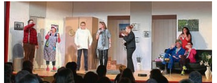
Auf wieder ausverkaufte Vorstellungen im Theatertreff in Breitenbach am Herzberg hofft die Theatergruppe Klarteckst für die Spielsaison 2022 ab dem 29. Januar nach über einem Jahr Zwangspause. Das Bild entstand während der äußerst gelungenen letzten Premiere im Oktober 2019.