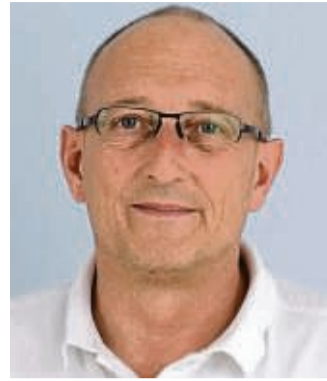
Werner Hampe Klinikum Bad Hersfeld

alle Neugeborenen aus dem Kreis Hersfeld-Rotenburg. Zwar bringt nicht jede Mutter aus dem Landkreis ihr Kind im hiesigen Klinikum