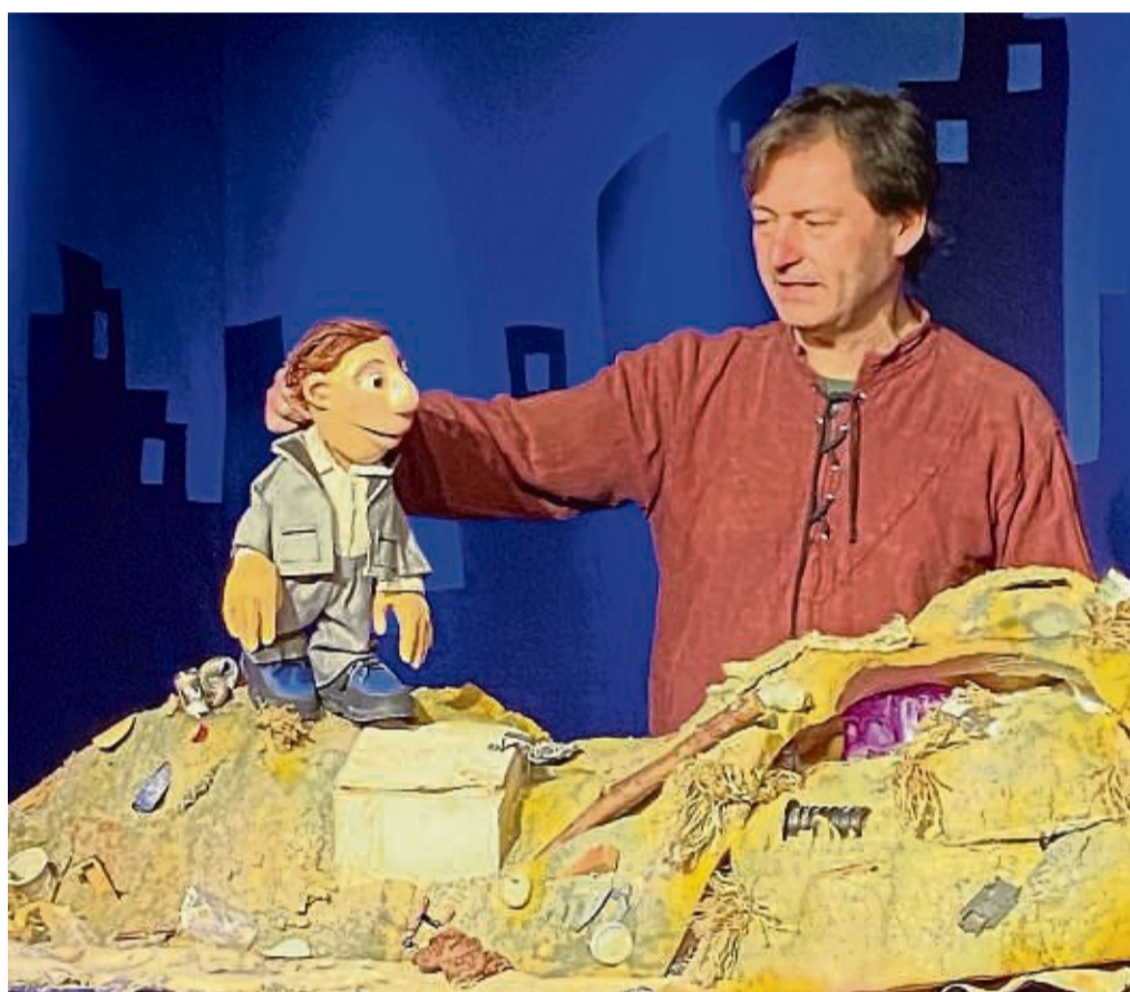
Ferdinand im Müll, Buchfinktheater Göttingen.

Für die Kleinsten in den Kindergärten spielte das „Spielraum-Theater“ aus Kassel ohne viele Worte ein sehr fantasievolles Stück, indem sich zwei unterschiedliche Charaktere aus unterschiedlichen Positionen „Kisten &