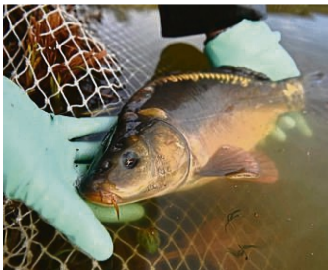
Der nachhaltigste Fisch überhaupt: In Einkaufsratgebern wird der Karpfen uneingeschränkt empfohlen.

Was Ostseefisch betrifft, geht es den Beständen der meisten Plattfische wie Scholle, Flunder, Steinbutt oder Kliesche laut Froese einigermaßen gut. Schöttner rät generell von großen, sehr gefragten und deshalb überfischten Raubfischarten wie