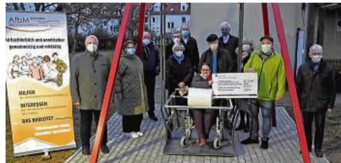
Neues Freizeitangebot am Standort der Sozialen Förderstätten in Bebra: Einige Spender kamen zur offiziellen Übergabe der Schaukel extra für Rollstuhlfahrer.