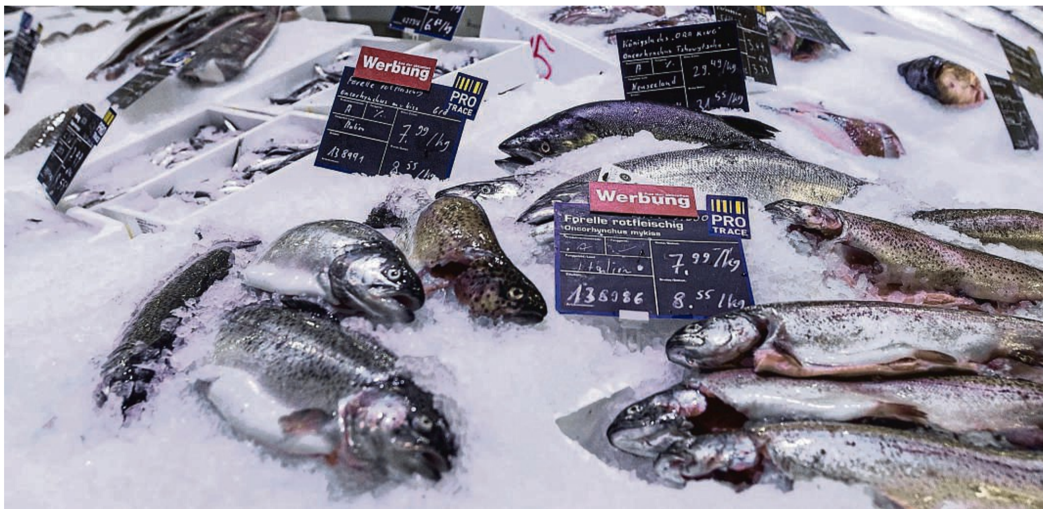
Forellen liegen auf Eis in der Fischtheke und zählen zu den lachsartigen Fischen. Umweltschützer sind für eine Reduzierung der kommerziellen Fänge und der Fangmengen in der Freizeitfischerei. Dort werden Lachse oft als Meerforellen falschgemeldet, was die Datenlage verzerrt.