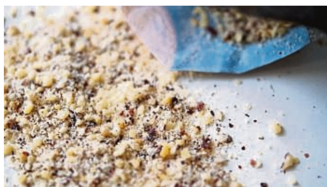
Wenn nicht die komplette Tüte mit gemahlener Nüssen verwendet wird, sollte der Rest rasch verbraucht werden.

Am besten lagert man gemahlene, gehobelte oder gehackte Nüsse im Kühlschrank. Dort halten sie sich maximal vier Wochen. Sie können auch eingefroren