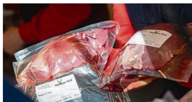
Wer Wert auf heimisches Wild legt, sollte beim Kauf auf die Herkunft achten.