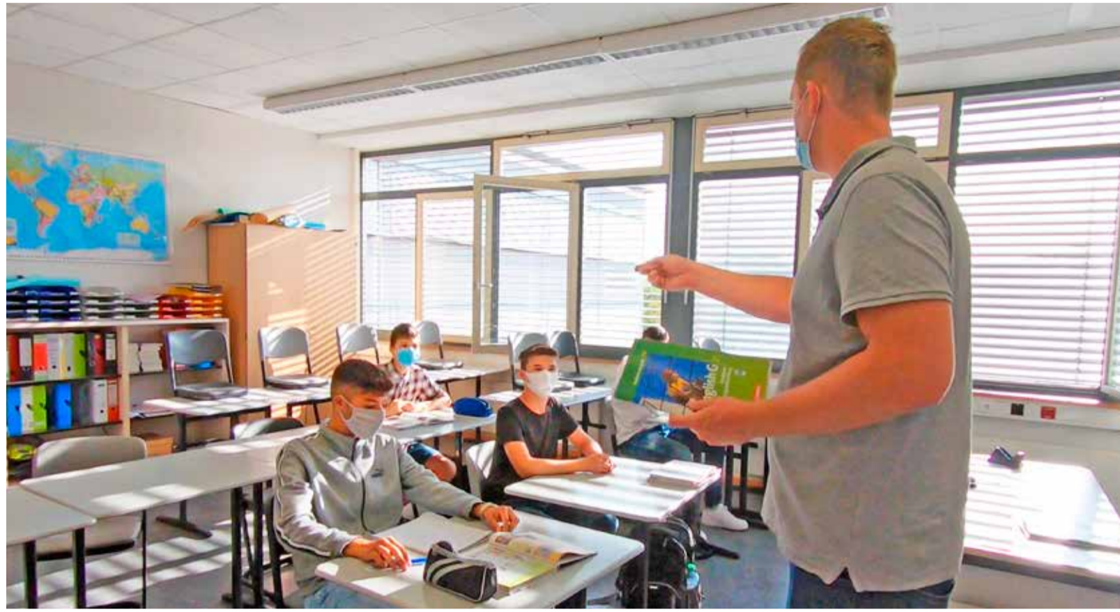
Unterricht in der IGS-Main Spitze