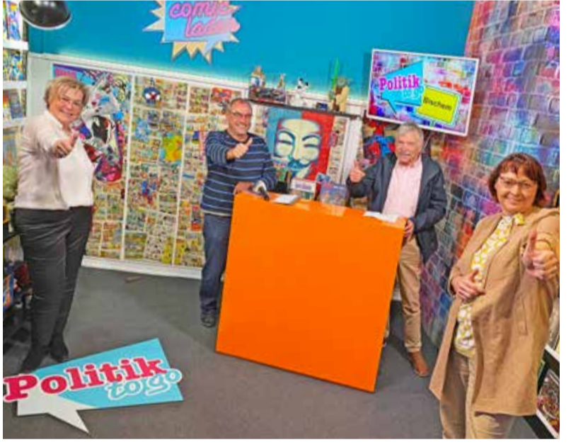
Erste Folge von »Politik to go [Bischem]« siehe Seite 7.

lichen Teils von Bischofsheim. Kurze Wege, frische Produkte und eine neue Mitte für diesen Bereich, das ist ein wichtiger Entwicklungsschritt für die Zukunft unseres Ortes. Zusätzlicher Wohnraum, die Erhaltung von Parkplätzen für Anwohner und Friedhofsbesucher, sowie die zusätzliche Schaffung von Arbeitsplätzen – mehr kann man von einem Projekt, wie diesem nicht verlangen.“ Bevor die Bagger anrollen können, muss der Bebauungsplan aufgestellt werden. Das Bebauungsplanverfahren wird bis zu einem Jahr in Anspruch nehmen. Es kann davon ausgegangen werden, dass spätestens im Sommer 2021 der erste Spatenstich erfolgen wird.