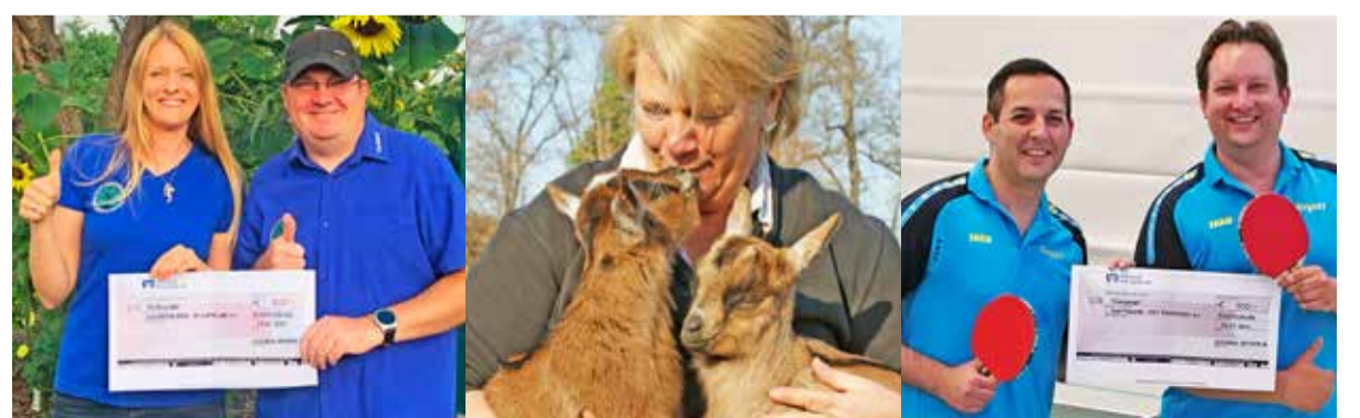
Beim blättern durch das Fotoalbum der Volksbank Mainspitze findet man zahlreiche Bilder von Vereinsaktiven, die sich über einen Spendenscheck – zum Teil sogar tierisch – freuen.

Für die bevorstehende Generalversammlung, zu der die Mitglieder der Volksbank Mainspitze eG in den vergangenen Jahren stets in eines der Bürgerhäuser geladen waren, haben sich die Vorstände für das Corona-Jahr 2020 eine besonders sichere Variante überlegt: Zum ersten Mal findet die Generalversammlung virtuell statt. Los geht's am 19. Oktober, um 19 Uhr. Eine Anmeldung bis 14. Oktober ist unter dem Link https://t1p.de/volksbank-mainspitze notwendig. Teilnehmen können ausschließlich Mitglieder der Volksbank. Ablaufen wird die Generalversammlung so, wie man sie kennt, mit dem Unterschied, dass man nicht vor Ort, sondern übers Internet live dabei ist. Die Möglichkeit, in Echtzeit schrift-