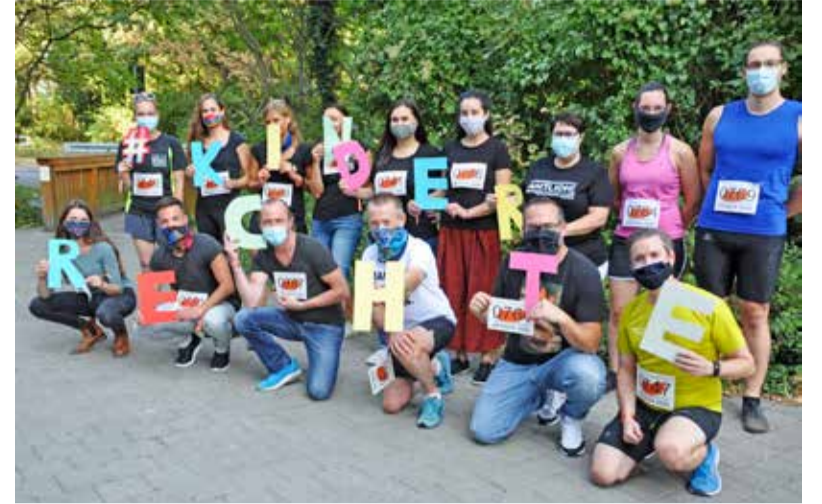
Ein Teil des Teams „In Bewegung für Kinderrechte“ fand sich zu Beginn der Aktion am Groß-Gerauer Landratsamt zusammen.

Kreisverwaltung Groß-Gerau – Seit dem 21. September hieß es im Kreis Groß-Gerau: In Bewegung für Kinderrechte. Botschafter*innen aus allen Fachbereichen der Kreisverwaltung setzten sich für Kinderrechte in Bewegung – rollend, laufend oder gehend. Dahinter steckt eine hessenweite Spendenaktion, initiiert von Makista e.V., einem seit 20 Jahren für die Demokratie- und Kinderrechtsbildung engagierten und gemeinnützigen Verein. Nach einem Startschuss am Weltkindertag in Butzbach kam auch die Kreisverwaltung Groß-Gerau in Bewegung. Das Ziel, die Gesellschaft auf die Rechte von Kindern aufmerksam zu machen, hat sich das Team des Büros für Integration des Kreises Groß-Gerau zu Herzen genommen und für die Kreisverwaltung die örtliche Spendenaktion organisiert. So setzte sich ein 30-köpfiges Team vom 21. bis 30. September in Bewegung nach dem Motto: „Mit notwendigen Hygieneregeln in Kontakt und in Bewegung bleiben für Kinderrechte“. Denn durch die Sorge über die Ausbreitung des Covid-19-Erregers sind die Bedürfnisse von Kindern und Jugendlichen an vielen Stellen aus dem Blick geraten. Noch immer besteht die Gefahr, dass sie in wesentlichen Rechten beschränkt, ihre Sicht der Dinge nicht ausreichend gewürdigt und ihr