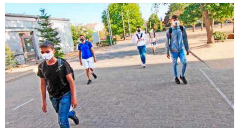
Schülergruppen nutzen unterschiedliche Eingänge ins Schulgebäude.