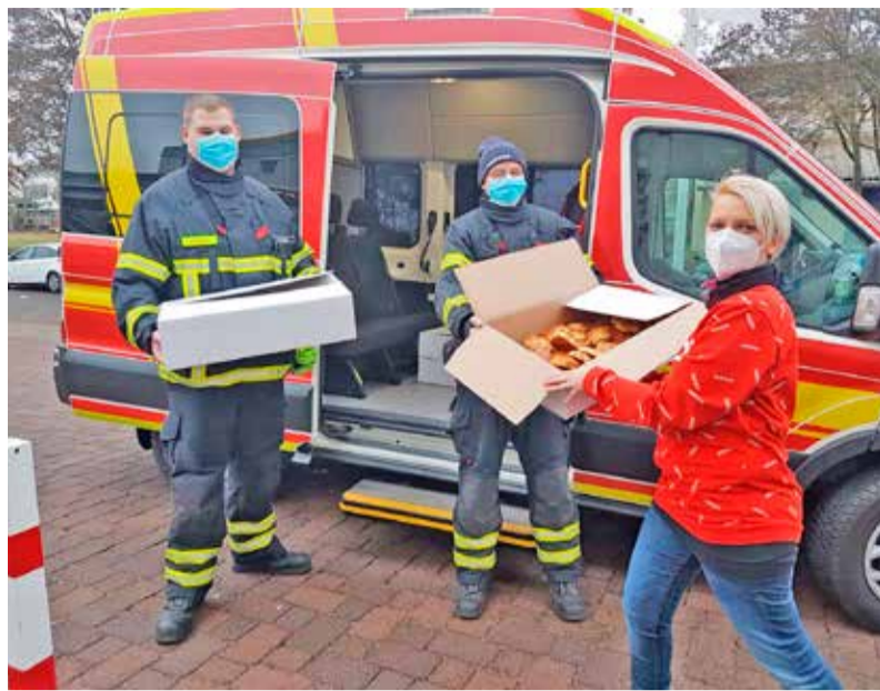
Schon seit Jahren unterstützt die Stadtteilfeuerwehr Gustavsburg das Haus Mainblick bei der Ausrichtung des regelmäßigen Sommerfestes.