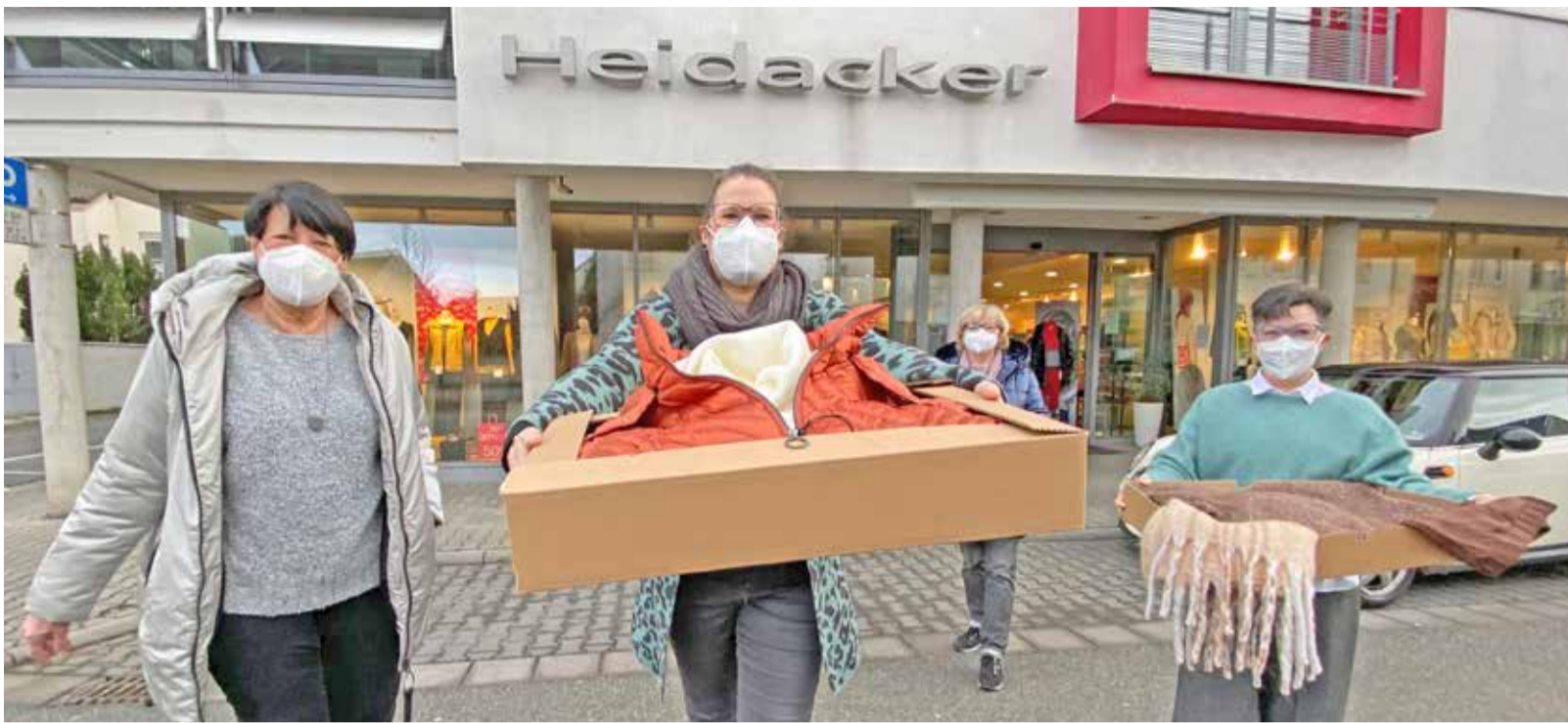
Das Team des Modehaus Heidacker in Bischofsheim bietet „Mode to go“ an

Für diesen Beitrag sprach ich mit vier Inhabern von Einzelhandelsgeschäften