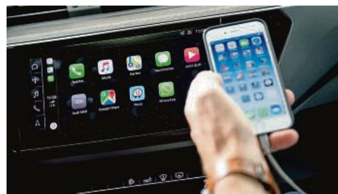
Handy verbinden und ab dafür: Manche Apps lassen sich auch auf das Auto-Display spiegeln.