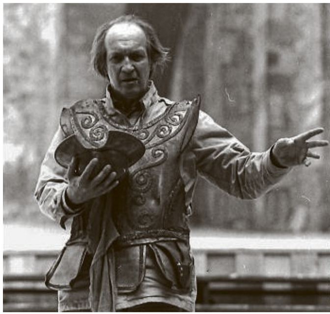
Der Mann von la Mancha: 1982 spielte Ernst Stankovski die Hauptrolle im ersten Musical, das in der Bad Hersfelder Stiftsruine gezeigt wurde (Bild links).

Es war das erste Musical, das bei den Bad Hersfelder Festspielen aufgeführt wurde, und das nicht nur zu einem sensationellen Erfolg wurde, sondern auch eine Zäsur in der Geschichte des Theaterfestivals bedeutete. Gemeinsam mit Jörg Schneider erhielt Stankovski damals den Großen Hersfeldpreis. „Er hat Festspielgeschichte geschrieben“, heißt es denn auch auf der Facebook-Seite der Festspiele, die kurz nach seinem Tod am 26. Januar mit einem Foto aus „Der Mann von La Mancha“ an den bekannten Darsteller erinnerten. Einem breiten Fernsehpublikum dürfte Stankovski aber unter anderem auch aus Traumschiff, Tatort und Der Bulle von Tölz bekannt gewesen sein, die Liste seiner Filmografie ist lang. 1982 mit Ernst Stan-