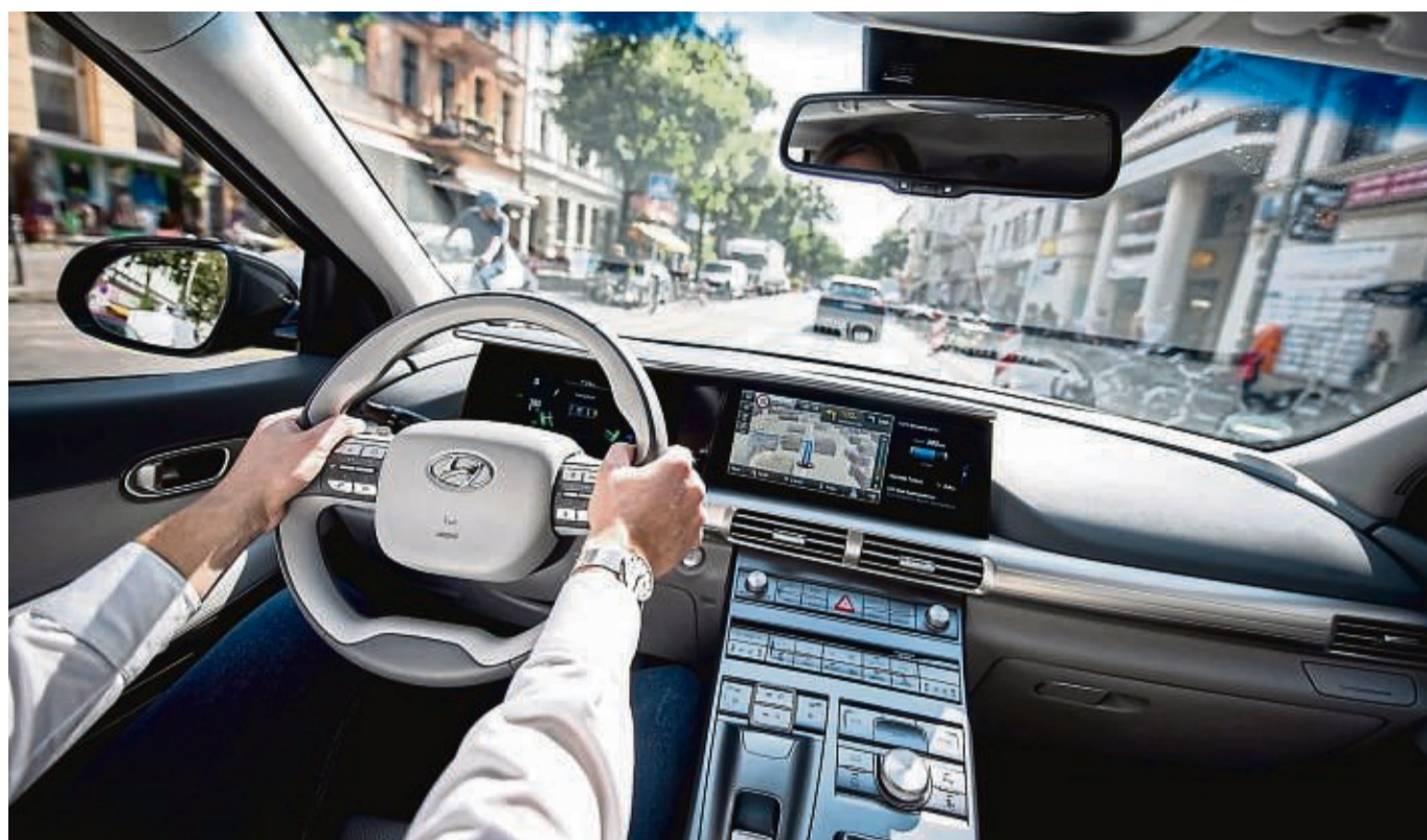
Entspannt und konzentriert am Steuer: Anwendungen haben im Hintergrund die passende Route errechnet und führen wie gewünscht zum Ziel.