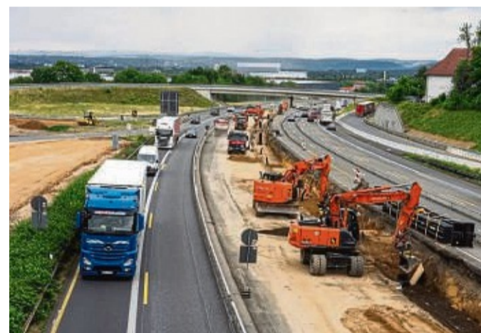
Bei Bickhardt schafft man gern: Die Baufirma aus Kirchheim gilt als Top-Arbeitgeber in der Branche. Das Foto zeigt Baufahrzeuge beim grundhaften Ausbau der A 7 bei Kassel.

können. Aufgrund der aktuellen Hygiene- und Abstandsregelungen finden alle Kurse in kleineren Gruppen statt. Weitere Informationen zur Anmeldung und zum Hygienekonzept unter vhs-hersfeld.de oder 066 21/87 63 03. Schriftliche Anmeldung ist bis Donnerstag, 27. Januar, bei der Volkshochschule erforderlich. red/fej