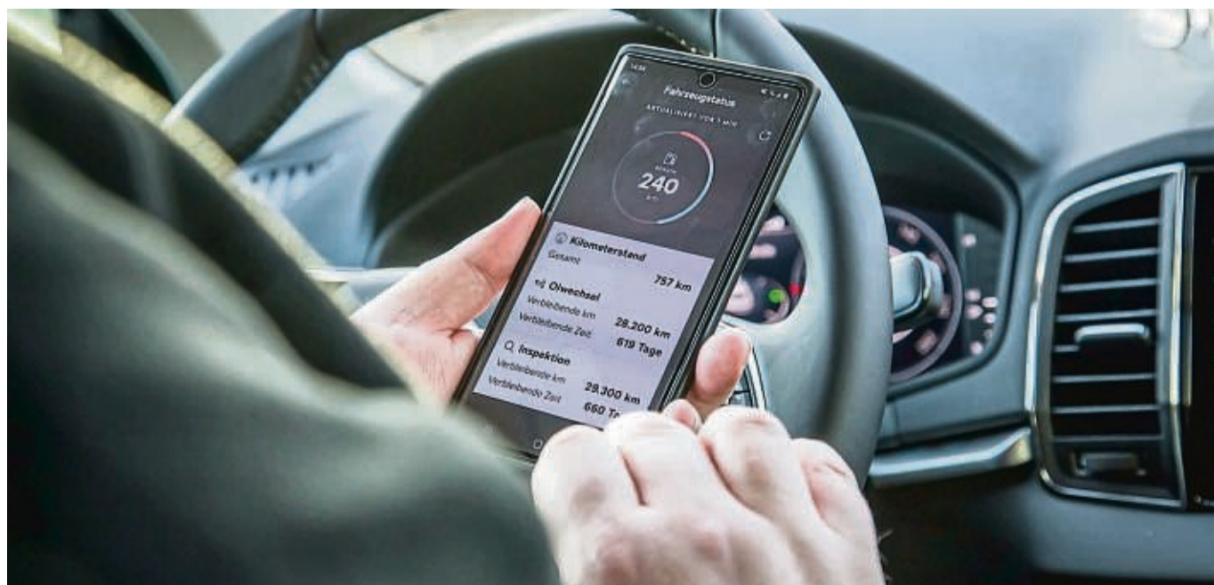
Alles im Blick: Manche Apps halten die Besitzer über wichtige Daten des Autos auf dem Laufenden.

Kissen | Decken | Bettwäsche | Topper Sleepwear | Zubehör | Beratung