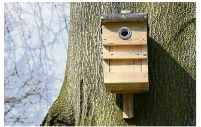
Quartier für heimische Vögel: Das Bild zeigt einen Nistkasten der Marke Eigenbau mit Metallring als Spechtschutz.

Die Kosten von 5,5 Millionen Euro werden laut MER-Geschäftsführer Schäfer mit Geld aus dem Stadtumbau gedeckt – zwei Drittel stammen aus Förderprogrammen. Diesen Anteil will die MER mit der Bewerbung bei einem weiteren Förderprogramm noch ausbauen.