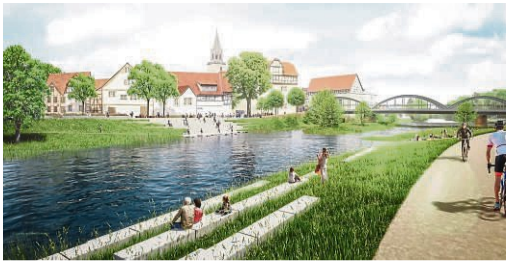
Blick auf die Freitreppe: So soll das Fulda-Ufer nach der Umgestaltung aussehen. Von Sitzgelegenheiten auf Höhe des Restaurants Bacco blickt man auf die große Freitreppe vor der ehemaligen Hafenanlage.