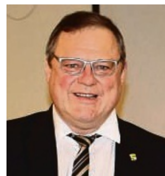
Manfred Koch Bürgermeister