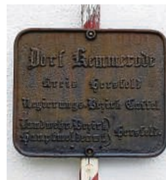
Über Niederaula und die Scheune an der Aula fand die Ortstafel den Weg vor das Büro des Bauunternehmens Stutz.