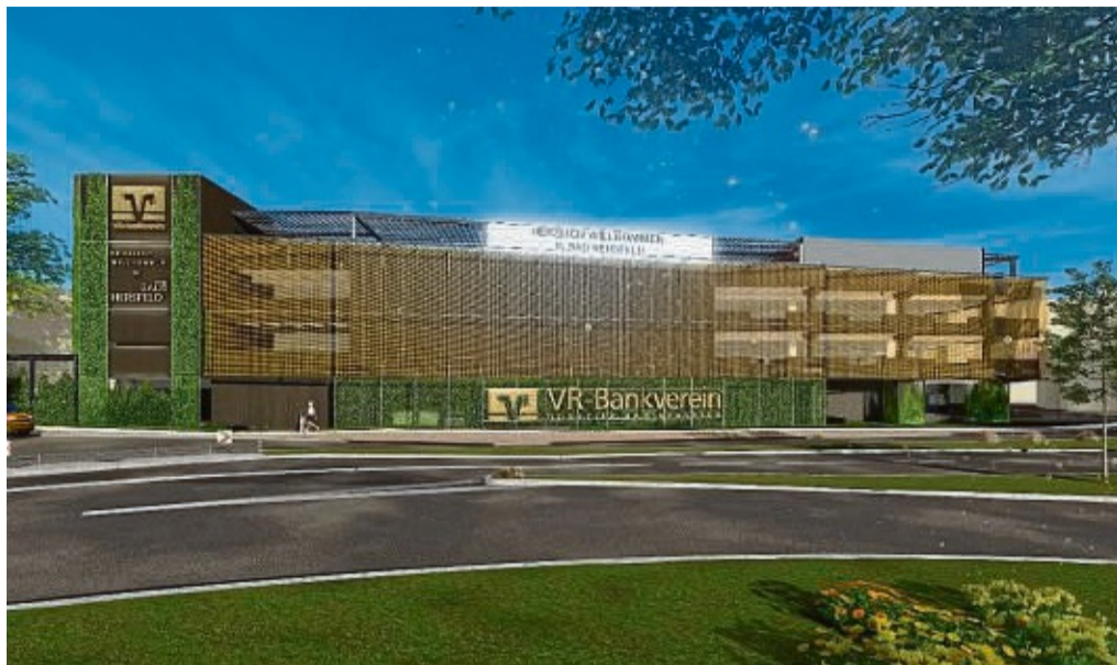
„Initialzündung für die Innenstadt“: Das VR-Parkhaus im ehemaligen Herkules-Center wird zu einem Multifunktionsgebäude umgestaltet. FOTO: VISUALISIERUNG ARCHITEKTURBÜRO BEIER/NH

Außerdem werde das neue VR-Parkhaus über eine „schrägenfreie Free-Flow-Zufahrt mit Kennzeichenerkennung“ und anderweitigem Komfort verfügen. Das Gebäude sei zudem klimafreundlich und CO2-neutral ausgerichtet. Die Gebäudebe-