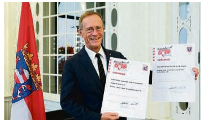
Wegen der Corona-Pandemie kann Staatsminister Axel Wintermeyer die Förderungen nicht persönlich an die Vereine überreichen.

Der Untergrund wird von den Vereinsmitgliedern ehrenamtlich aufbereitet und verfüllt. Das Land beteiligt sich an diesem Projekt mit 1716 Euro. Der Feuerwehrverein Bad Hersfeld-Asbach will auf der Terrasse des Feuerwehrhauses Bänke und Tische aufstellen, um das Miteinander zu stärken. Der Ver-