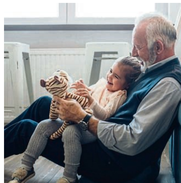
Die Gesellschaft wird immer individueller, das schlägt sich auch in den neuen Formen der Bestattungskultur nieder.