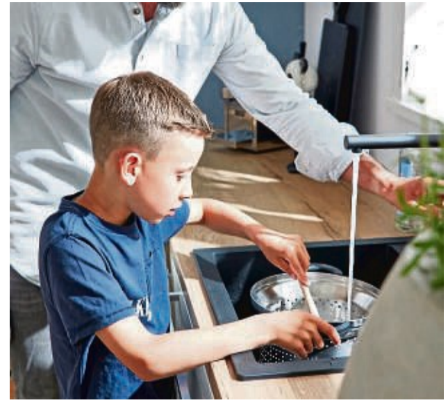
Ressourcen schonen: Wo immer es geht, sollte man Strom und Wasser einsparen.