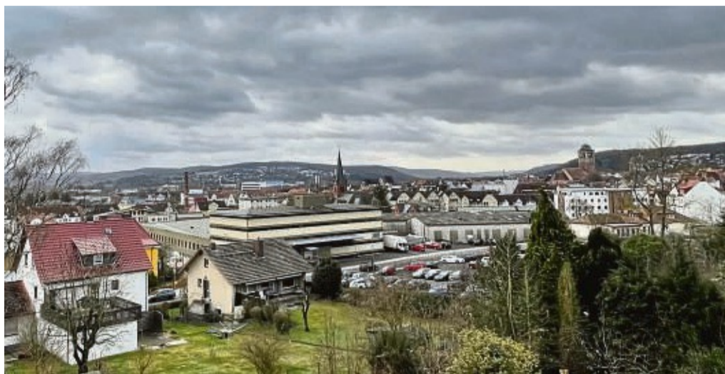
Dunkel Wolken über Bad Hersfeld: Das Wever-Projekt zur Stadtentwicklung ist gescheitert. Unser Foto zeigt das innerstädtische Areal in der Nähe des Bahnhof und den markanten Turm der katholischen Kirche.

„Der Flächenverkauf und der Umzug der bestehenden Unternehmen auf dem Gelände sind notwendige Voraussetzungen für das Projekt. Ein „Knackpunkt“ war die Tatsache, dass der ursprünglich vorgesehene Kauf einer vorhandenen Halle am Europakreisel für den Umzug der Hersfelder Kleiderwerke (HKW) aus unterschiedlichen Gründen 2020 nicht zustande kam“, heißt es in der Mitteilung unter Berufung auf die Projektleitung der Stadt.