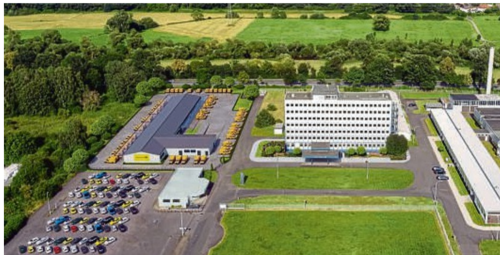
Am Fuße des Obersbergs und direkt an der B27: Das wiederbelebte „Krone-Hochhaus“ und links daneben die Visualisierung des neuen Postverteilzentrums, wie es einmal aussehen soll.