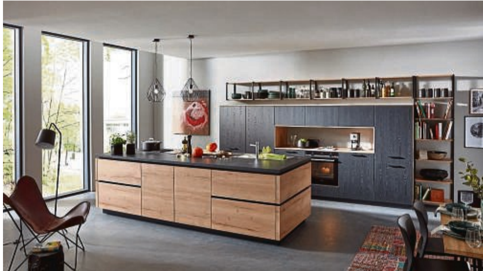
Viele Küchenmöbel werden inzwischen aus Rohstoffen wie Holz und Holzwerkstoffen hergestellt, welche aus nachhaltig bewirtschafteten Wäldern stammen.

„Bei der Einrichtung der Küche lässt sich einiges für den schonenden Umgang mit den natürlichen Ressourcen tun. Zum Beispiel, indem man darauf achtet, dass die Küchenmöbel aus Holz und Holzwerkstoffen produziert werden, welche aus nachhaltig bewirtschafteten Wäldern stammen“, erklärt Marko Steinmeier von KüchenTreff, einer Einkaufsgemeinschaft von mehr als 400 inhabergeführten Küchenstudios und Fachmärkten in Deutschland und anderen europä-