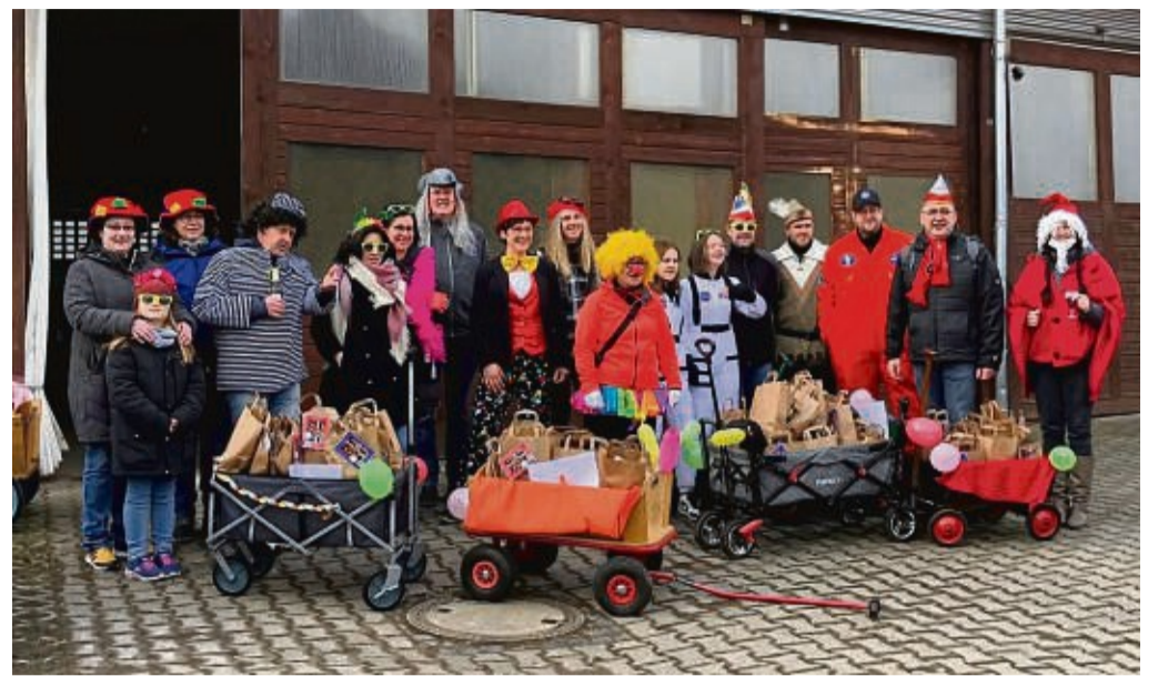
Verpacken den Frohsinn: Der KCV Ronshausen mit seinen fleißigen Helfern.

So konnten sich alle Narren zu Hause, zusammen mit den Lieben, die Prunksitzung