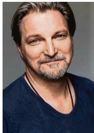
Ist zu Gast in Bebra: Sänger, Schauspieler und Comedian Stefan Jürgens.