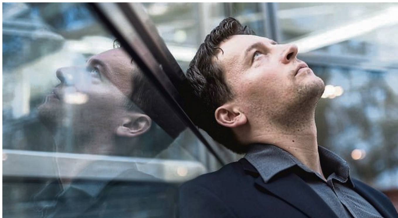
Viel zu oft malen wir uns vor beruflichen Herausforderungen aus, was alles schief gehen könnte.