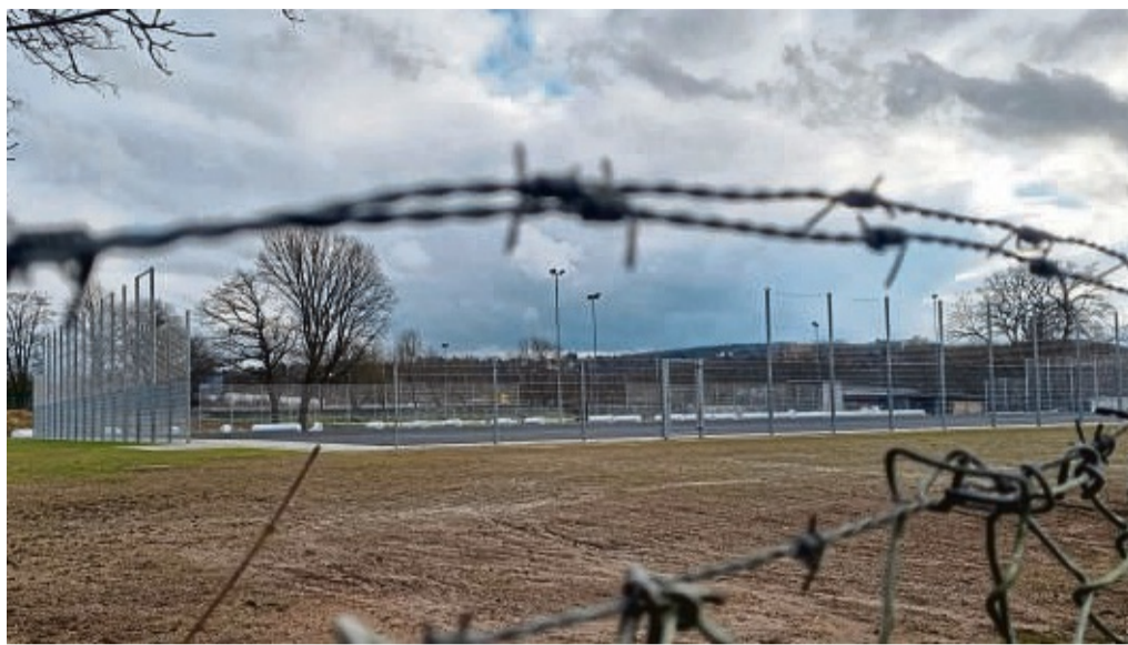
Still ruht der Platz: Erst im Frühjahr kann am Kunstrasenplatz im Stadion an der Oberau in Bad Hersfeld weiter gebaut werden. Das Gelände ist abgesperrt.

Und auch das eigentliche Rasenfeld sei bis zur elastischen Tragschicht fertig, berichtet der Fachbereichsleiter Technische Dienste. Der noch fehlende Kunstrasen könne jedoch erst nach der Winterpause sauber und glatt verlegt werden, da sowohl die Temperaturen als auch die Luftfeuchtigkeit stimmen müssten. Ansonsten könne das Material nicht