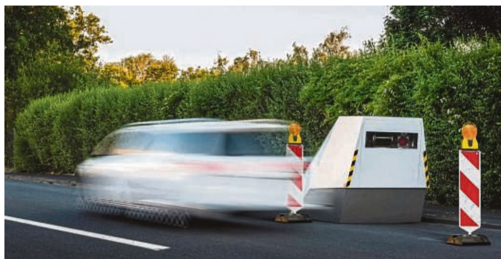
Bitte recht freundlich: Der 150 000 Euro teure Enforcement-Trailer, ein Hightech-Blitzer, der wie ein abgestellter Anhänger aussieht, überwacht seit 2017 die heimischen Autobahnen.