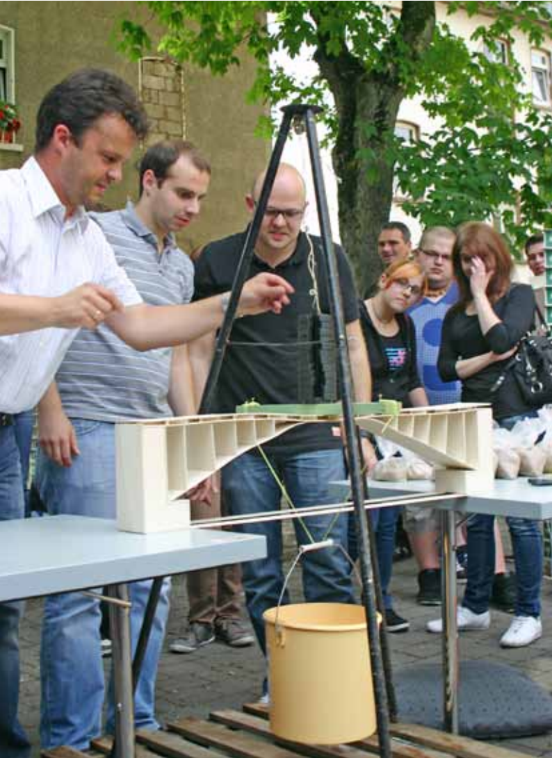
Bei diesem Prüfertrio hält jedes Brückenmodell so lange, ...