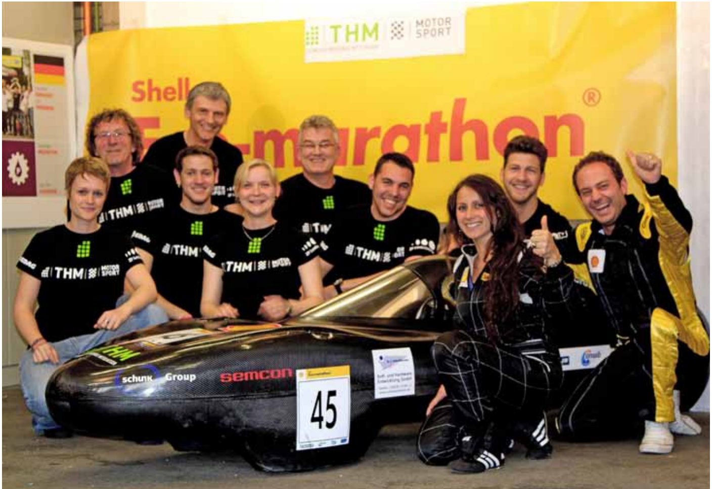
Die THM stellte das beste deutsche Team beim Shell Eco Marathon.

„Bestes deutsches Team in der Königsdisziplin waren die Studenten der Technischen Hochschule Mittelhessen“. So brachte das Fachblatt „AutoBild“ den jüngsten Erfolg des Rennstalls der THM auf den Punkt. Beim 29. „Shell Eco Marathon“ in Rotterdam schaffte das Team „THM Motorsport Efficiency“ mit einem Liter Benzin eine Strecke von 1046 Kilometern. Der Streamliner V3 belegte in der Kategorie Prototype Ottomotor unter mehr als 50 Startern aus fast 20 Ländern den siebten Platz.