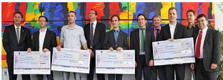
Die Auszeichnung von Wirtschaftsinformatikern durch Firmen hat an der THM in Friedberg Tradition.