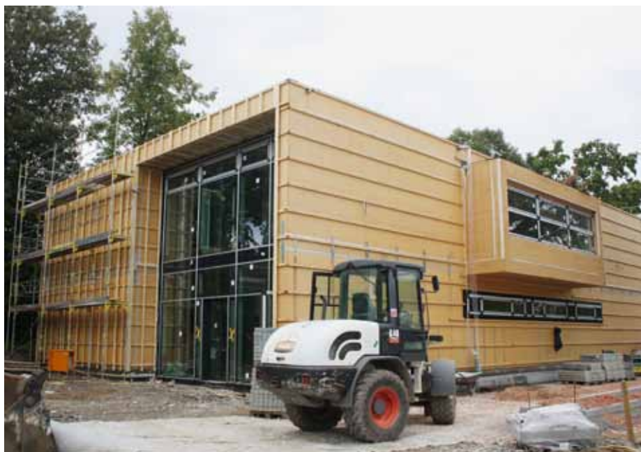
Der Neubau wird in diesem Herbst bezugsfertig sein.