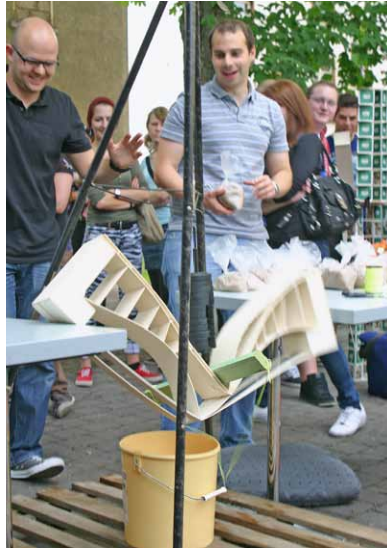
...bis es bricht.