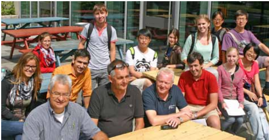
Mittagspause: die Studierenden der Summer University mit ihren Dozenten aus Darmstadt und Gießen draußen vor der Mensa am „Campustor“ der THM

Einen eintägigen Arbeitsbesuch machte die „International Summer University 2013“ der Hochschule Darmstadt an der