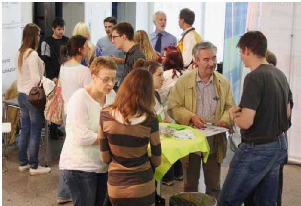
Viele Studieninteressierte nahmen die Gelegenheit wahr, sich am Beratungsabend an Schauwänden und im persönlichen Gespräch über die Studiengänge der TH Mittelhessen zu informieren.