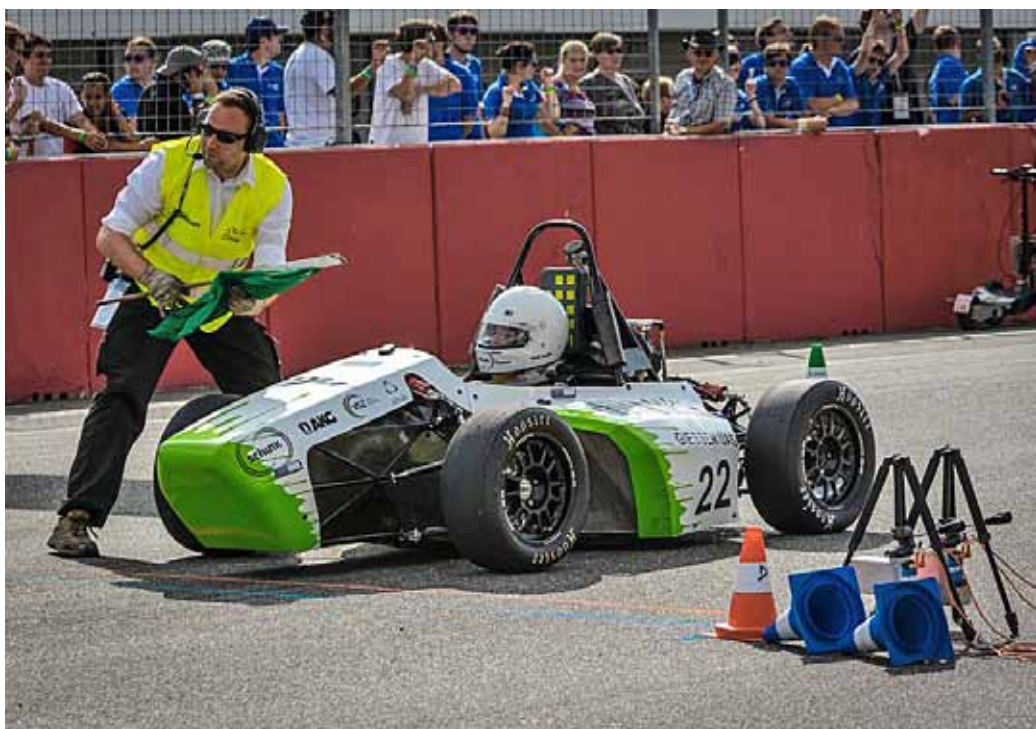
Auf dem Hockenheimring bewies der Wagen von THM Motorsport Racing, dass er im internationalen Wettbewerb gut mithalten kann.