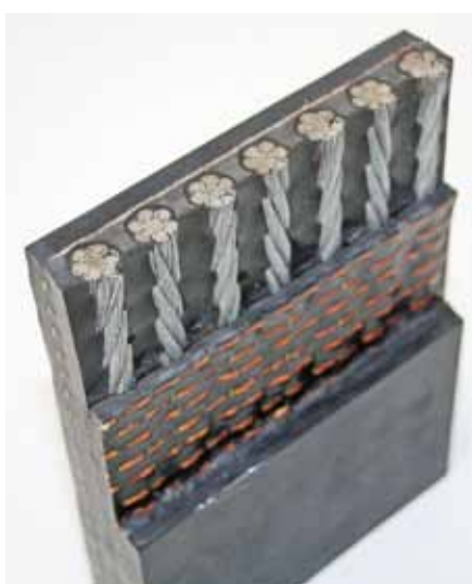
Der neue Fördergurt im Querschnitt.

zu 20 Prozent versprach, der aber bisher nur im Kohlebergbau eingesetzt wurde.