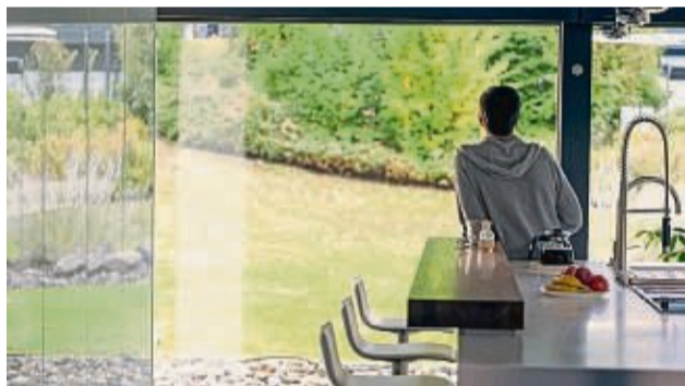
Beim Bauen mit Glas gehen Innen- und Außenbereiche fließend ineinander über.

Glas ist ein echtes Multitalent in der Architektur: Es lässt Räume großzügiger und freundlicher erscheinen, holt viel Tageslicht ins Gebäude und löst die Grenzen zwischen Innen- und Außenbereich optisch auf.