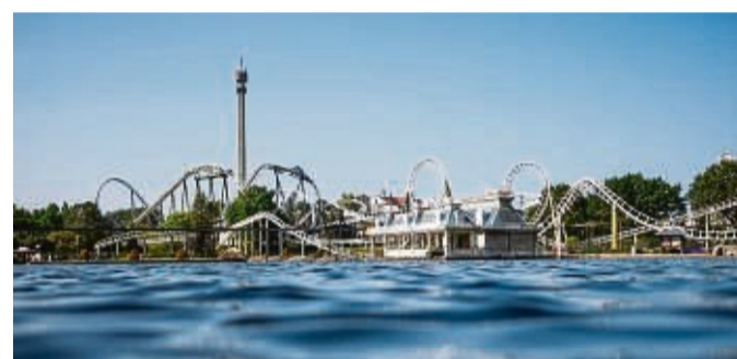
Der Heide-Park Soltau startet ab 2. April in die Sommersaison.

1. Heide-Park: Der vor allem für seine Achterbahnen bekannte Freizeitpark steht ab 2. April für Besucher offen und öffnet damit erstmals seit Pandemiebeginn pünktlich nach der Winterpause. Mit dem Panoramatumm