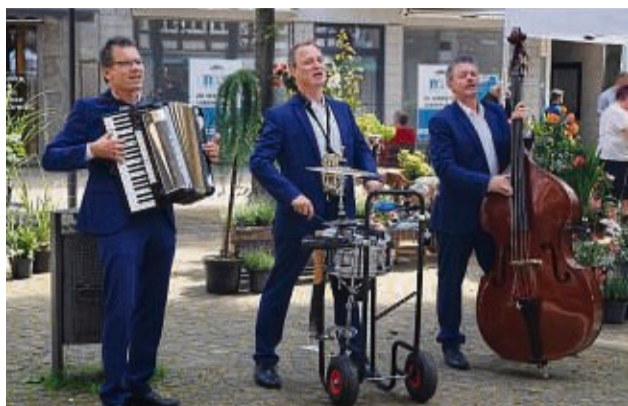
Die „Urban Swing Workers“ begeistern mit ihrer Musik an vielen Stellen in der Innenstadt.

Die „Urban Swing Workers“ werden durch die Innenstadt wandern und die Besucher mit ihrer Musik begeistern. Auch das „Caracho-Event-Theater“ will mit Harlekinen für Späße sorgen. Eine Mini-Kart-Bahn auf dem Linggplatz ist zudem geeignet für alle Kinder ab vier Jahren. In der Breitenstraße werden leckere Cocktails in der frühlings-