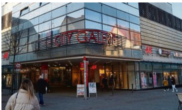
Auch in der City Galerie gibt es tolle Angebote und Live-Musik.

Gold- und Silbereinkauf Zahngold, Nachlässe Reparatur und Ankauf Schweizer Premiummarken