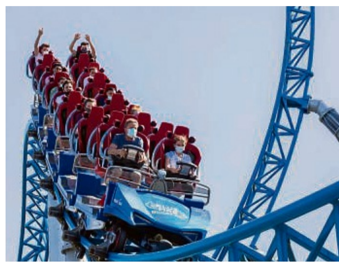
Achterbahnen wie die „Blue Fire“ warten: Ab Samstag (26. März) geht es im Europa-Park Rust wieder rund.

wird es eine bekannte Landmarke weniger geben. In der drehenden Gondel konnten Besucherinnen und Besucher den Park aus luftiger Höhe bestaunen. Nach 2019 war der 104 Meter hohe Turm schon außer Betrieb, vor kurzem wurde mit dem Abbau begonnen. Der Heide-Park Soltau liegt im Dreieck zwischen Hamburg, Hannover