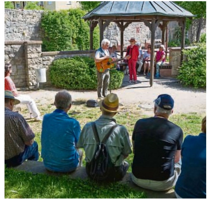
Das schöne Karlstadt lässt sich am besten bei einer Stadtführung entdecken.