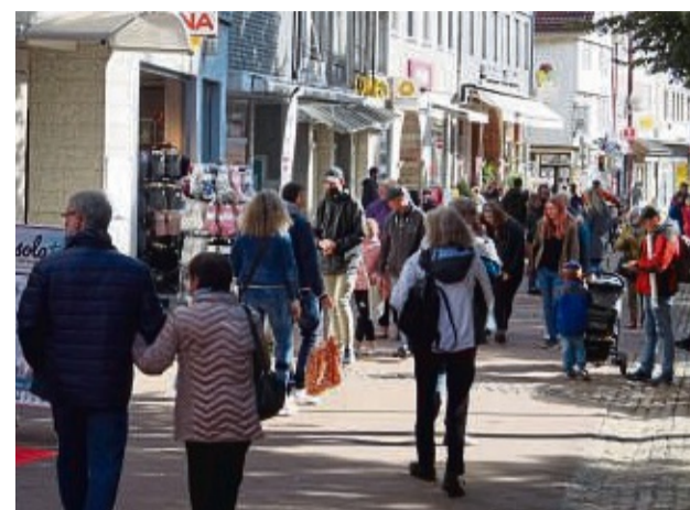
Entspannt lässt sich der Einkaufsbummel an einem Sonntag erledigen.

reich bestückten Läden im Einkaufszentrum mit den kurzen Wegen sowie das Angebot an kulinarischen Genüssen im Food Court sorgen für eine entspannte Einkaufstour. Genießen Sie den Shoppingspaß im Einkaufszentrum im Herzen von Bad Hersfeld!