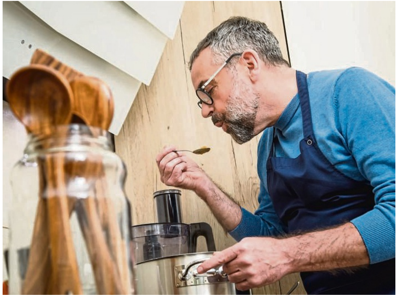
Wer sich nach der Paleo-Diät ernährt, kocht viel frisch. Fertiggerichte sind tabu.