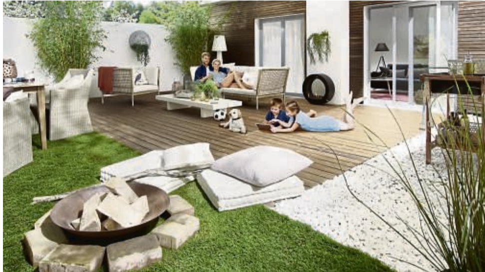
Mit möglichst wenigen Stufen wird das Leben in jedem Alter erleichtert.