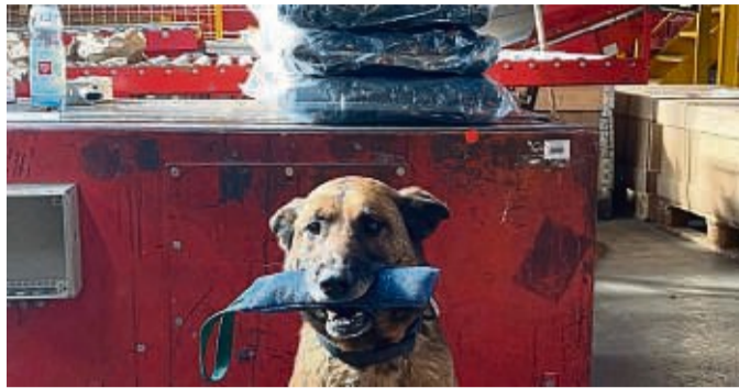
Feines Näschen: Zollhündin „Kobra“ erschnüffelte in einem Paket zwölf Kilo Marihuana (im Hintergrund eingeschweißt).

Neuenstein – Bei einer groß angelegten Kontrolle in einem Paketzentrum in Neuenstein hat der Zoll jetzt über insgesamt 64 Kilogramm Rauschgift – meist Marihuana – entdeckt und sichergestellt.