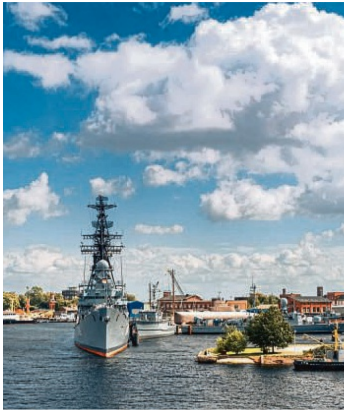
Eine Hafenerfahrt zeigt den Marinehafen und den JadeWeserPort aus.