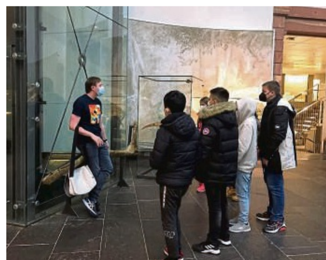
Der Guide erklärt, wie man im Museum echte Knochen von unechten Knochen unterscheiden kann.