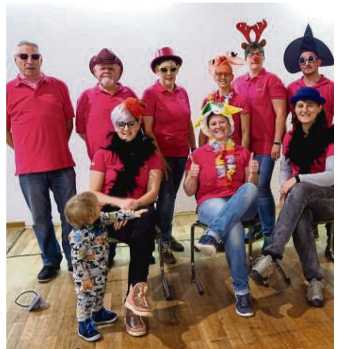
Zurück auf den Brettern, die die Welt bedeuten: Die Mansbacher Theatergruppe „Bühnenfieber“ probt nach zwei Jahren Corona-Zwangspause wieder für ihr Stück „Kreuzfahrt im Schweinestall“.

Jahren verkauften Eintrittskarten für das Theaterstück behalten weiterhin ihre Gültigkeit. Die Aufführung am Samstagabend ist deshalb bereits ausverkauft, für Sonntag gibt es nur noch wenige Restkarten. Wer wer die neuen Aufführungstermine nicht besuchen kann, hat die Möglichkeit, seine Karten am Freitag, 22. April, von 19 bis 20 Uhr, oder am Sonntag, 24. April, von 14 von 15 Uhr, im Bürgerhaus Mansbach am Haupteingang zurückzugeben und erhält den Kaufpreis erstattet. Wegen der großen Nachfrage bitten die Theatermacher darum, von dieser Möglichkeit Gebrauch zu machen und die Tickets nicht einfach verfallen zu lassen. jce