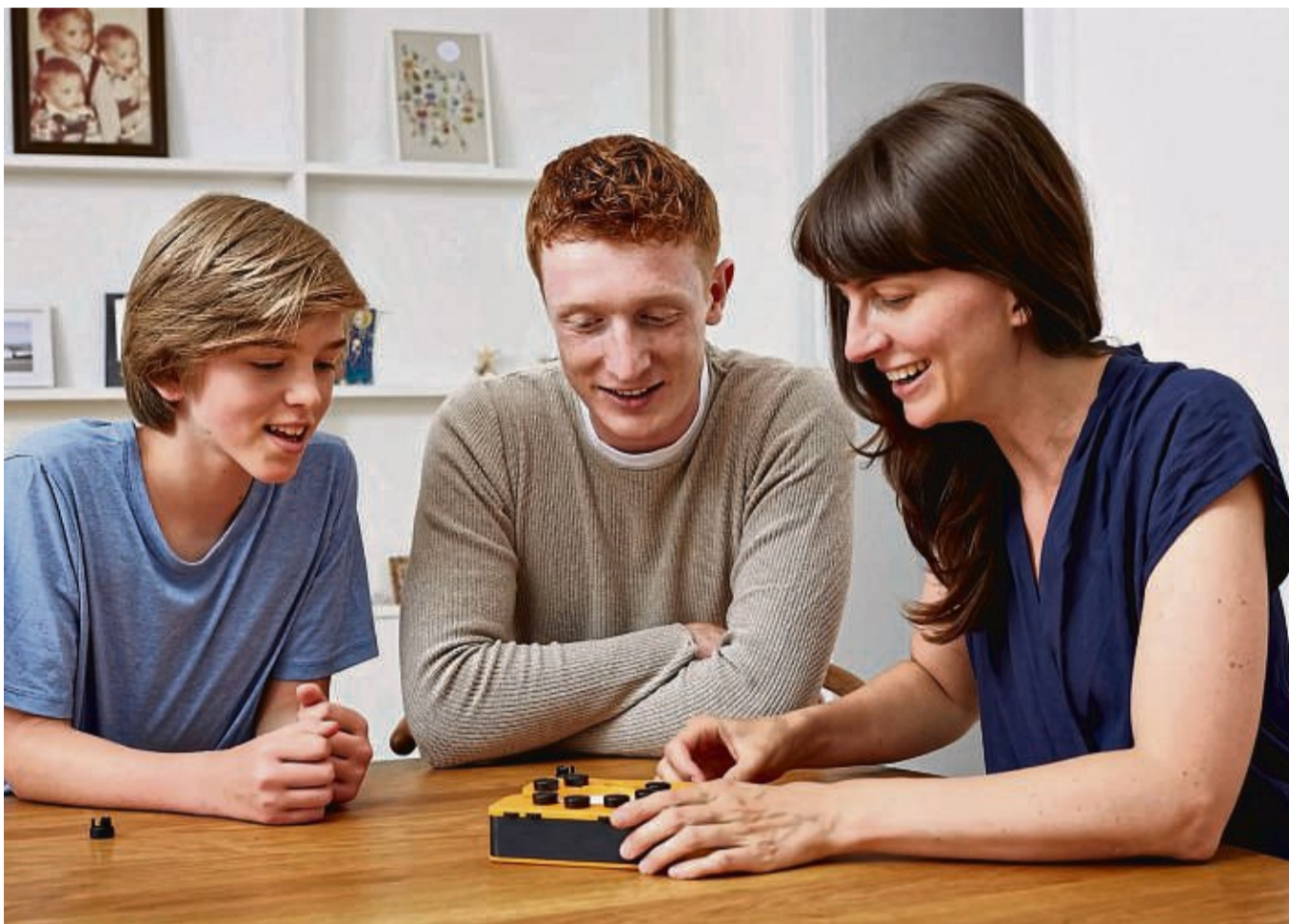
Ob in Bahn, am Esstisch oder auf dem Autorücksitz: Das Zocker-Spiel „Smart 10“ kann ohne Aufwand quasi überall gespielt werden.

Im Team muss sich auch niemand blamieren – ein Punkt, den etliche Quiz-Brettspiele versuchen zu berücksichtigen. „Jeder hat wohl schon ein Quizspiel gespielt, wo einfach eine Frage gestellt wird, die man beantworten muss. Weiß man sie nicht, ist das für manche Menschen ein unangenehmes Erlebnis. Genau daran setzen aber moderne Quizspiele an“, sagt Spieleautor Arno Steinwen-