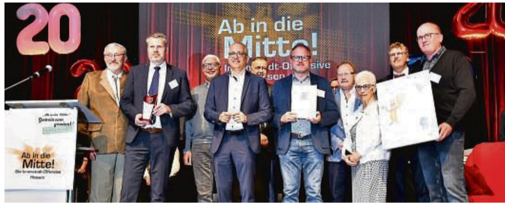
Bebra hat erneut überzeugt: Die Stadt gehört häufiger zu den Gewinnern bei „Ab in die Mitte“. Unser Foto zeigt Bebraer Stadträte, SEB-Vertreter und Bürgermeister Stefan Knoche beim Siegerfoto mit Wirtschaftsminister Tarek Al-Wazir.

Für Bebra gibt es 20 000 Euro, womit ein Neustart der Gemeinschaft aus der Corona-Hochzeit gelingen soll.