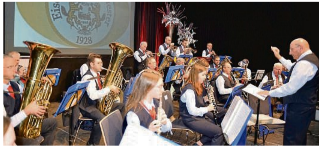
Das Eisenbahn-Blasorchester Bebra gestaltet ein Muttertagskonzert im Bebraer Lokschnuppen.

Ein Hygienekonzept, zu dem Bistrotische mit Bestuhlung gehören, soll gewährleisten, dass jeder Besucher genug Abstand zum Sitznachbarn hat. Für Getränke und Snacks ist gesorgt. Der Eintritt kostet zehn Euro. Eintrittskarten gibt es im Vorverkauf beim Lokschnuppen Be-