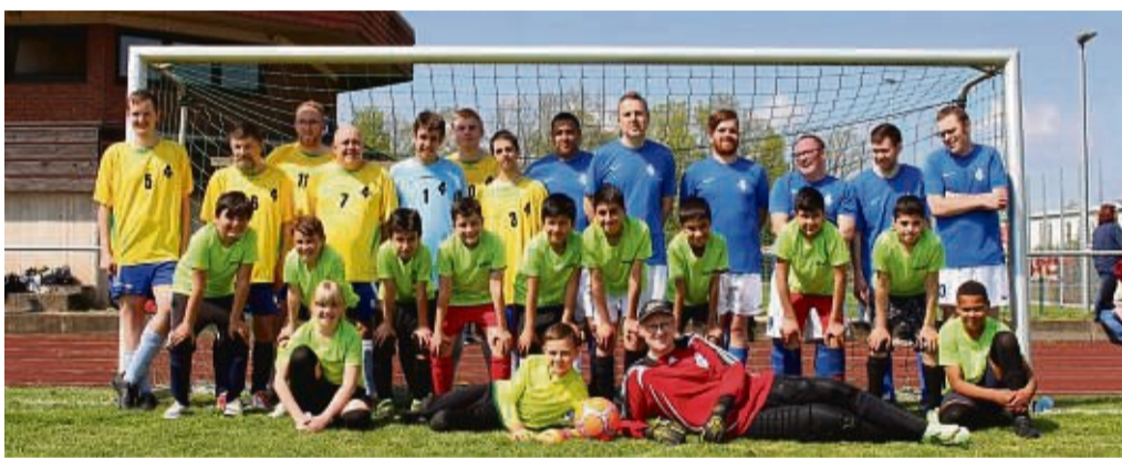
Beim Fußballturnier traten für Bebra unter anderem die Mannschaften Soziale Förderstätten 1 und 2 sowie eine Mannschaft von Viertklässlern der Brüder-Grimm-Gesamtschule an.