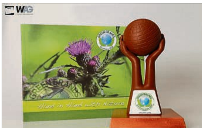
Hand in Hand mit der Natur: W.AG Funktion + Design setzt bereits seit 2019 auf nachhaltige Kofferlösungen.

Das Ergebnis jahrelanger Forschung und Entwicklung im hauseigenen Entwicklungsteam und in Zusammenarbeit mit Rohstofflieferanten, ist eine innovative Produktlinie – ORGANICLINE – aus ressourcenschonenden Rohstoffen. Der mehrfach prämierte