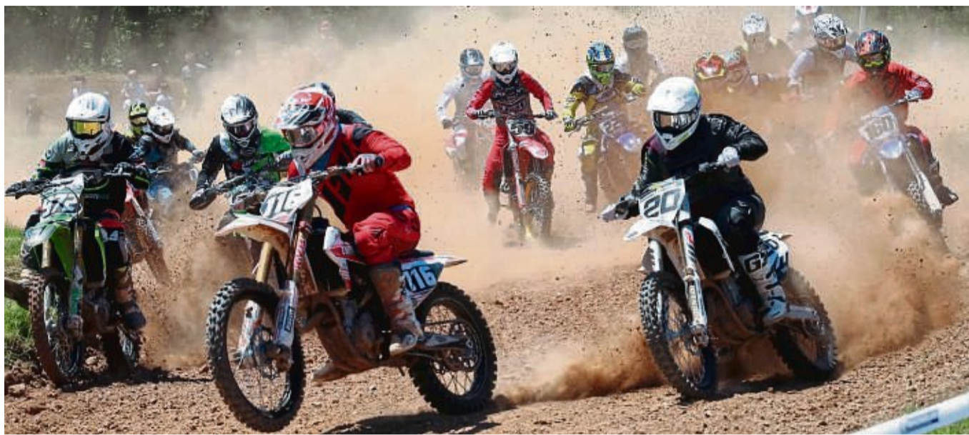
Spannung, Staub und heiße Öfen: Schon kurz nach dem Start beginnen beim Meckbacher Motocross die heißen Positionskämpfe.