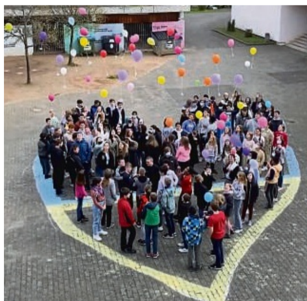
Bunte Luftballons für den Frieden: Schüler der Gesamtschule Geistal haben den zweiten Platz beim Bertha von Suttner-Friedenspreis belegt.

Mehrere Wochen und zwei Projektstage später, war eine 14-minütige Nachrichtensendung entstanden, die von einer nächtlichen Zusammenkunft dreier Hexer berichtet, als Auslöser diverser Vorkommnisse. Die Szene ist angelehnt an William Shakespeares berühmte Hexenszene aus Macbeth. Doch anders als im Original wird hier die Welt mit einem Zauber belegt, der das Gute im Menschen hervorbringen möchte und ein gerechtes, faires und friedvolles Miteinander bewirken möchte. Dabei betonen die beteiligten Jugendli-