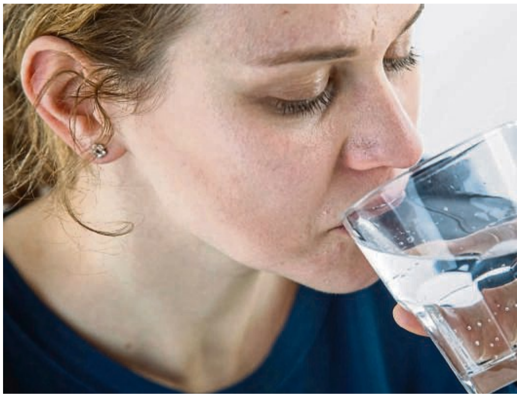
Wer beim Essen trinkt, greift am besten zu Wasser. Denn das verfälscht den Geschmack der Mahlzeit nicht – anders als Wein, Limo oder Cola.