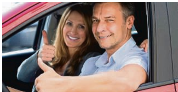
Mit guter Atemluft im Auto macht jede Fahrt mehr Spaß.