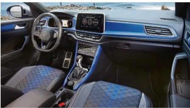
Auch das Interieur lässt sich sehen und vor allem bei allen Fahrten genießen.