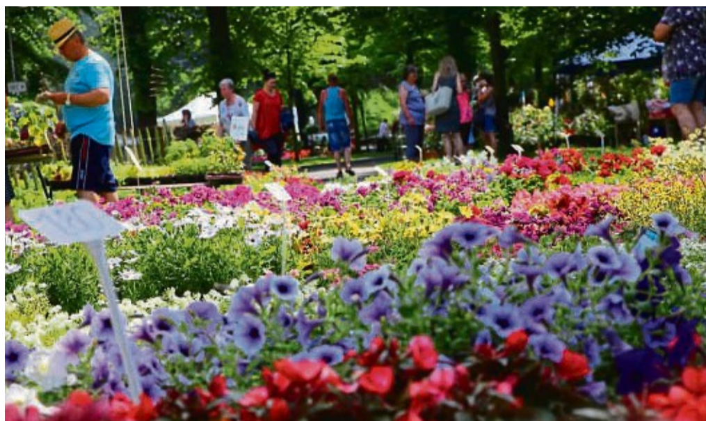
Rotenburger Blumenmeer: Der gepflegte Schlosspark bietet die ideale Kulisse für alles, was blüht.

Fast 40 regionale Produzenten, Handwerker und Gärtner präsentieren von 11 bis 17 Uhr an ihren Ständen im Steinweg, Brückengasse, am Marktplatz und im Schlosspark. Burger, Obst und Gemüse, Honigbier, Gegrilltes, Bonbons, Wein, Liköre und Spezialitäten ukrainischer Frauen sowie noch vieles mehr warten am Naschmarkt laut Ankündigung auf Leckermäulchen. Am Blumenmeer gibt es viele neue und altbekannte Aussteller mit Blu-