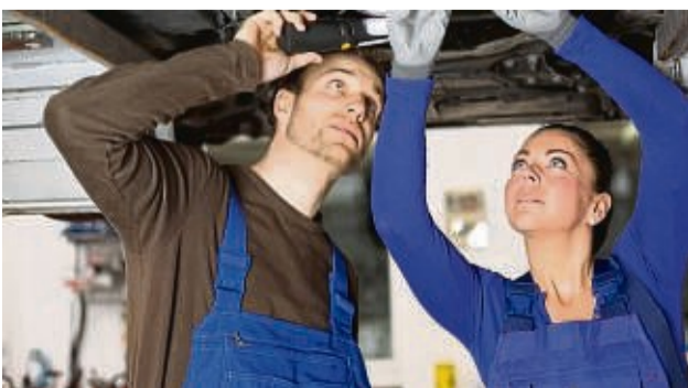
Die Experten wissen schnell, was ein Gebrauchtwagen wirklich wert ist.