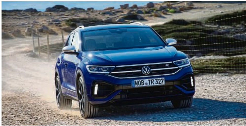
Der Volkswagen T-Roc R überzeugt als Neuwagen, wie auch als Gebrauchter in allen Bereichen. Eine solide Wahl.

Jetzt haben die Wolfsburger den T-Roc R geliftet. Die Änderungen am Exterieur halten sich in Grenzen: Neue Leuchtengraphiken vorn und hinten, ein beleuchteter Zierbalken im Kühlergrill, schwarzlackierte Flächen in Front- und Heckschürze sowie ein auf Kosten der Baureihenbezeichnung in die Mitte der