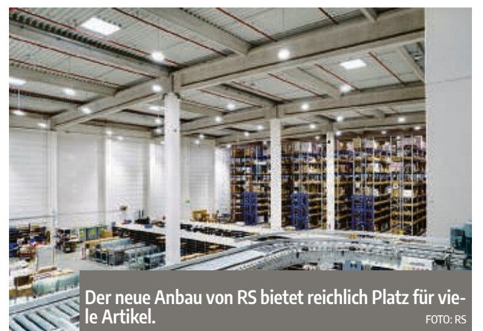
Der neue Anbau von RS bietet reichlich Platz für viele Artikel.