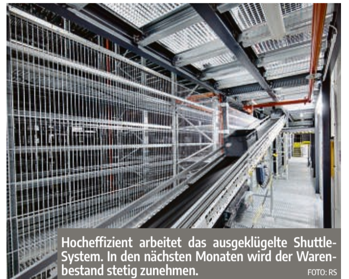
Hocheffizient arbeitet das ausgeklügelte Shuttle-System. In den nächsten Monaten wird der Warenbestand stetig zunehmen.

Bad Hersfeld ist nur eines von zwölf globalen Distributionszentren im weltweiten Supply Chain Netzwerk von RS. Der Ausbau von Bad Hersfeld ist eine der zwölf Schlüsselinitiativen, die die Strategie Destination 2025 von RS vorantreiben sollen. Als Ziel will sich RS mit der Erweiterung weiter global zur ersten Wahl im Bereich der Supply Chain-Lösungen avancieren. Lieferanten, Kunden und alle Mitarbeiter sollen von diesen Spitzenleistungen profitieren. Durch den Anbau sorgt RS dafür, dass die Produkte näher an die Kunden rücken, schneller sowie zuverlässiger ankommen. Damit wird RS den Anforderungen zur Versorgung europäischer Märkte noch besser gerecht und erlaubt eine noch stärkere Fokussierung auf die Kunden und Serviceleistungen. Die erweiterte Produktpalette wird beispielsweise ein verbessertes Elektronikangebot beinhalten. dan