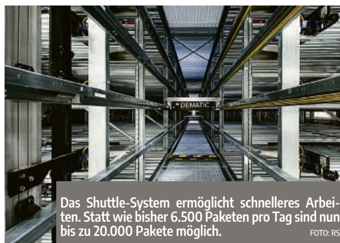
Das Shuttle-System ermöglicht schnelleres Arbeiten. Statt wie bisher 6.500 Paketen pro Tag sind nun bis zu 20.000 Pakete möglich.