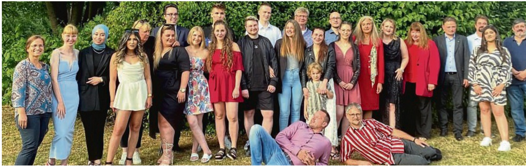
Die Absolventinnen und Absolventen der Schule für Erwachsene Osthessen in Bad Hersfeld.