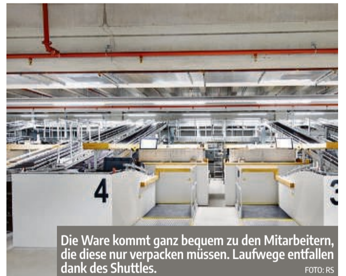
Die Ware kommt ganz bequem zu den Mitarbeitern, die diese nur verpacken müssen. Laufwege entfallen dank des Shuttles.

Am Schloss Eichhof 2 36251 Bad Hersfeld Telefon 0 66 21 - 17 00 de.rs-online.com/