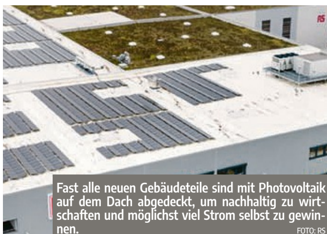
Fast alle neuen Gebäudeteile sind mit Photovoltaik auf dem Dach abgedeckt, um nachhaltig zu wirtschaften und möglichst viel Strom selbst zu gewinnen.