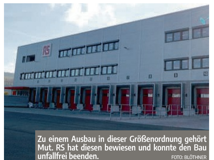
Zu einem Ausbau in dieser Größenordnung gehört Mut. RS hat diesen bewiesen und konnte den Bau unfallfrei beenden.