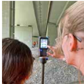
S12 – 25 Campus