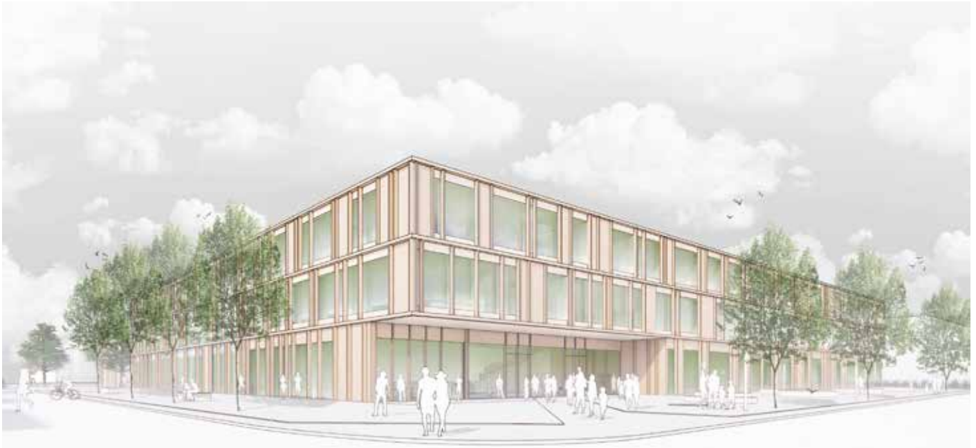
Den zweiten Platz im Wettbewerb belegte der Vorschlag von sdks architekten dummert sonek partner aus Darmstadt.

ruhigen Ästhetik, er ist feinstrukturiert und unaufgeregt.“