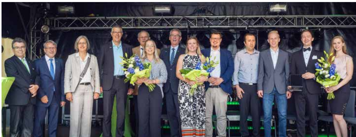
Auf großer Bühne: Die Ludwig-Schunk-Preisträgerinnen und -Preisträger mit Verantwortlichen des Unternehmens und der THM