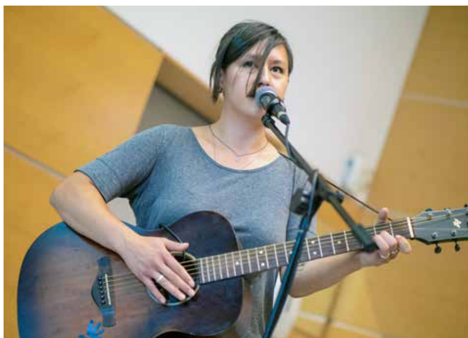
„Kim“ unterhielt die Festtagsrunde mit einem Song aus den Sechzigern und eigenem Liedgut von heute.

zu den Fortschritten der KI. Dabei bezog er eine skeptische Grundposition, die den Vorteil des Menschen in diesem Wettbewerb darin erkannte, bewusster Teil der Welt zu sein, während Maschinen alle Informationen über dieses „Fass ohne Boden“ eingegeben werden müssten. Die hohe Überlegenheit der KI bei bestimmten Anwendungen und in Teilgebieten erkannte er an, die „allgemeine Intelligenz des Menschen“ sah er jedoch unerreicht. Er entließ das Publikum mit der Schlussaussage: „Wird es die Singularität geben, und wann wird sie eintreten? Ich weiß es nicht.“