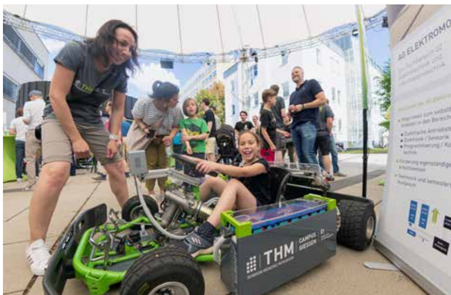
Sein Elektro-Kart stellte der Fachbereich El vor – besonders die Jüngeren wären gerne mal gefahren.

bereich IEM verantwortete die elektrische Umrüstung der ursprünglichen Diesellvariante, der Fachbereich M untersuchte alle Teile auf mögliche Gewichtsreduzierung. „Wir haben es letztlich sogar geschafft,