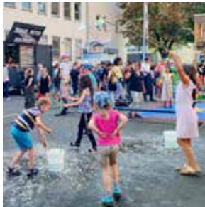
S04 – 11 Dossier