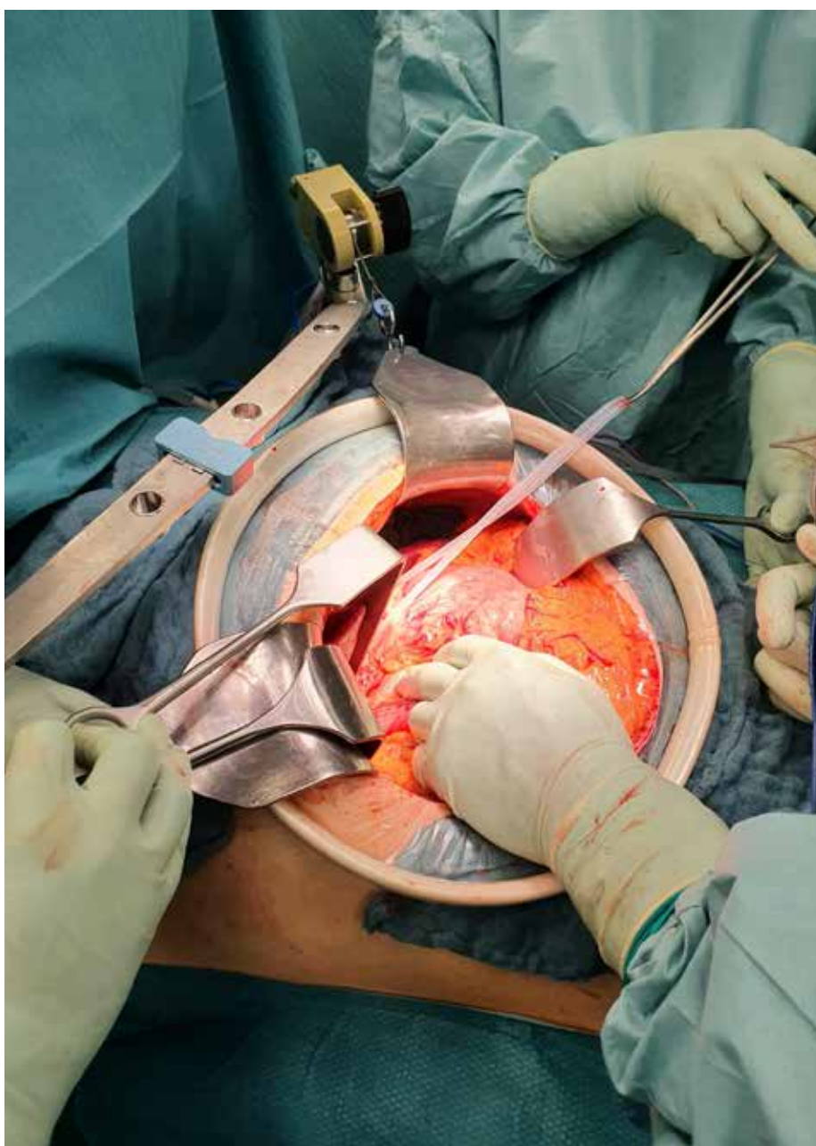
Aufgespanntes OP-Feld für eine tiefe Bauchoperation – nur für die Ausleuchtung des Wundfeldes an der Oberfläche reichen die OP-Leuchten aus.

Beim von Thomas Steffens begleiteten Projekt geht es darum, chirurgischen Rauch vollständig abzusaugen, der beispielsweise durch Anwendung chirurgischer Lasern oder der Hochfrequenzchirurgie aus dem Wundgebiet freigesetzt