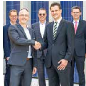
S26 – 27 Protokoll