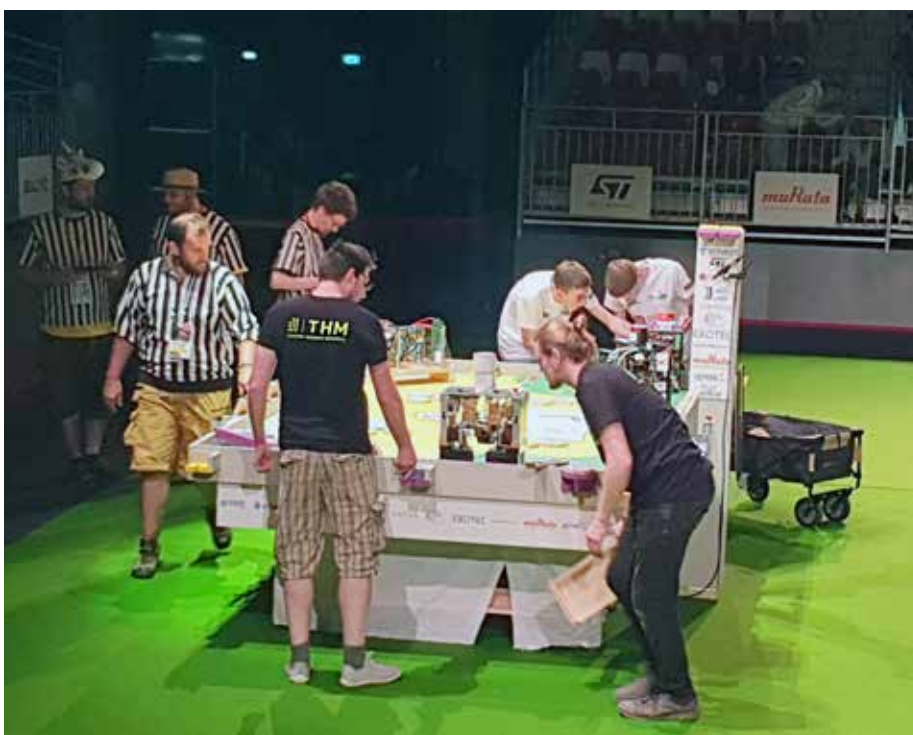
Zwei MAMUT-Mitglieder treten gegen ein anderes Team an – immer überwacht von den Schiedsrichtern.