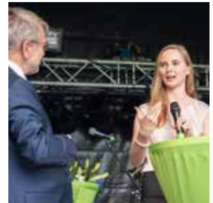
S28 – 31 Namen