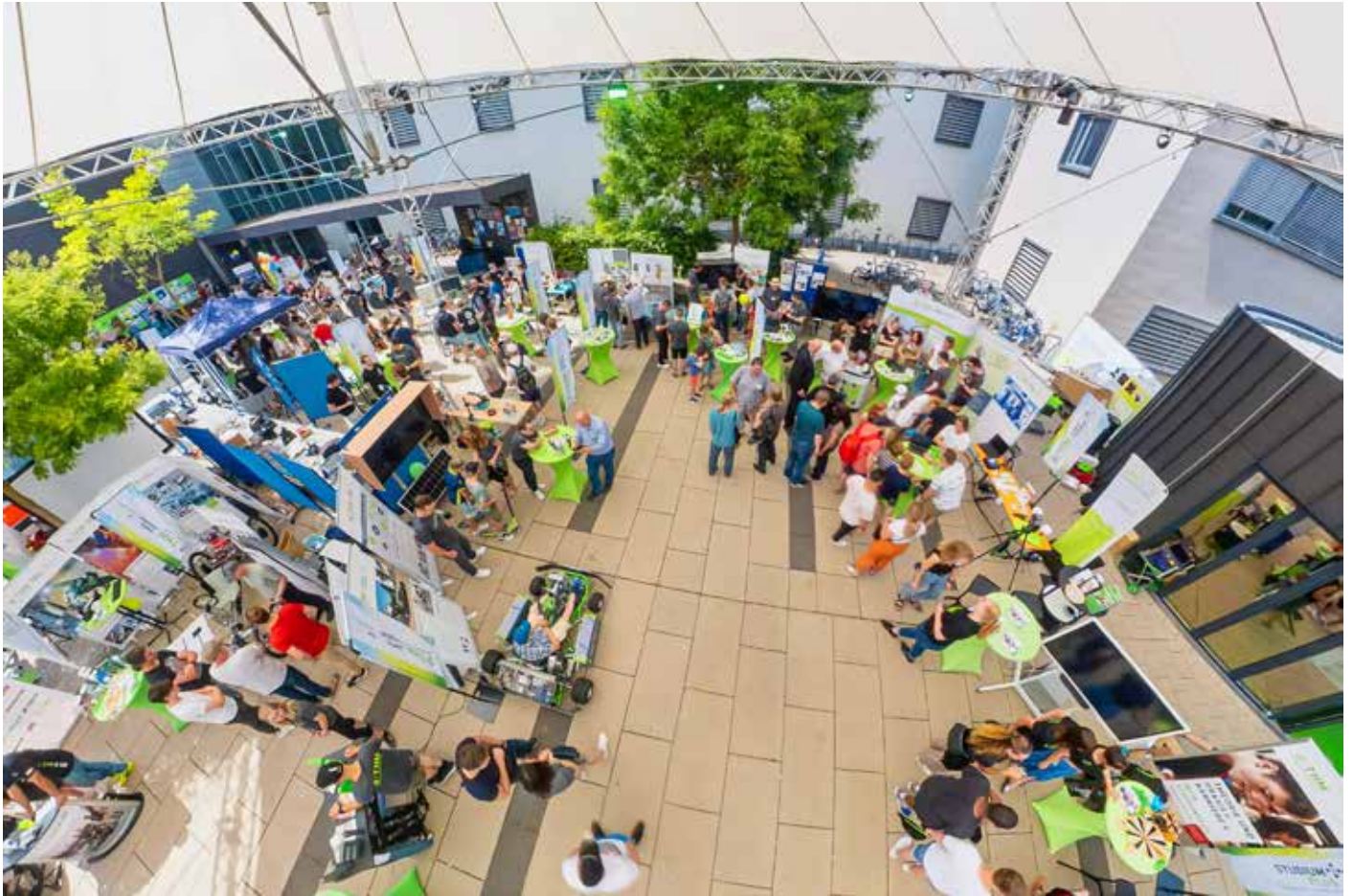
Im Fachbereichsforum vor dem Info-Center auf der Wiesenstraße zeigten die zwölf Fachbereiche lebensnahe Ausschnitte aus ihrem Forschungsalltag.