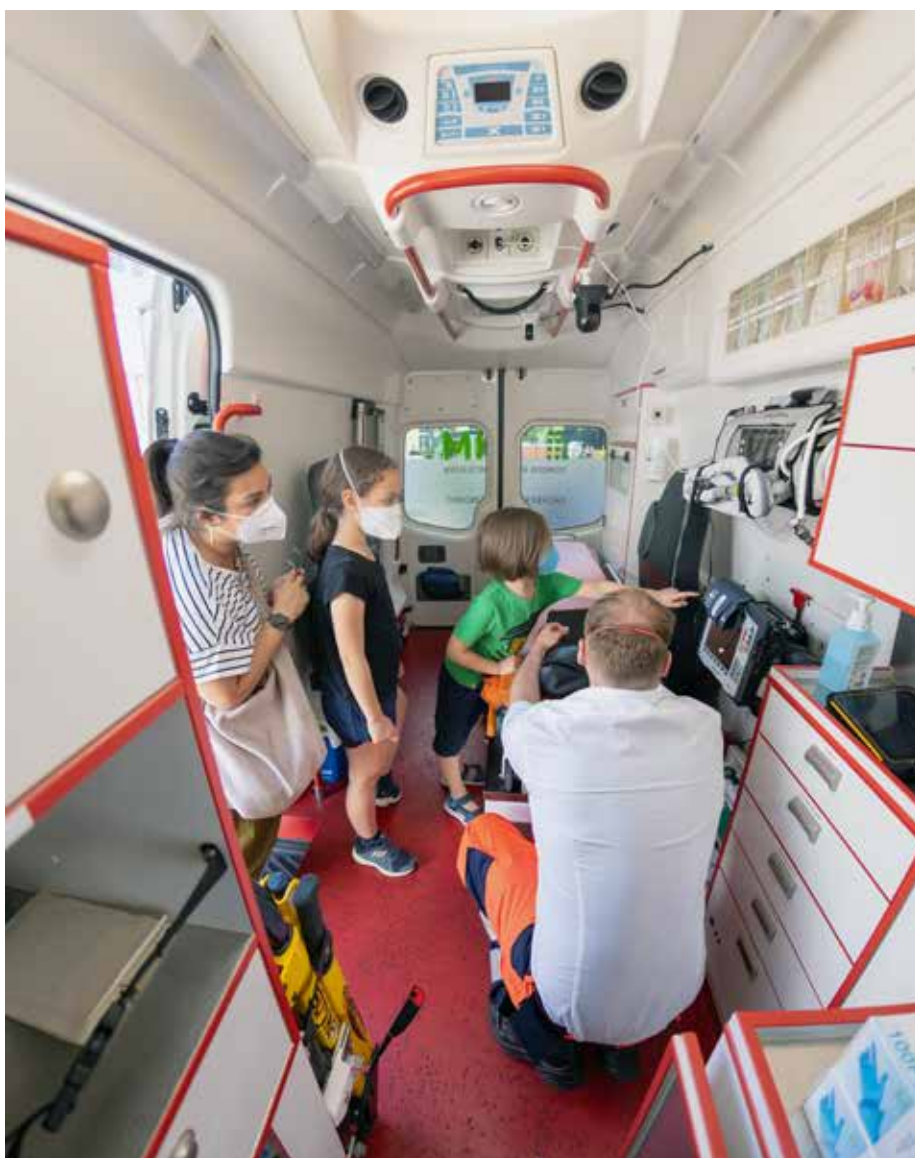
Einblick in den Rettungswagen, den der Fachbereich Gesundheit der THM unter anderem als Technologieträger in der Forschung nutzt.