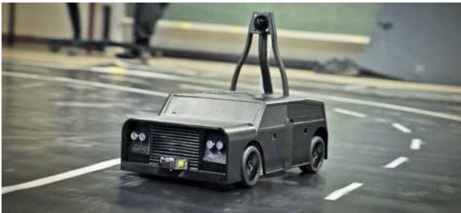
Das cITcar sucht sich seinen Weg selbstständig.

Beim Carolo-Cup gilt es für kleine Fahrzeuge in zwei Klassen, sich selbstständig