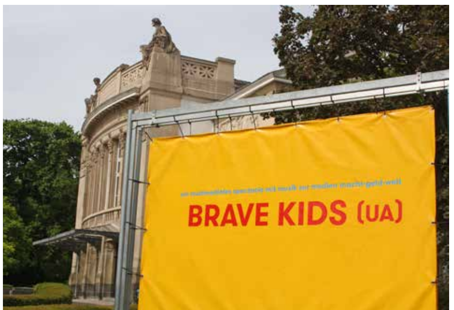
Das Stück stand in Frühjahr und Sommer oft auf dem Spielplan des Stadttheaters Gießen.

„Wir danken der THM Gießen, Fachbereich Wirtschaft, für Pepper und seine Betreuung“, teilte das Theater im Netz allen Interessierten mit, die sich über „Brave Kids“