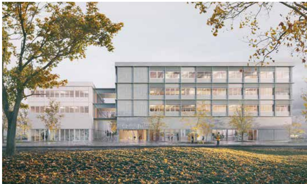
Mit dem dritten Preis wurde die Ausarbeitung von Schulz und Schulz Architekten aus Leipzig ausgezeichnet.

„Im Januar dieses Jahres konnte auf dem Campus Gießen der THM bereits die Einweihung des mit circa 20 Millionen Euro aus dem Hochschulinvestitionsprogramm HEUREKA finanzierten Neubaus C11 gefeiert werden. Nun investiert das Land Hessen erneut, diesmal am Campus Friedberg, wo wir weitere rund 20 Millionen Euro für ein innovatives und für den Hochschulbau in Hessen beispielgebendes Projekt in Holzhybridbauweise zur Verfügung stellen“, betonte Hessens Fi-