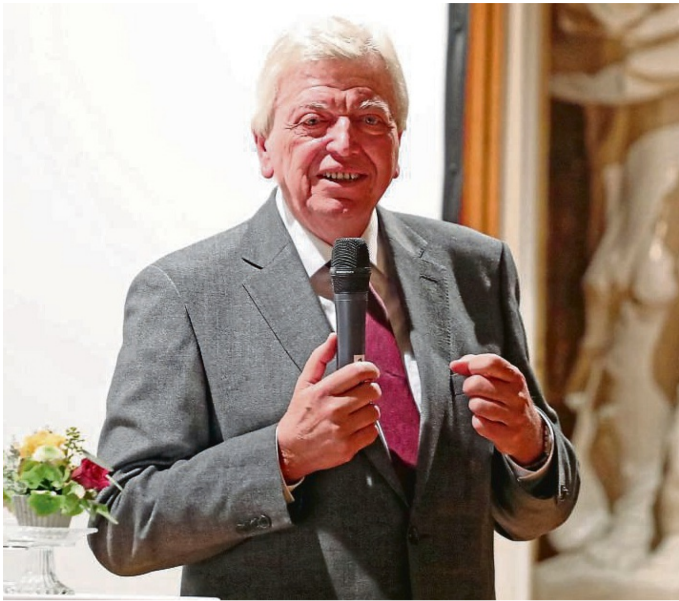
Sparte nicht mit Lob: Volker Bouffier.