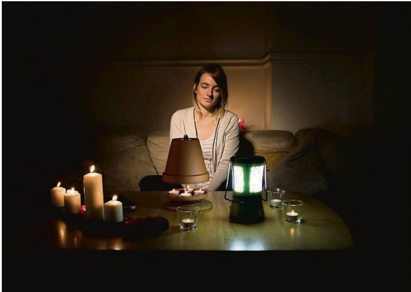
Will man während eines Stromausfalls nicht im Dunkeln sitzen, sollte man daheim immer einen Grundvorrat an Kerzen und Teelichtern haben.

So wäre laut Gesetz im Krisenfall die Einrichtung eines Verwaltungsstabes notwendig. „Hieran muss auch in Bad Hersfeld noch gearbeitet werden, gegebenenfalls auch flankiert mit einer personellen Verstärkung in der Stadtverwaltung“, heißt es dazu in einer Stellungnahme aus dem Rathaus. kai