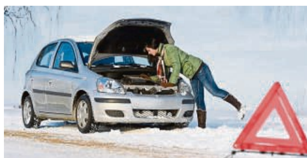
Falls es zur Panne kommen sollte, lieber im Vorfeld schon vorbereiten.