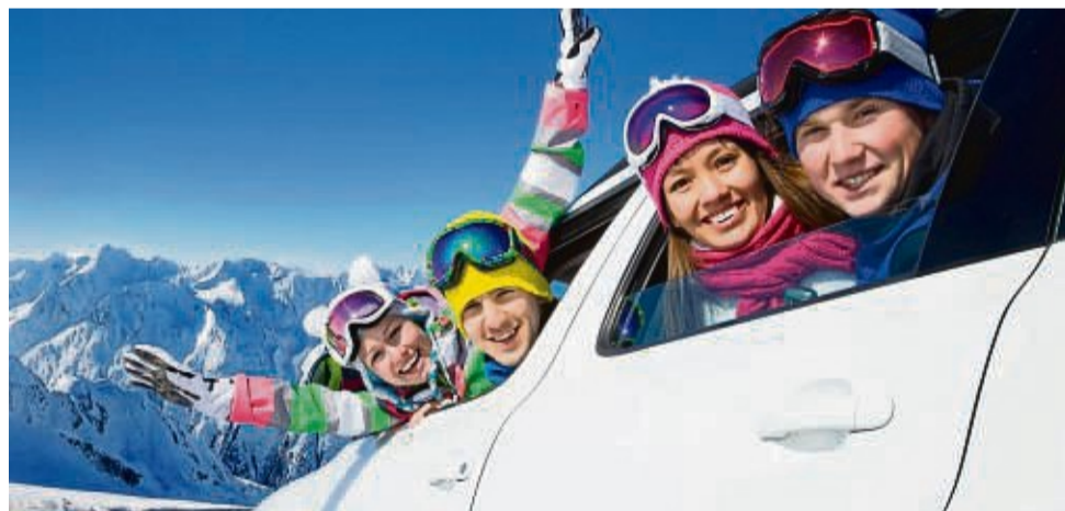
Mit einer guten Vorbereitung gelingt auch jeder geplante Winterurlaub. Dafür sollte in erster Linie im Fahrzeug alles Nötige vorhanden sein.

Beim Kratzen sollte grundsätzlich darauf geachtet werden nicht zu viel Druck aufzuwenden. Heftiges Hin- und Herkratzen kann sogar schädlich sein, denn Schmutzpartikel können wie Schmirgelpapier wirken und die Scheibe zerkratzen. Wichtig ist auch die