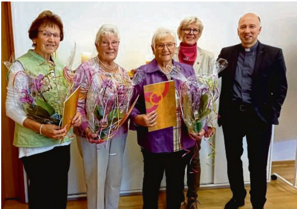
Die Katholische Frauengemeinschaft Rotenburg feierte ihren 70. Geburtstag.