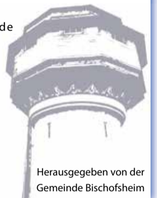
Herausgegeben von der Gemeinde Bischofsheim

Die Anmeldung ist noch am Freitag, 25.11., zwischen 15.30 und 18.30 Uhr, im Jugendhaus, Schulstraße 55, möglich. Die Jugendpflege ist unter der Telefonnummer 06144-8750 oder unter der E-Mailadresse jugendpflege@bischofsheim.de erreichbar. Die Teilnahmegebühr beträgt 5 Euro.