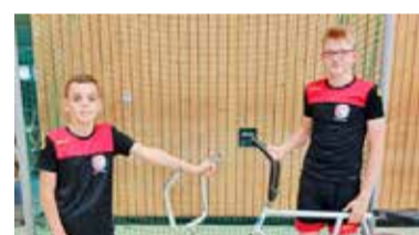
alle 11 Mannschaften der Jugendliga auf zwei Spielflächen in Ginsheim.

Weiter geht es für diese beiden bereits am 27.11. Dann starten sie in der heimischen Sporthalle der Albert-Schweitzer-Schule, Ginsheim ab 10 Uhr. An diesem Sonntag starten