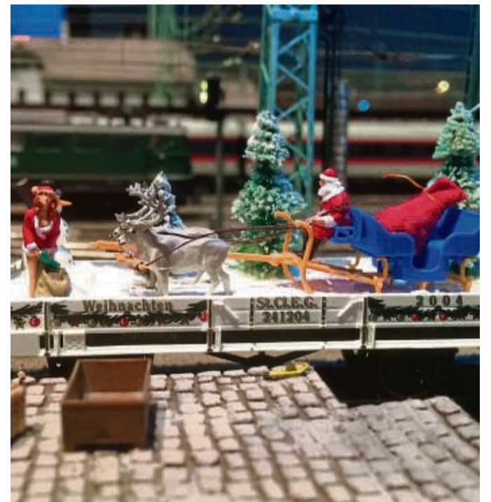
Bahnhofsausstellung in Bebra: Modellanlagen werden zu riesigen Wimmelbildern.