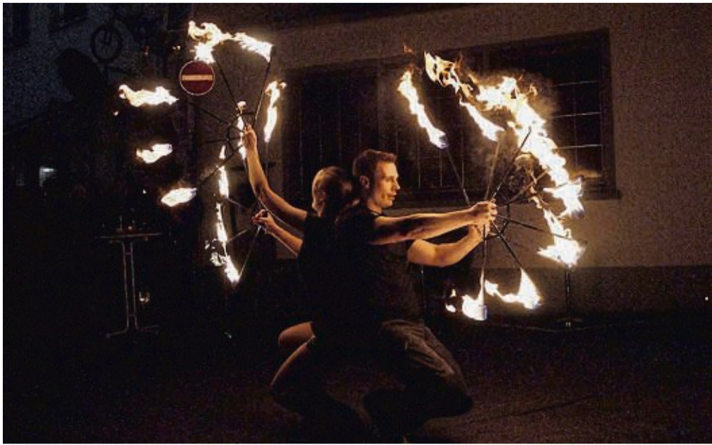
Heizer's Weihnacht mit einer Feuershow.