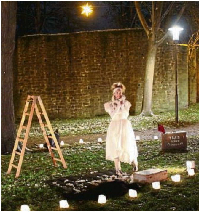
Allein im Lichterlabyrinth: Wer kennt den Weg?