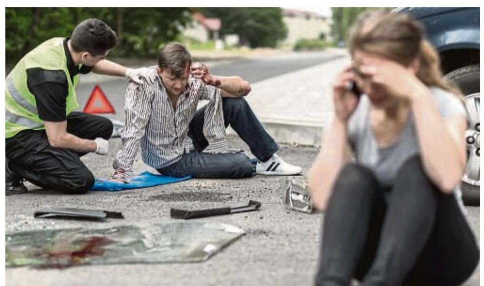
Jeder Mensch in Deutschland ist dazu verpflichtet, im Rahmen seiner Möglichkeiten Maßnahmen zur Rettung und Versorgung von Unfallopfern zu ergreifen.

„Bei den Maßnahmen darf sich die helfende Person natürlich nicht selbst in Lebensgefahr bringen“, so die Experten. Wer in Notsituationen Hilfe unterlasse, obwohl dies erforderlich