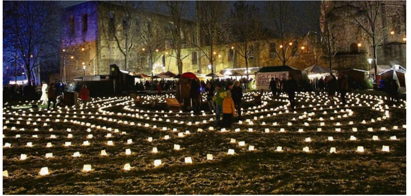
Lichterglanz an der Stiftsruine: Das Theater Anu aus Berlin hat am Wochenende am Rande des Weihnachtsmarkts zu einer Reise in eine mystische Welt eingeladen. Weitere Fotos im Internet unter www.hersfelder-zeitung.de