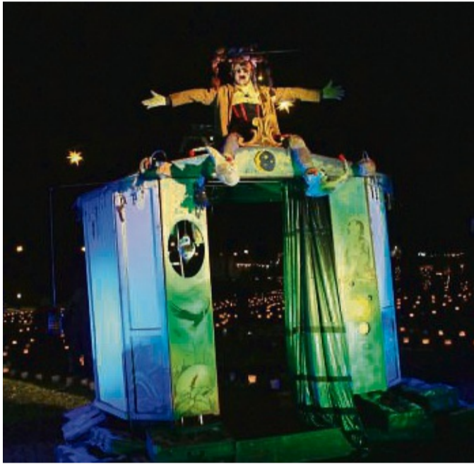
Magische Gestalten zwischen Traum und Realität.