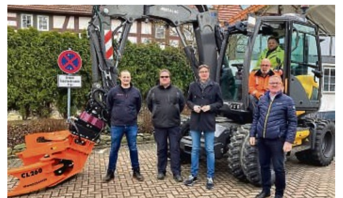
Der neue Mobilbagger bei der Übergabe an die Mitarbeiter des Bauhofes.

Bürgermeister Timo Lübeck dankte den gemeindlichen Gremien, die der Beschaffung zugestimmt hatten. red/jce