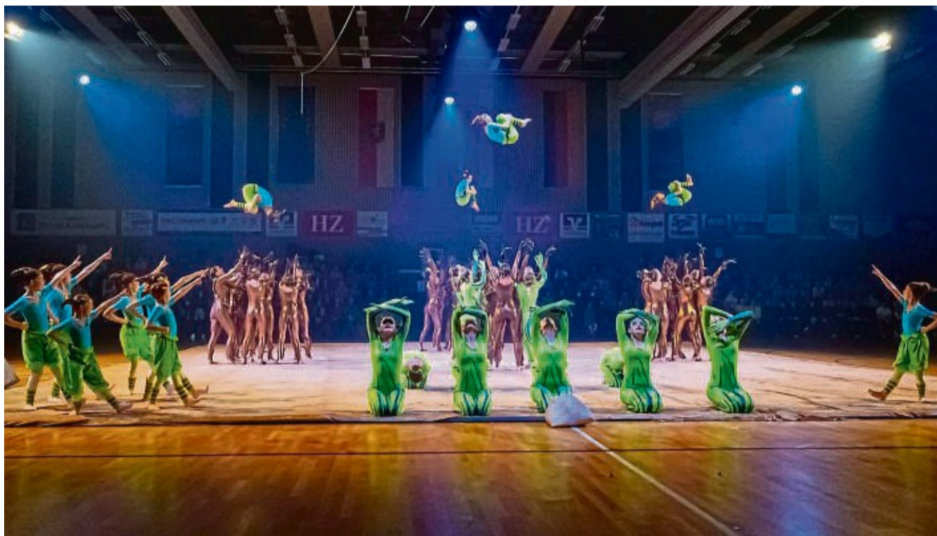
Eine tolle Performance lieferten während der Veranstaltung „Sport & Show“ auf der Rotenburger Bühne auch die Green Spirits TSG Hatten Sandkrug ab. Das Publikum in der Göbel Hotels Arena kam drei Stunden lang auf ihre Kosten.

Einen wunderschön poetischen Beitrag lieferten die Green Spirits der TSG Hatten Sandkrug bei Oldenburg, die