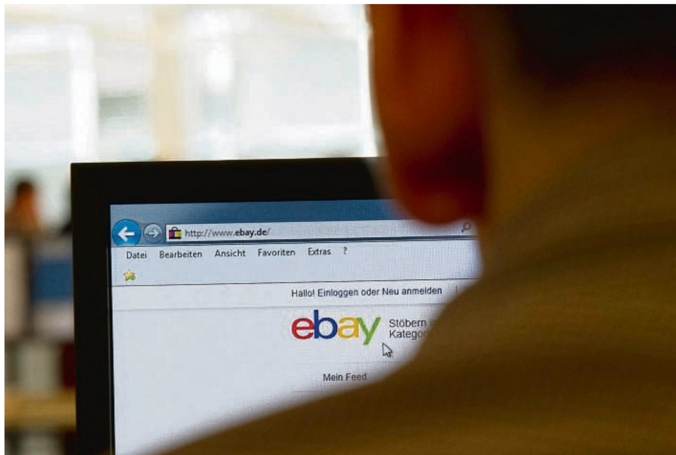
Täter nutzen Internetportale wie Ebay.