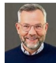
Michael Roth Bundestagsabgeordneter

Mit dem Otto-Wels-Preis für Demokratie zeichnet die SPD-Bundestagsfraktion junge Menschen mit kreativen Ideen aus. Die Teilnehmerinnen und Teilnehmer können dabei aus zwei verschiedenen Aufgabenstellungen und aus unterschiedlichen Darstellungsformen, von einer Rede über Fotografien bis hin zu Videos oder Essays, auswählen. Der Preis soll einen Beitrag dazu leisten, dass sich junge Menschen mit Erinnerungskultur und einem fried-