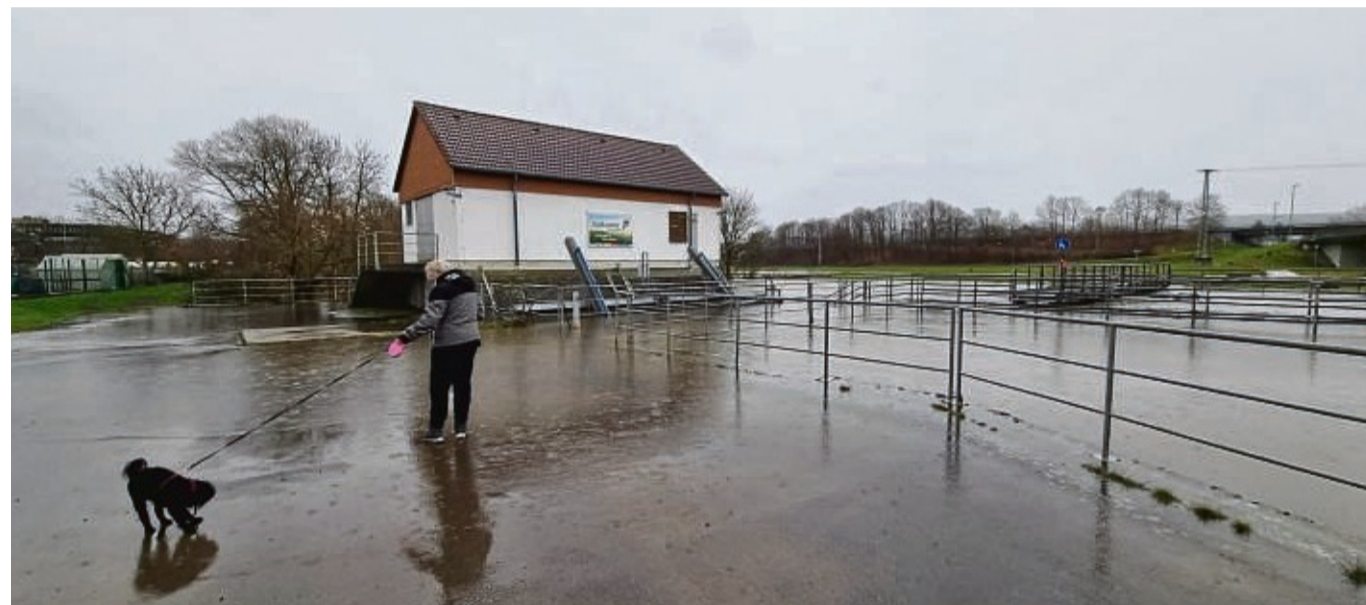
Trockener Sommer, Hochwasser im Winter: Das Wetter wird zunehmend unberechenbar. Unser Foto entstand Montagmittag am Fuldaweher im Bad Hersfeld, wo man sich beim Gassi-Gehen nasse Pfoten holte.