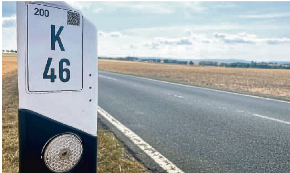
Hessen Mobil tauscht Stationszeichen an Fahrbahnen aus: QR-Code auf Leitpfosten kommt.

Hersfeld-Rotenburg – Aufmerksamen Verkehrsteilnehmenden im Landkreis Hersfeld-Rotenburg ist es womöglich längst aufgefallen: Die dreieckigen Plastikkörper am Straßenrand, auf denen Informationen wie die Straßenbezeichnung, die Station und der Abschnitt zu lesen sind, verschwinden zusehends. Seit 1968 sind im gesamten Bundesgebiet die Standort-Informationen an sämtlichen Bundes-, Landes- und Kreisstraßen derart dargestellt. Nun werden sie sukzessive ausgetauscht. Die Angaben auf den sogenannten Stationszeichen gehen aber nicht verloren. Im Gegenteil. In Zukunft sollen diese Informationen flächendeckend alle 200 Meter klein und kompakt auf Leitpfosten angebracht werden. Diese neue Form ist sogar schon vielerorts weit verbreitet.