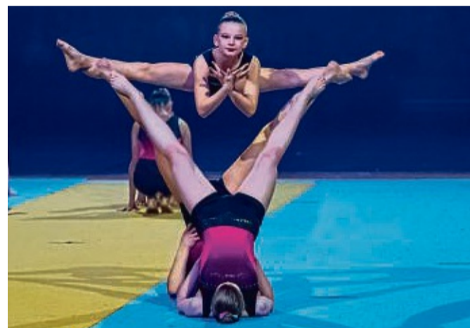
Spagat und Sportakrobatik: Die Aktiven der TG Lispenshausen zeigten ihr Können.