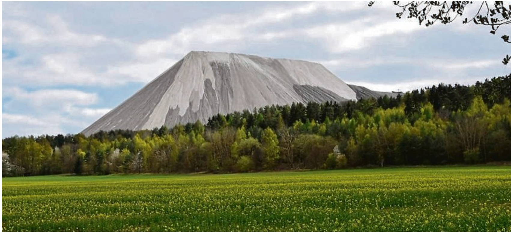
Ein schönes Stück Natur: Das Grüne Band, hier bei Kleinensee.