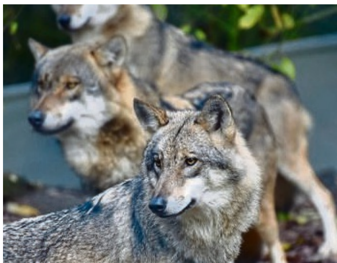
Die Wolfs-Nachweise in Hessen steigen rasant: Noch 2018 gab es keinen einzigen, 2022 waren es 180.

„Am Grünen Tisch in Wiesbaden feiert man die Rück-