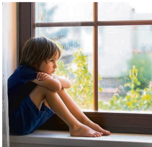
Wenn der Spielkamerad vermisst wird: Auch Kinder trauern um verlorene Freunde.

ein Vorgang, der Zeit braucht und nicht selten viel Kraft kostet. Wenn ein Freund aus der Schule, die Oma oder eine Schwester stirbt, kann es Wochen oder Monate dauern, bis Ihr Kind über den Tod hinweg kommt. Auch wenn der