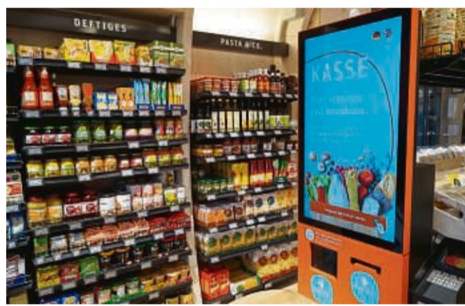
An der Kasse wird selbst gescannt und per Karte bezahlt. Die Preise orientieren sich an denen der tegut-Märkte.

„Dank der Sicherheitsvorkehrungen beim Eintritt sowie vieler Sicherheitskameras und der Kameras der Tankstelle sind wir auch sicher vor Diebstählen.“ Wird der Markt von niemandem benutzt, wird das Licht im Inneren automatisch gedimmt. Gibt es mal ein Problem, kann per Telefon vor Ort Kontakt zu Tegut-Mitarbeitern aufgenommen werden. Draußen gibt es zudem einen Unterstand zum Hunde-Anleinen, ein Bücherregal für Tauschfreudige sowie eine Bike-Station.