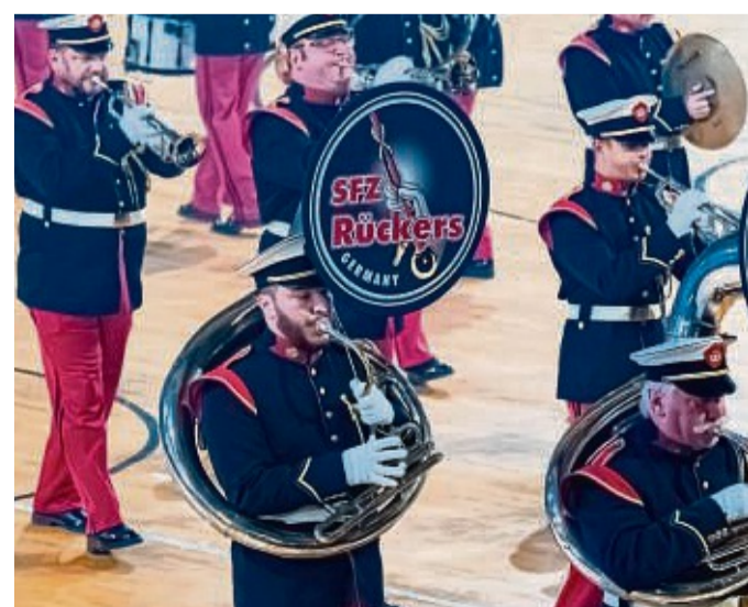
Mit Musik: Der Spielmanns- und Fanfarenzug Rückers unterhielt das Publikum mit Big-Band-Klängen.