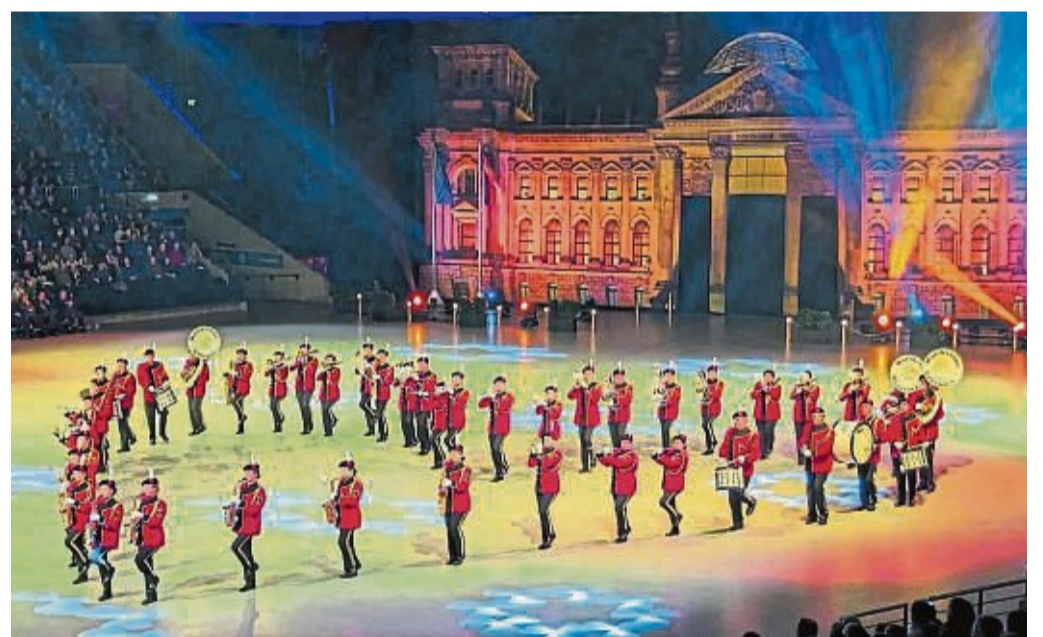
Gelungenes Comeback: Das Musikcorps Ufhausen bei der Musikparade 2023.