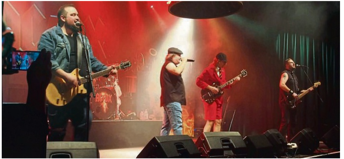
High Voltage-Rock auf hohem Niveau bot die AC/DC-Coverband AC/DX den Besuchern am Samstagabend im Bebraer Lokschuppen.

Glasklare Gitarrensounds, Basslinien, die ihre Ziele tief im Bauch der Zuhörer mühelos erreichten, treibende Beats vom Schlagzeug sowie eine gehörige Portion Spielfreude und augenzwinkernder Humor sorgten dafür, dass der Funke sowohl bei den Status Quo-Covers als auch bei der AC/DC-Hom-