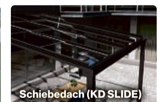
Schiebedach (KD SLIDE)

Aktion ist mit anderen Aktionen nicht kombinierbar.