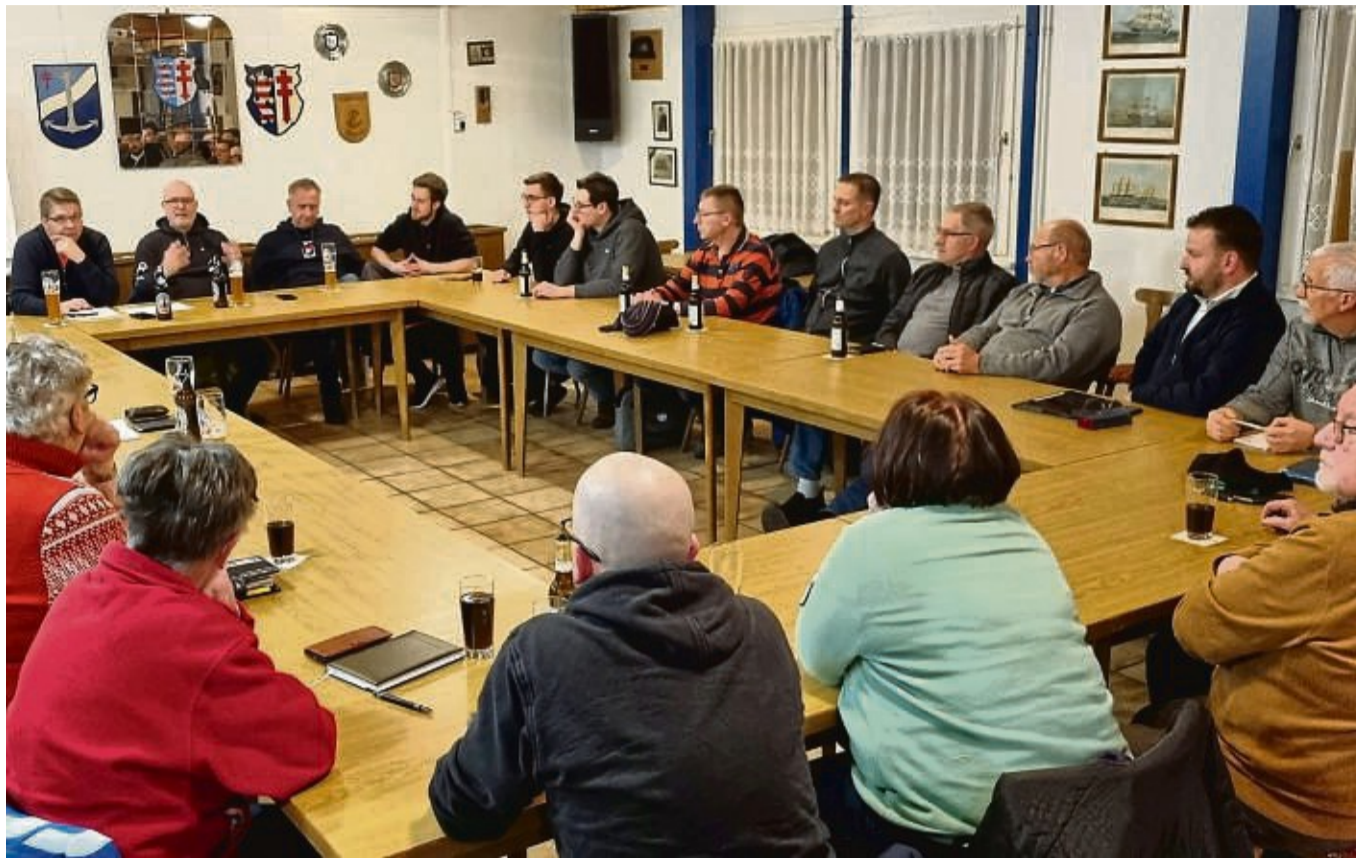
Am Johannesberg soll wieder ein Stadtteilfest stattfinden: Das Interesse an der Idee ist groß, wie die Resonanz auf die Einladung zu einem ersten Treffen zeigte.

„Wenn wir jetzt wieder alle zusammen etwas machen, dann tun wir was für den Zusammenhalt der Bürger und auch die Vereine können sich präsentieren“. Stattfinden sollte das Fest „zwischen Edeka, Tennisclub und Feuerwehr – dem Herz des Johannesbergs“, schlugen die beiden