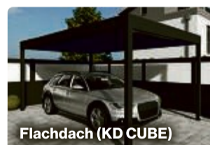
Flachdach (KD CUBE)