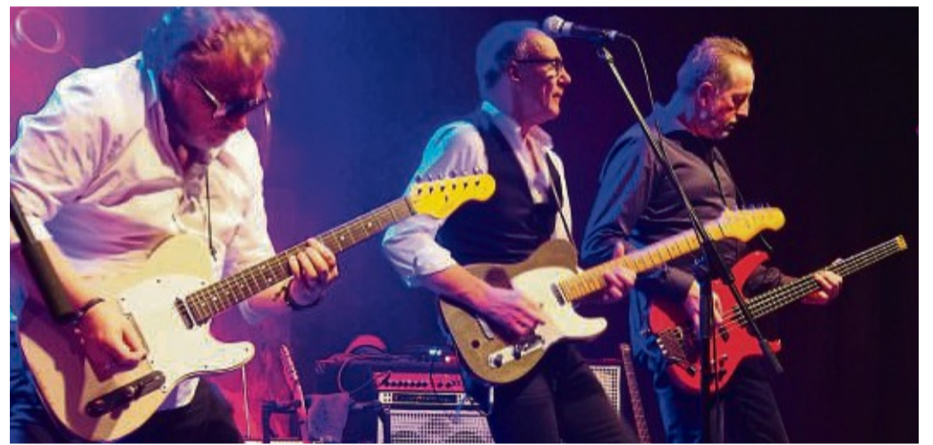
Erdiger Gitarrenrock: Die Mitglieder der Belgian Quo Band begeisterte mit Hits von Status Quo.

Die Stimmung im Publikum, in dem sich viele durch ihre Kleidung wie Kutten und Fan-T-Shirts als echte Anhänger der Bands outeten, war ausgesprochen gut und fröhlich, die Songs wurden lautstark mitgesungen und vor der Bühne wurde ausgelassen getanzt.