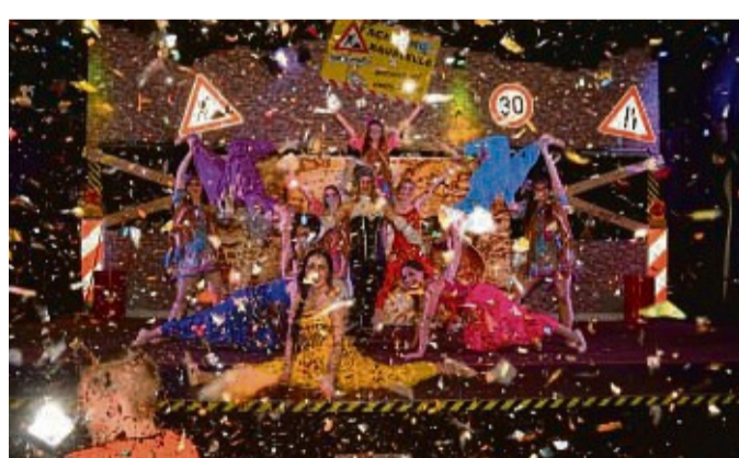
Bunt und abwechslungsreich: Die Auweler Narren laden wieder zum Karneval im Saal des Alten Forsthauses.