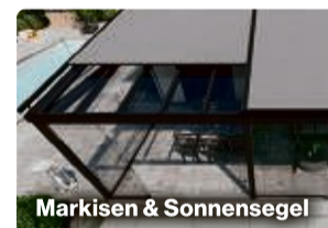
Markisen & Sonnensegel