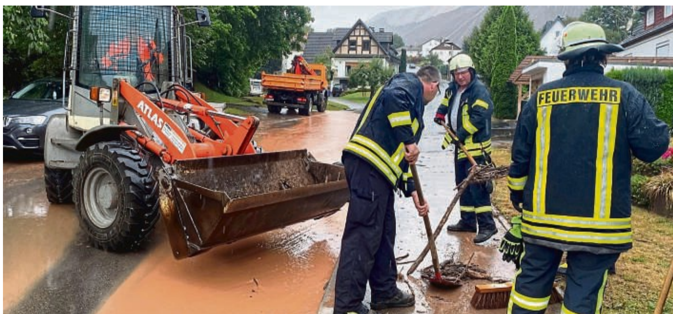
Schlamm, Dreck und überflutete Straßen: Unser Archivfoto entstand nach heftigen Regenfällen in Widershausen. Fließkarten sollen die Gemeinden nun besser gegen Starkregenereignisse wappnen.