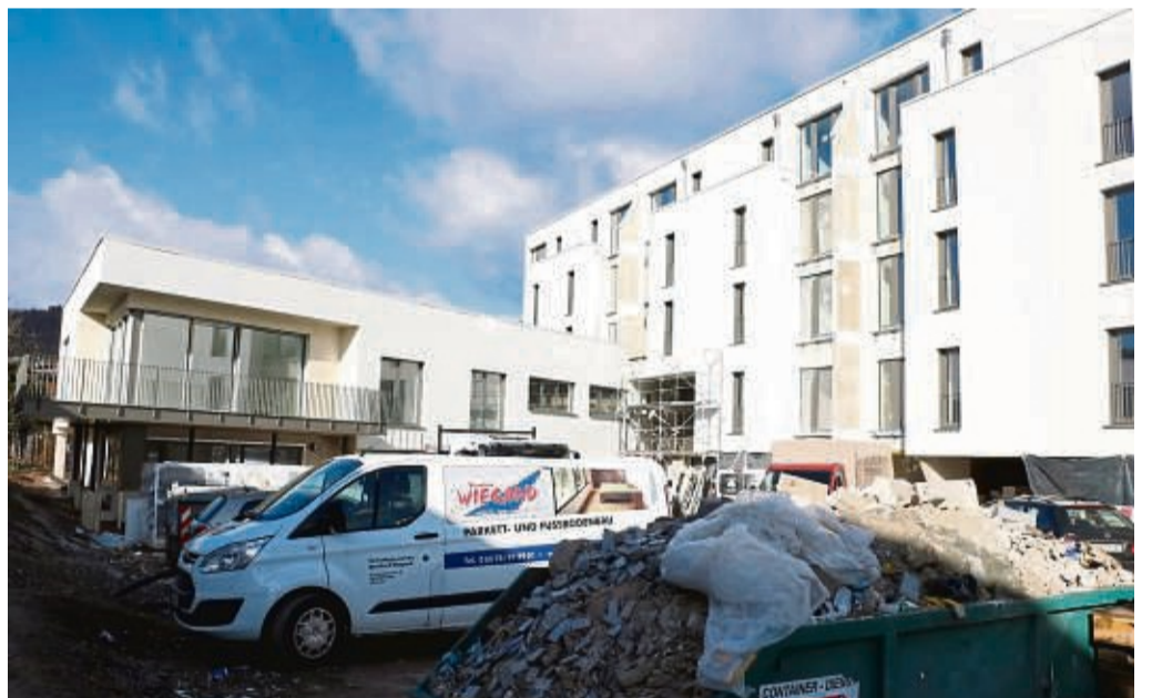
Die Innenfläche zwischen den Gebäuden ist derzeit noch Baustelle. Rechts ist das Gebäude für seniorengerechtes Wohnen zu sehen, links die Tagespflege.

Stadt Rotenburg und die Region ein Novum. Die nächsten vergleichbaren Angebote sind erst in Kassel, Fulda oder Eisenach zu finden. Die Palliativstationen der etablierten Krankenhäuser haben Wartelisten und können den Bedarf nicht abdecken.“ Das Hospiz bietet in Wohn-Apartments Platz für acht Patienten, die hier Gäste genannt werden.