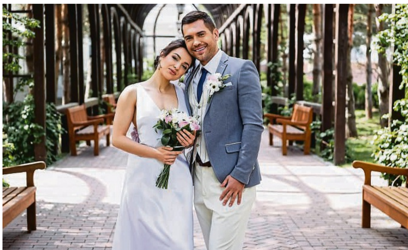
Damit zur Hochzeit und anderen Anlässen alles gelingt, muss reichlich Zeit in die Planung vorab investiert werden, doch die Mühe lohnt sich, um einen unvergesslichen Tag zu erschaffen.

Hochzeiten lassen sich farbenfroh, ganz in Grün oder auch im Vintage-Stil abhalten, um nur drei der unzähligen Möglichkeiten zu nennen. Bei einer Konfirmation wird es an sich eher klassisch, doch können feine Aspekte für eine erinnerungswürdige Feier sorgen. Mit vorausschauender Planung wird zudem in beiden Fällen unnötiger Stress vermieden. Schließlich soll der Tag positiv in Erinnerung bleiben.