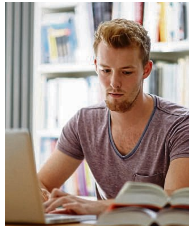
Für eine berufliche Weiterbildung muss man nicht unbedingt Präsenztermine wahrnehmen.