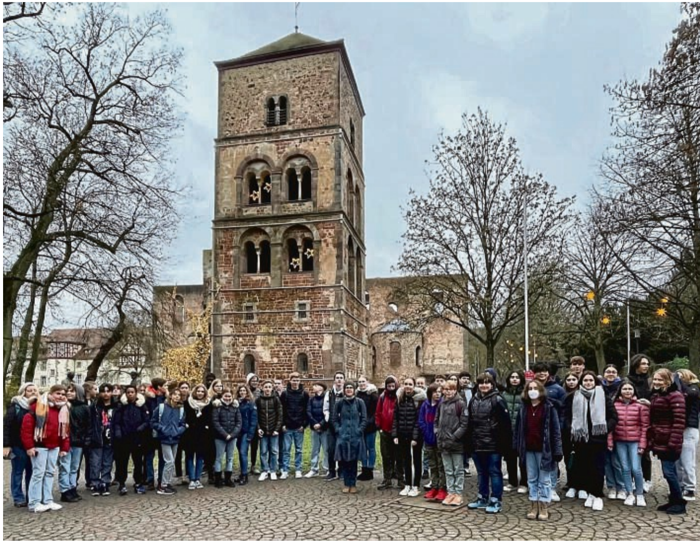
Schülerinnen und Schüler der Gesamtschule Obersberg und ihrer französischen Partnerschule, dem collège Jules Michelet in Tours.