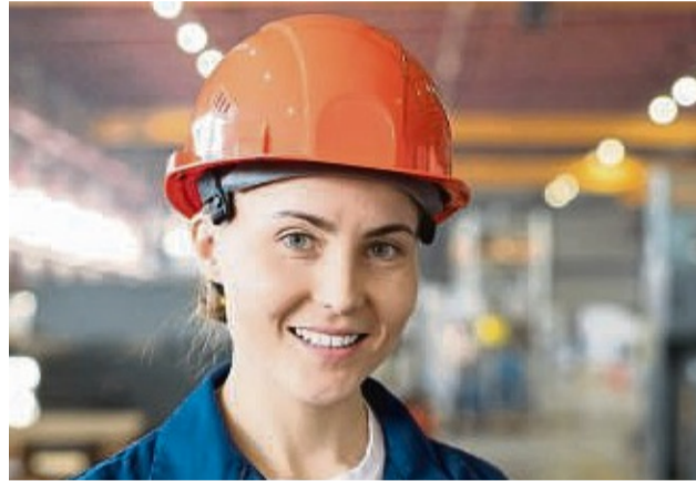
Mit einer vom Arbeitgeber finanzierten privaten Krankenversicherung können Unternehmen gut ausgebildete und motivierte junge Leute gewinnen und diese auch langfristig halten.