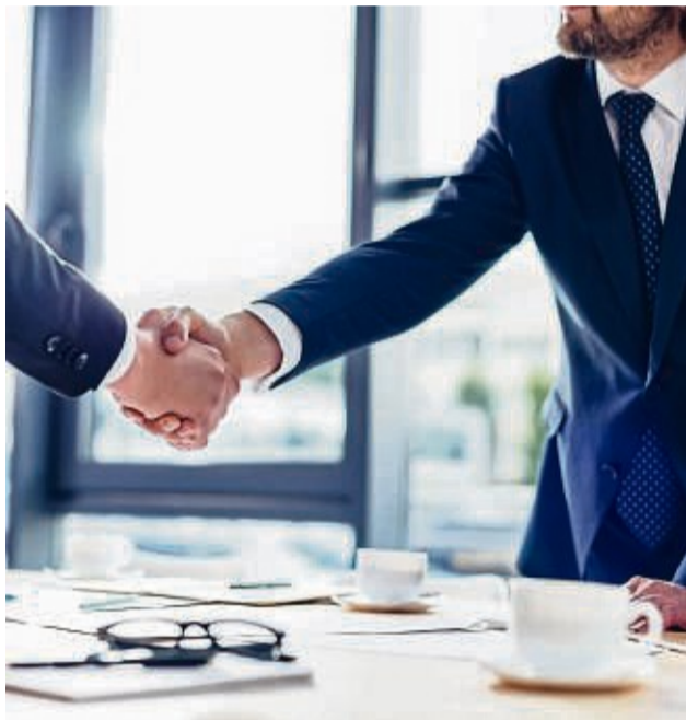
Mit guter Vorbereitung und Lust auf den Job klappt der Neuanfang.