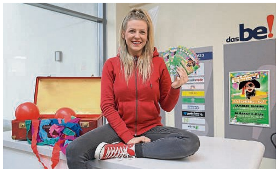
Fräulein Glitzer freut sich auf tolle Faschings-Aktionstage im Bebraer Einkaufszentrum „das be!“.

Das alles sollte man auf keinen Fall verpassen!