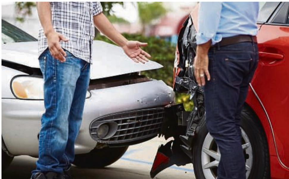
Männer rasen mehr und bei ihnen kracht es laut einer Umfrage häufiger. Mit angepasster Geschwindigkeit und einer vorsichtigen Fahrweise lassen sich teure Unfälle aber vermeiden.