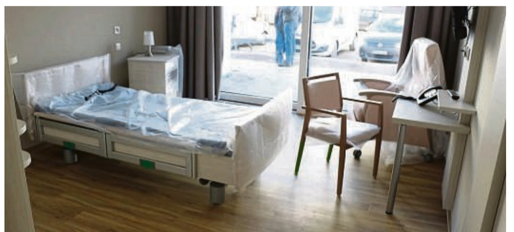
Die Zimmer sind schon fertig eingerichtet. Die Möbel werden während der letzten Arbeiten noch von Folie geschützt.