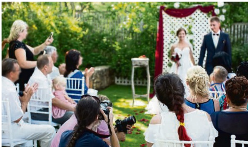
Wenn zur Hochzeit viele Fotos gemacht werden, lohnt sich das Rausputzen und in Schale werfen gleich doppelt.