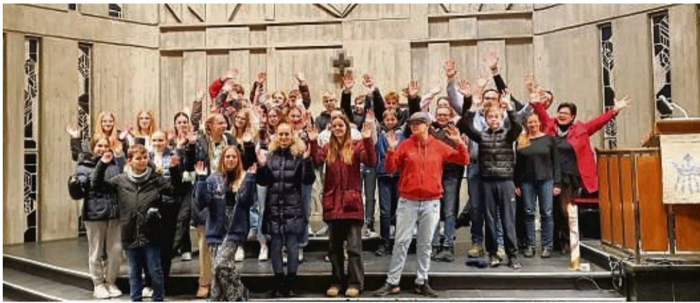
Gemeinsamer Jugendgottesdienst der aktuellen Konfirmationsjahrgänge der Martinskirchengemeinde zusammen mit der Stadt- und Johanneskirchengemeinde.