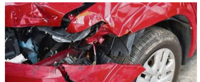
So ein Schaden muss nicht sein.