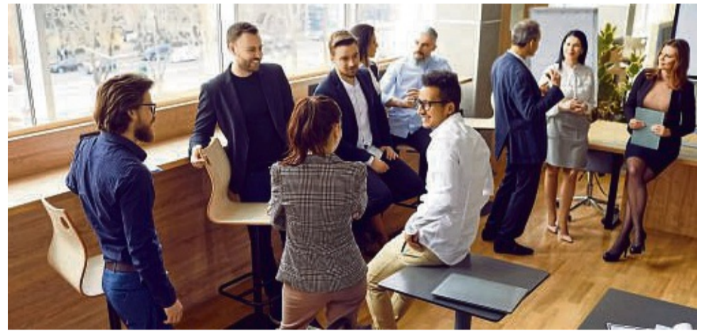
Eine vom Arbeitgeber finanzierte private Krankenzusatzversicherung kann dazu beitragen, die Fluktuation unter den Beschäftigten niedrig zu halten.

Der Studie zufolge beschäftigt sich mehr als die Hälfte der befragten Unternehmen, die noch keine bKV anbieten, bereits konkret mit dem Abschluss oder steht der bKV zumindest offen gegenüber. Dabei sind es vor allem größere Arbeitgeber mit mehr als 50 Mitarbeitern, die sich eine bKV im eigenen Betrieb gut vorstellen