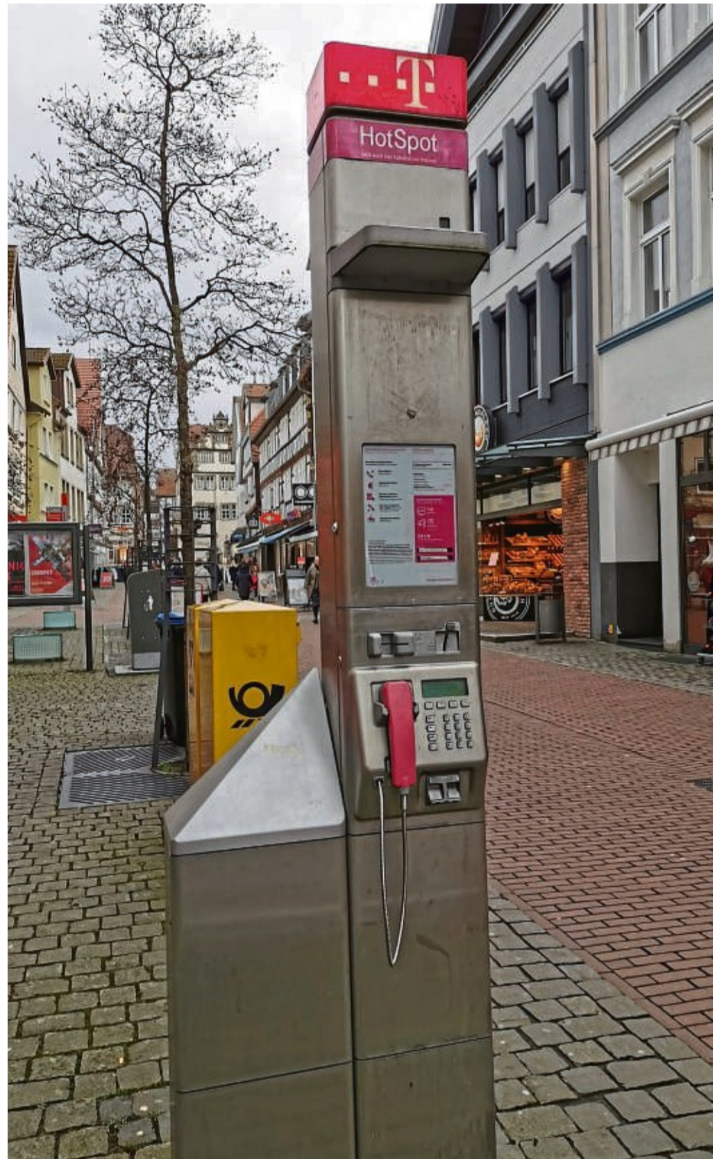
Entschuldigung, zur Zeit gestört steht auf den Displays der übrig gebliebenen Telefonsäulen, wie auch hier in der Klausstraße in Bad Hersfeld gegenüber der City-Galerie. Die einst so schicken Zellen mussten schon vor Jahren weichen.

Die Gründe für den Abbau der öffentlichen Telefone seien vielschichtig, so McKinney. Mit dem Mobilfunk habe heute jeder die Möglichkeit seine „persönliche Telefonzelle“ dabei zu haben. Die Nutzung der öffentlichen Telefonie ginge somit gegen null. Der Hauptgrund für die Einstellung des Services ist daher die Unwirtschaftlichkeit. So sei an rund einem Drittel der öffentlichen Telefone, also 3800 Standorten, im letzten Jahr kein einziges Gespräch geführt worden. Im Schnitt