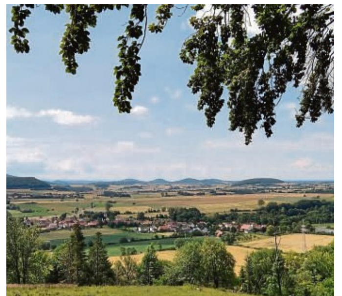
Ausblick auf das hessische Kegelspiel, das Teil des Biosphärenreservates Rhön ist.