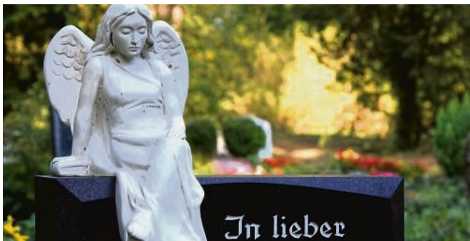
So individuell wie der Verstorbene sollte auch die Grabinschrift sein. Zudem kann der Grabstein noch mit Figuren verschönert werden.

Grabsteine sind immer mit einer Beschriftung versehen, sie sollen schließlich als Gedenktafel an den Verstorbenen erinnern, dies ist kaum möglich, wenn nicht zumindest ein paar Daten festgehalten werden. Grundsätzlich entscheiden Sie als Angehörige, welche Grabsteininschrift Sie sich wünschen. Die Vorschriften hierfür sind zwar von Friedhof zu Friedhof verschieden, meist lässt Ihnen die Friedhofsverwaltung hier aber viel Freiraum.