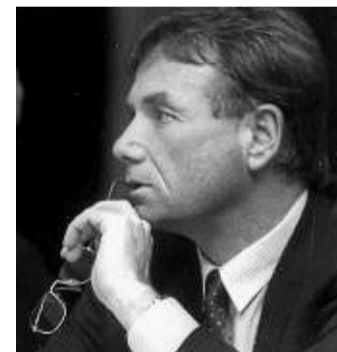
Günter Simon: Der SPD-Politiker starb mit 82 Jahren.

Mit dem Bus ins Theater! PREMIERENABO SPIELZEIT 2022-2023 SAMSTAGS, 19:30 UHR