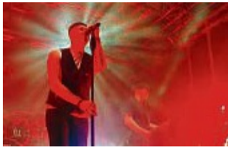
Keine Odensachsen-Neulinge: Vanitas, die Broilers Tribute Band, war schon zweimal in Odensachsen.