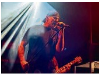
Die Rappelkiste ist im Sommer 2023 wieder auf der Bühne des Haune-Rock in Odensachsen zu hören.