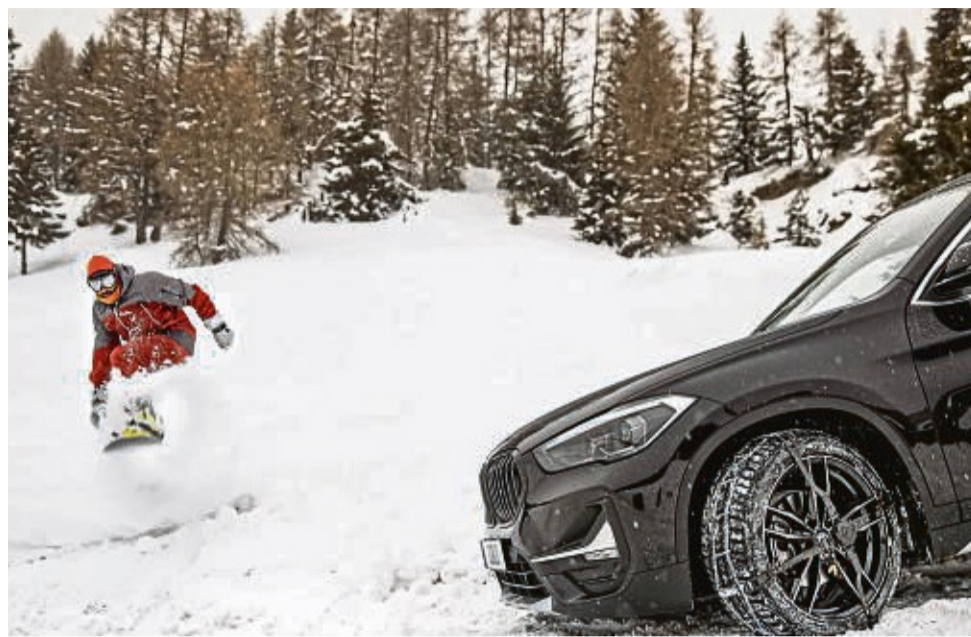
Ski- und Snowboardfahrer sollten sich auf die Reise in alpine Regionen gut vorbereiten: Möglichst leicht montierbare Schneeketten etwa sind häufig unentbehrlich.

Wer dort in der kalten Jahreszeit mit dem Auto unterwegs ist, kommt nur mit Winterreifen oft nicht weiter. Denn auf langen und