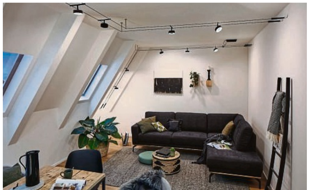
Auch an Dachschrägen kann man mit den Seilsystemen für gutes Licht im ganzen Raum sorgen.

Für eine funktionale und gemütliche Wohnraumbeleuchtung empfiehlt sich eine Kombination aus verschiedenen Leuchten auf dem Schienensystem. Spots mit breitem Ausstrahlwinkel beispielsweise eignen sich zur Beleuchtung von Möbeln, Wohnwänden oder Küchenzeilen, eng gebündelte Strahler hingegen für Bildergalerien. Als