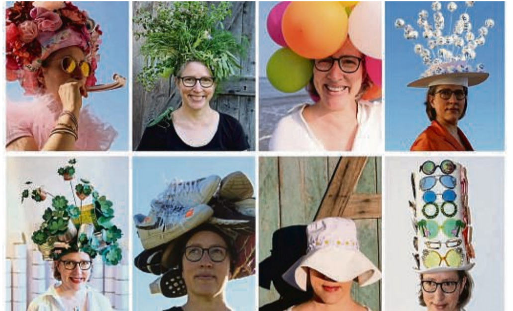
Die Sonderausstellung „100 Hüte“ wird ab 18. April im wortreich zu sehen sein.

Weitere Informationen unter wortreich-badhersfeld.de oder telefonisch über 0 66 21/79 48 90. Der Eintritt in die Sonderausstellung ist kostenlos, es wird aber um Spenden für den Wünschewagen gebeten. red/ebe