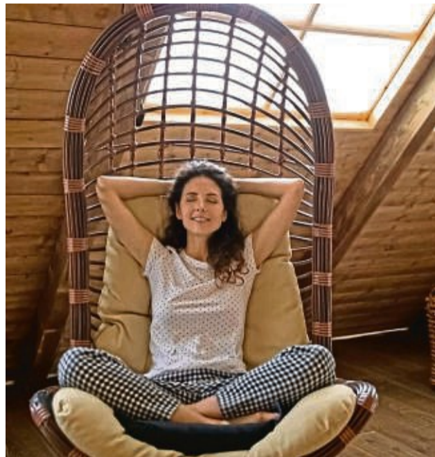
Auch unterm Dach kann es im Sommer angenehm temperiert sein.

Solange es draußen noch hell ist, helfen zugezogene Vorhänge oder herunterge-