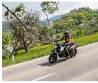
Raus auf die Straße: Auf die erste Ausfahrt in der neuen Saison bereiten sich Motorradfahrer am besten gut vor.

Im Jahr 2022 ereigneten sich in Hessen insgesamt