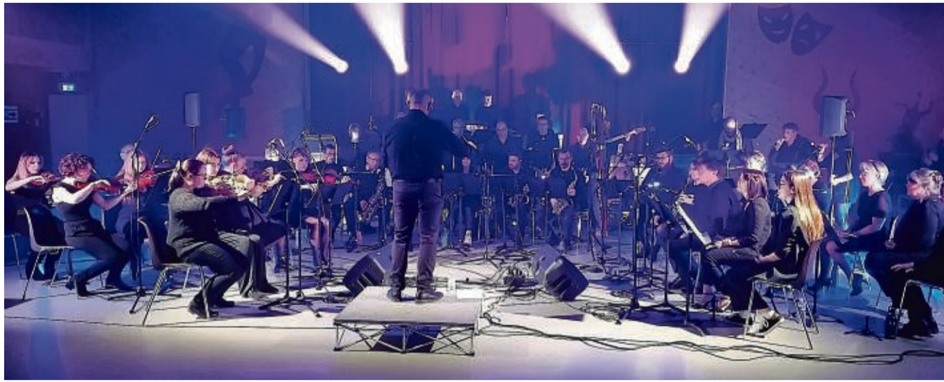
Das französische Orchester Stratosfonic ist Ende April zu einem Konzertbesuch zu Gast in Ludwigsau und Bad Hersfeld.