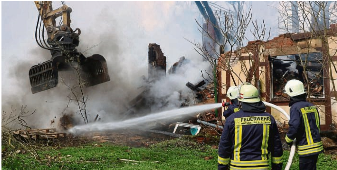
Das Haus des „Kannibalen von Rotenburg“ im kleinen Ort Wüstefeld ist am frühen Montagmorgen in Flammen aufgegangen. Die Rotenburger Feuerwehr bekämpfte den Brand mit rund 80 Einsatzkräften.