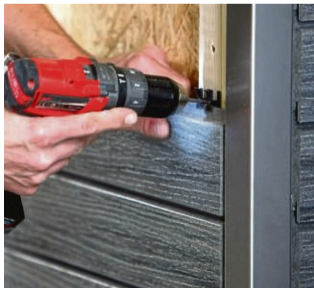
Fassadenprofile werden mit einer Nut- und Spundverbindung formschlüssig auf einer Holzunterkonstruktion angebracht.

Bei der Auswahl der Materialien sollte man unter anderem auf starke Witterungsbeständigkeit, einen geringen Wartungsaufwand und eine hohe Langlebigkeit achten.