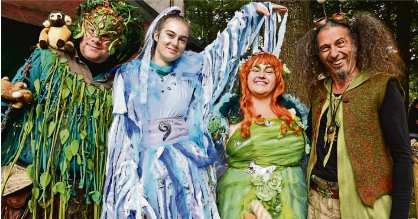
Zum fünften Mal in Rotenburg: Das nach eigenen Angaben „größte Fantasy-Festival Deutschlands“ wird vom 18. bis zum 21. Mai wieder allerhand schöne, schaurige und schräge Gestalten in den Schlosspark locken.

Am 18. Mai, Christi Himmelfahrt, geht es los. Beim Vaterstags-Special können sich speziell die Männer bei einem Highland-Games-Wettbewerb messen und zum Annotopia-Familienheld 2023 aufsteigen. Der „Endzeit-Bereich“ wird an diesem Tag ab 19 Uhr nur für Ü18-Publikum