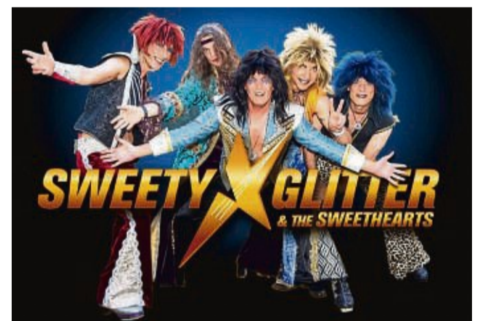
Rocken die Bühne im Lokschnuppen: Sweety Glitter & The Sweethearts.