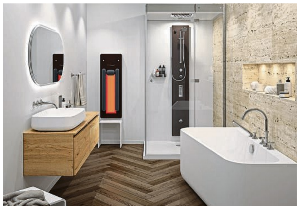
Wie Sie Ihr Badezimmer mit einem Infrarotmodul, einem Dampfbad, einem Whirlpool oder einer Sauna zur Wellnessoase verwandeln, erfahren Sie auch in der Badausstellung der Firma Ullrich und können diese Produkte in Funktion besichtigen.