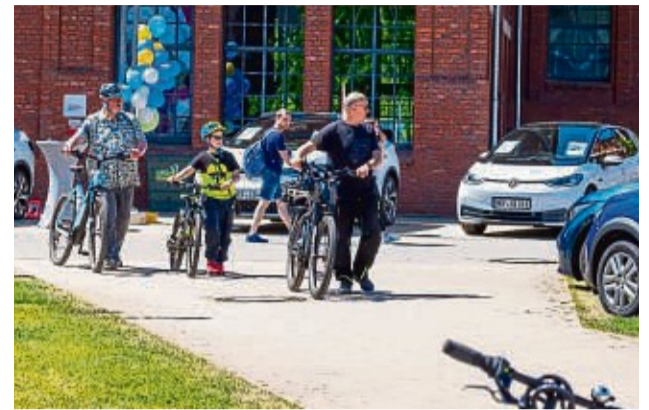
Diesmal wird der Mobile Tag ohne die Mückenstürmer Classics (eine Woche später) präsentiert.

Für ein spannendes Rahmenprogramm sorgen unter anderem die Freiwillige Feuerwehr Bad Hersfeld, die im Zeitraum von 11 bis 15 Uhr die Rettungen aus verunfallten Autos vorführen