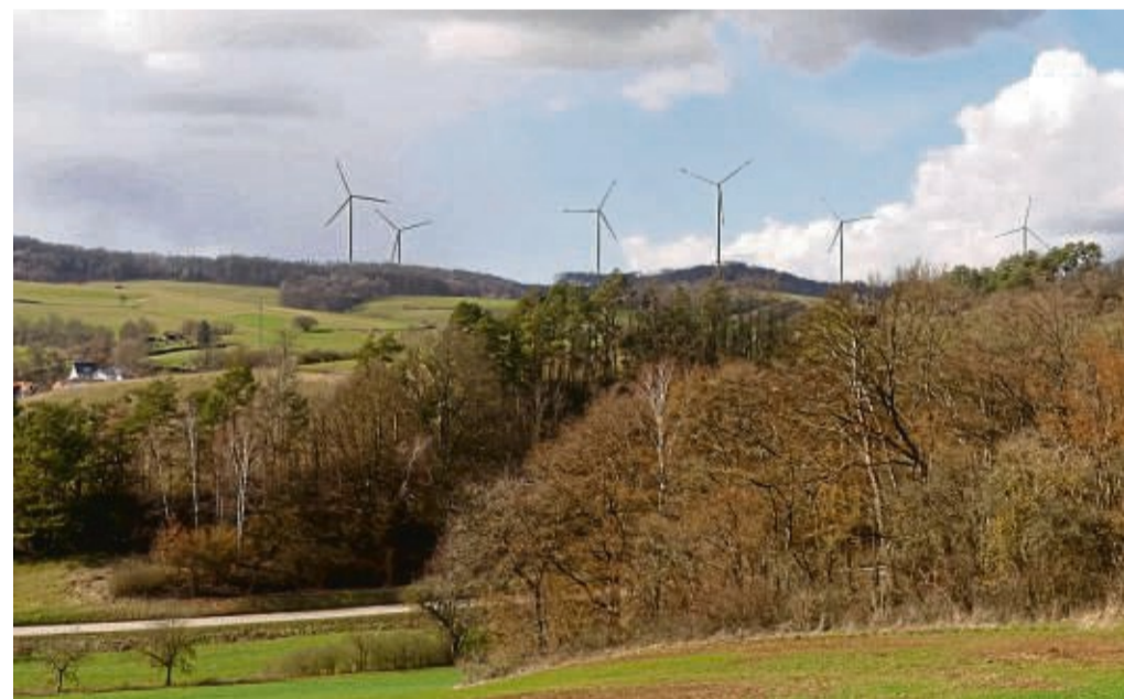
So könnte der Blick über Erkshausen mit den Windrädern aussehen. Die Fotomontage hat das Windkraftunternehmen erstellt.

36199 Rotenburg | Neustadtstraße 4 | Tel.: 06623 919233 info@fulda-perle-touristik.de | www.fulda-perle.de