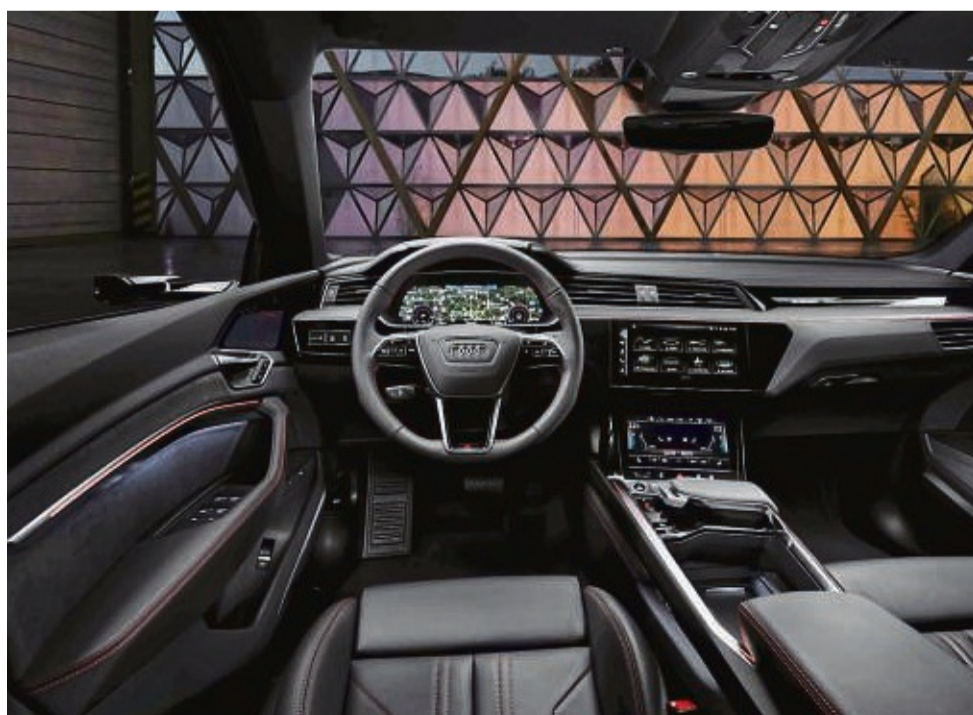
Sein schickes Interieur zeigt hier der Audi Q8 e-Tron Quattro.

Hünfelder Str. 39-43, 36251 Bad Hersfeld Tel.: 0 66 21 / 50 11-0 info@audi-hersfeld.de, www.autohaus-fink.audi