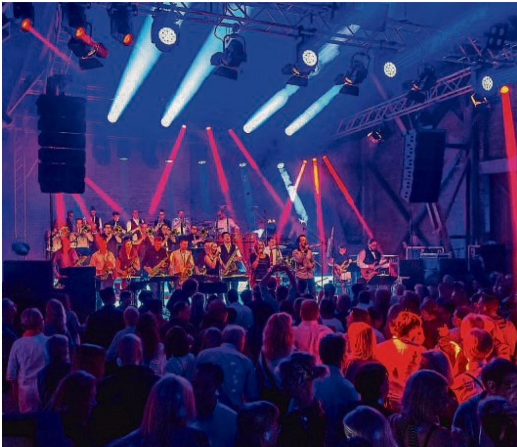
Vorsicht Gebläse! gastiert in Philippsthal in der Kreuzberghalle am 30. April.