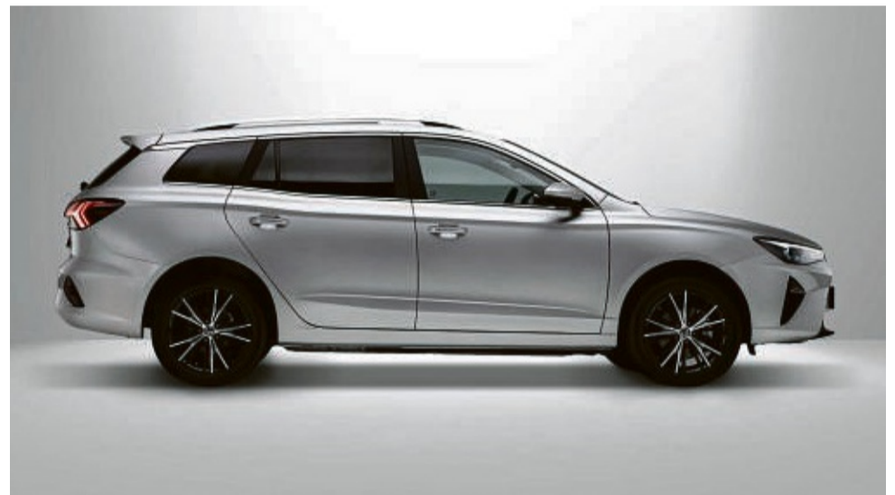
Der MG5 setzt ganz klar auf Elektroantrieb.

Am 3. Juni findet der Flohmarkt wieder wie gewohnt auf dem L'Hay-les-Roses-Platz statt.