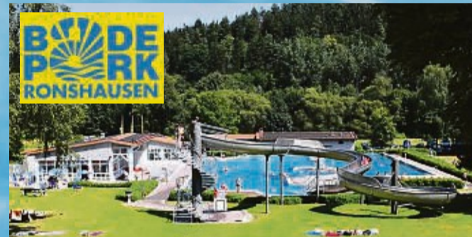
BadePark Ronshausen, Am Sportplatz, 36217 Ronshausen