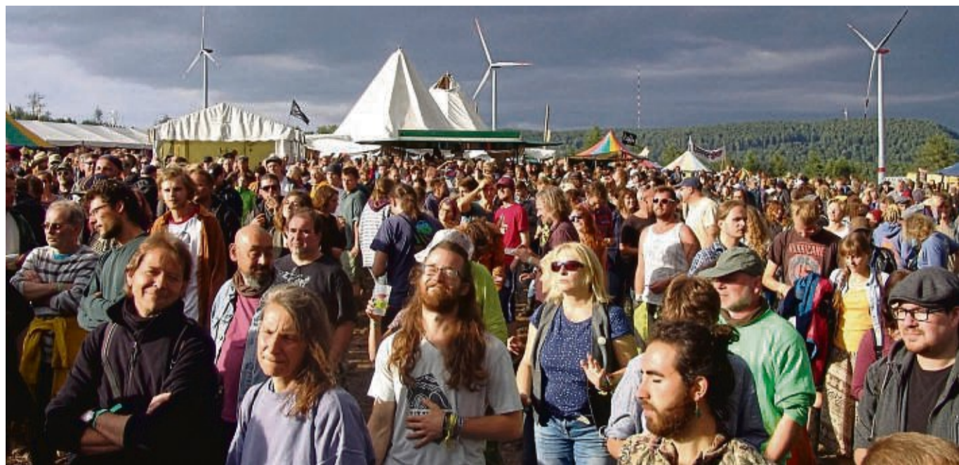
Mehr als 10 000 Hippies werden am letzten Juli-Wochenende in Breitenbach zum Burg-Herzberg-Festival erwartet. Unser Bild entstand im Jahr 2017.