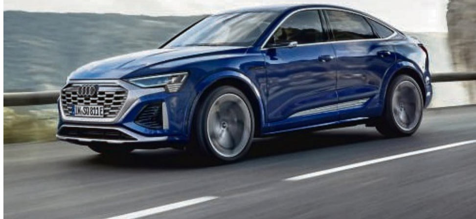
Besser in allen Bereichen: Der Audi SQ8 Sportback e-Tron ist jetzt erhältlich.