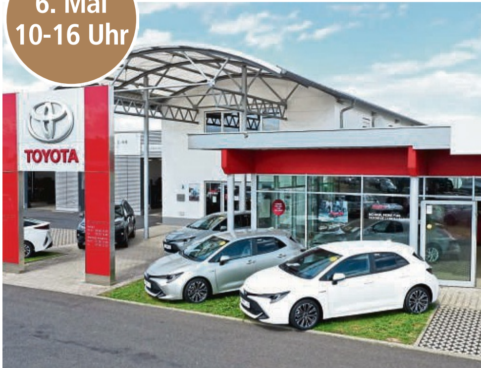
Das Autohaus Nix in Petersberg bietet eine Bandbreite an Toyota-Modellen.