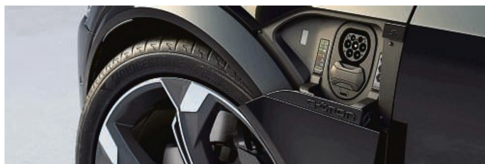
Der Audi SQ8 e-Tron verfügt über eine edle Ladebuchse vor der Fahrertür.