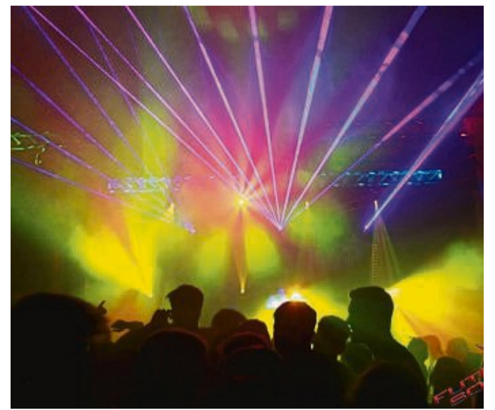
Zusammen mit Future Sound veranstaltet der Kuckucksmarkt den Tanz in den Mai auf dem Kuckucksmarkt-Gelände in Braach.