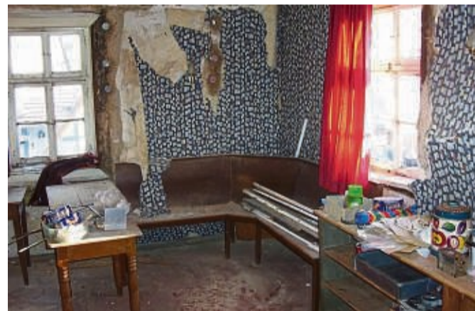
Wie viel Arbeit im neuen Haus Niemeyer steckt, zeigt diese alte Aufnahme der Heimatstube aus dem Jahr 2006.