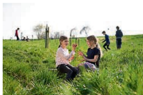
EAM-Stiftung 2023: Projekte aus vier verschiedenen Themenbereichen werden in diesem Jahr gefördert.

Telefon: 0561 933-1015 E-Mail: Stiftung@EAM.de