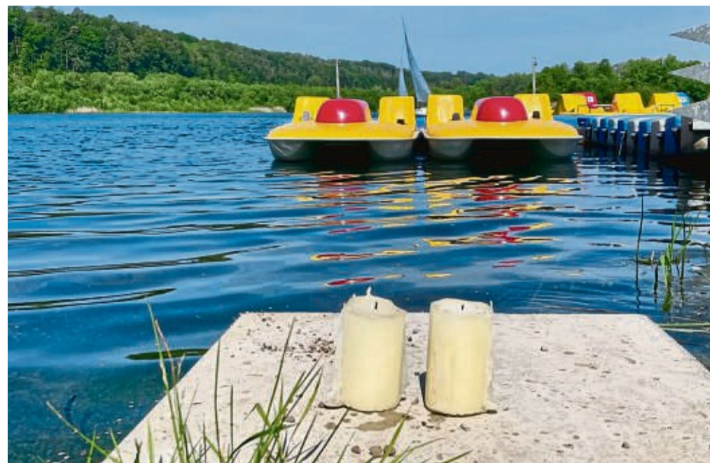
Zwei Kerzen stehen nach dem tragischen Unglück am Ufer des Breitenbacher Sees und erinnern an die beiden Jugendlichen aus Sontra, die hier am Samstag ertrunken sind.

Das tragische Geschehen lässt sich nach ersten Informationen so rekonstruieren: Mehrere Jugendliche waren am frühen Samstagabend mit einem Tretboot auf dem See unterwegs. Der 13-Jährige und die 15-Jährige befanden sich dabei laut Polizei im Wasser und gerieten aus bisher ungeklärter Ursache unter die Oberfläche des Sees, ohne wieder aufzutauchen. Ein dritter Jugendlicher versuchte noch, sie im Wasser zu finden – dabei verließen ihn die Kräfte und er kehrte zum Boot zurück. Die genauen Hintergründe sind Bestandteil der weiteren Ermittlungen, teilte die Polizei mit.