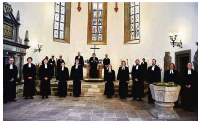
Sie sagen Ja zur Kirche und zu ihrem neuen Amt: Elf Theologinnen und Theologen wurden am Pfingstsonntag in einem Festgottesdienst in der Stiftskirche in Rotenburg an der Fulda ordiniert und damit offiziell in ihr Amt als Pfarrerinnen und Pfarrer der Evangelischen Kirche von Kurhessen-Waldeck (EKKW) eingeführt.

Nach einem kräftigen „Lob den Herren“, dem gemeinsam gesprochenen Psalm 146 und dem von einem Chor der Großen Kantorei vorgetragenen Bach-Werk „Jauchzet, lobet“ geht die Bischöfin auf die Kanzel. Sie macht den angehenden Pfarrersleuten Mut: „Sie tragen dieses Amt nicht allein, die Gemeinde