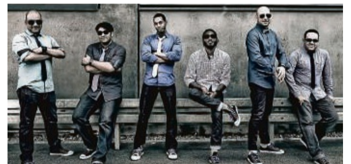
Die amerikanische Band „Undivided“ gibt am 13. Juni ein Konzert in Niederjossa.