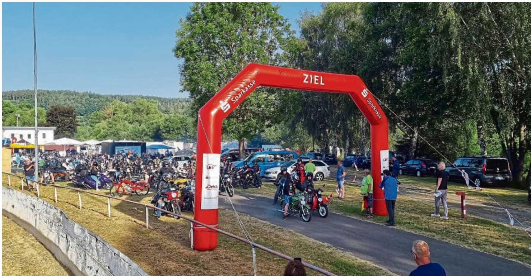
650 Teilnehmer werden im Juni zum 3-Länder-Moped-Marathon in Bad Hersfeld erwartet. Unser Bild zeigt den Start im vergangenen Jahr.

650 Teilnehmer werden am 17. Juni in Bad Hersfeld erwartet