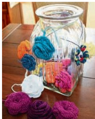
Aktion „Veilchen gegen Veilchen“: Die ersten Blüten sind schon fertig.

Bis zum 10. November können die kleinen Blüten, die möglichst noch einen Faden zum Zusammennähen haben sollten, abgegeben werden. Sammelstellen sind das Bürgerservicebüro der Kreisverwaltung und die Stadtbücherei