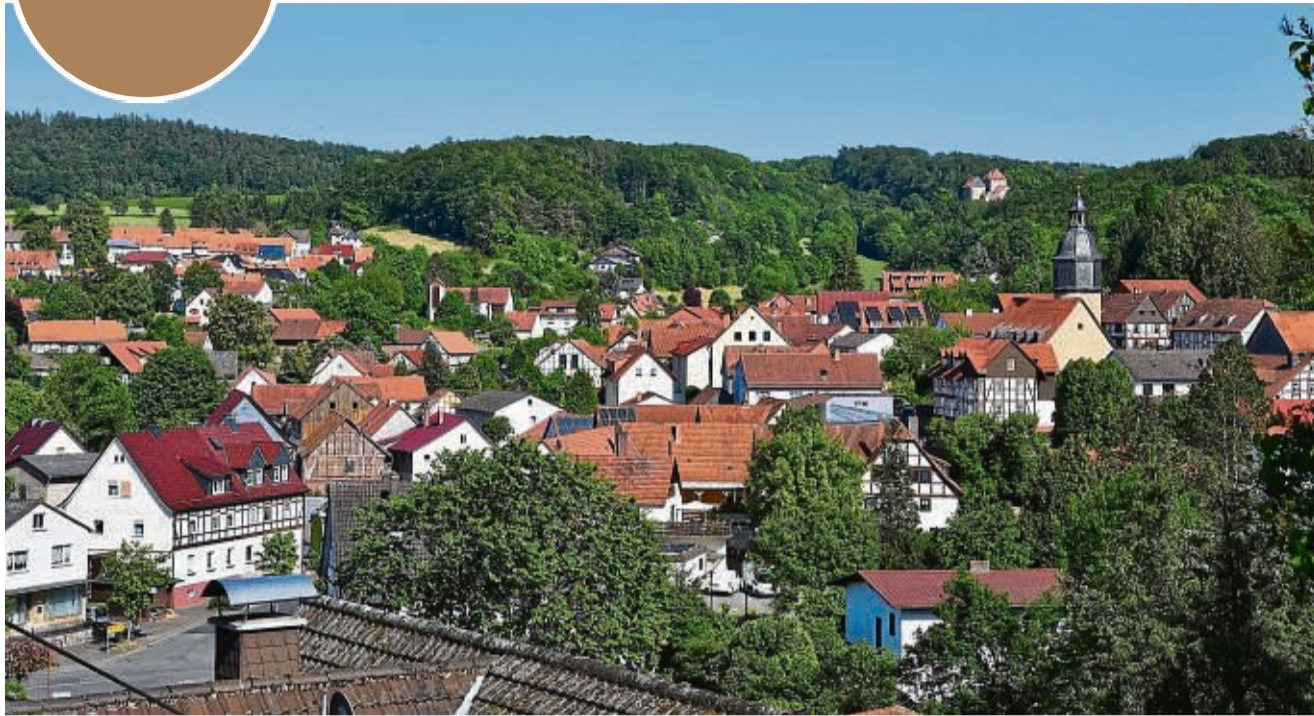
Idyllisch: Der Blick auf Nentershausen.