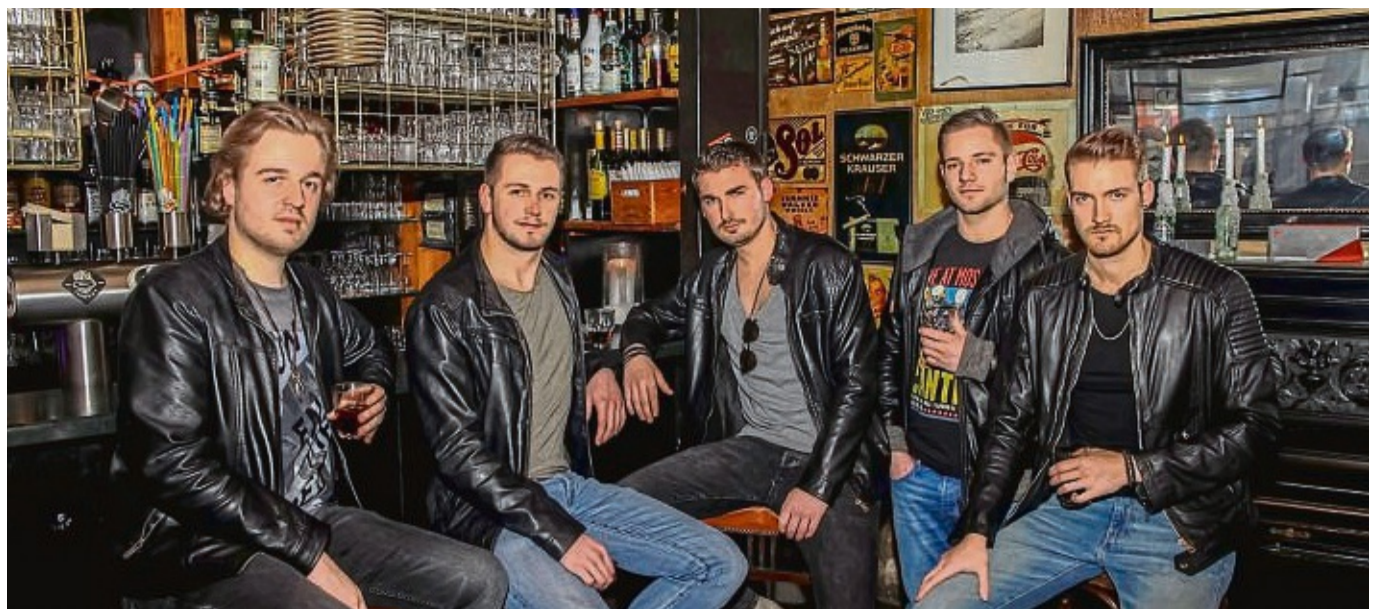
Treten beim Heringer Stadtfest auf: Die Long Island City Rockers versprechen handgemachte Musik.