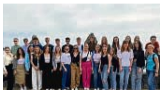
Die Latein-AG der Modellschule Obersberg auf Sizilien.

Am dritten Tag fuhr die Latein-AG mit dem Bus zum