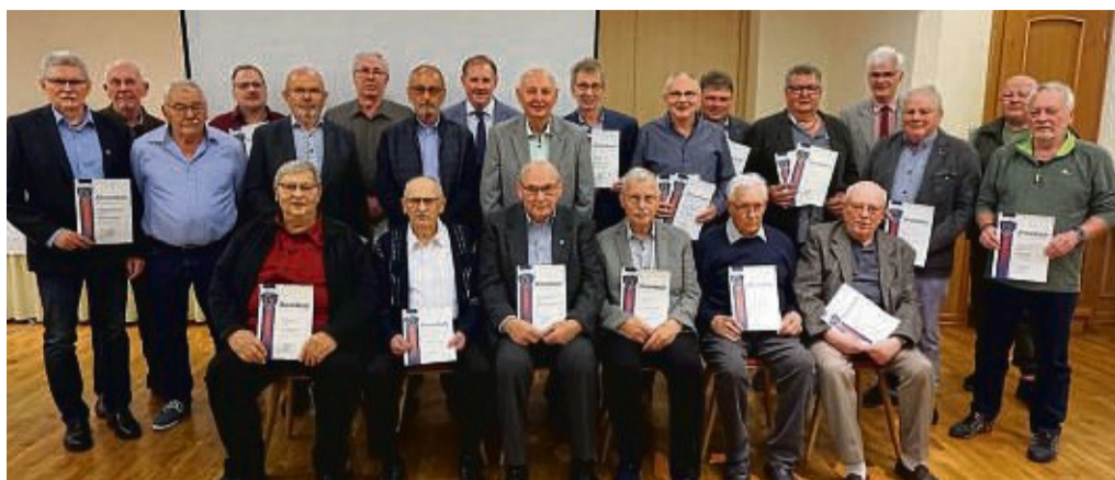
Beim Komersabend „50 Jahre Angelverein Ronshausen 1973“ wurden zahlreiche Mitglieder geehrt.

Nach dem Rückblick auf die Vereinsgeschichte erfolgte ein Ausblick in die Zukunft: „Im Bewusstsein, dass die wunderschöne Teichanlage, welche harmonisch in die Landschaft eingebettet ist, in den nächsten Jahren weiterhin Bestand hat und