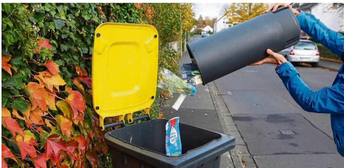
Plastikmüll landet im Landkreis Hersfeld-Rotenburg seit Jahresbeginn in Gelben Tonnen.