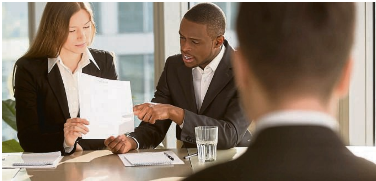
Fragen zum Lebenslauf können sich im Vorstellungsgespräch ergeben. Daher sollten Bewerber genau wissen, was sie dort warum angegeben haben.