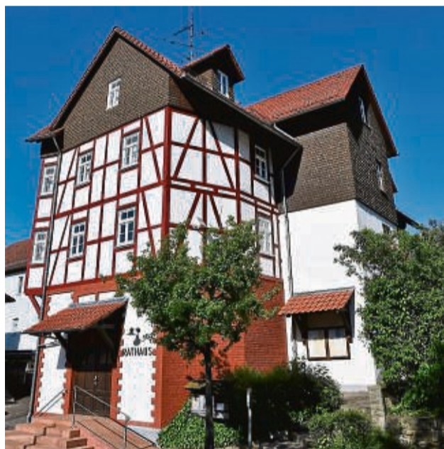
Ein Schmuckstück: Das von Rathaus Nentershausen.

Am Sonntag hält Pfarrerin Annette König um 10 Uhr auf dem Festgelände einen