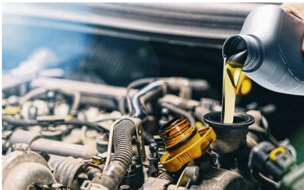
Frisches Motoröl wird beim Ölwechsel eingefüllt. Auch Kühlwasser und Scheibenwischerwasser sollten vor langen Fahrten gefüllt sein.

Die Reifen müssen auf langen Fahrten, heißem Asphalt und Schotterpisten am Urlaubsort Höchstleistung bringen. Das Restprofil sollte drei Millimeter nicht unterschreiten. Zudem sind sie auf Schäden zu prüfen – auch an der Innenseite. Der Reifendruck ist der höheren Beladung des Kfz anzupassen. Das gibt Sicherheit und spart Kraftstoff. Ein handlicher Reifendruckprüfer erlaubt einen schnellen Zwischencheck unterwegs.