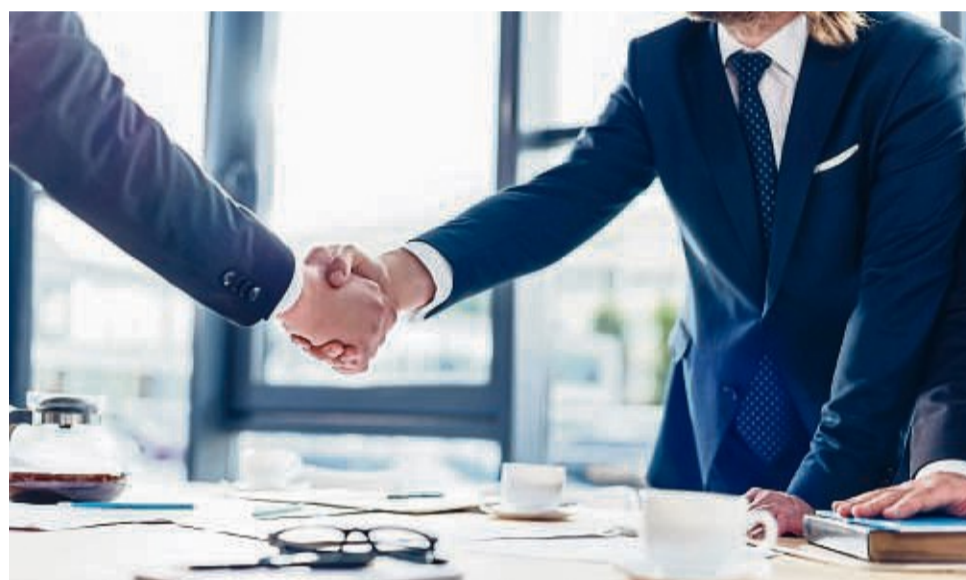
Auch wenn der Händedruck durch die Pandemie nicht mehr überall geläufig ist, wirkt er bei einem Bewerbungsgespräch doch professionell.

Nun geht es auch schon an den Haupttext des Anschreibens. Eingeleitet wird es mit „Sehr geehrter Herr XY,“ oder „Sehr geehrte Frau XY,“. Suche dir also unbedingt deinen Ansprechpartner mit Namen heraus, nur im Notfall geht die anonyme Anrede „Sehr geehrte Damen und Herren,“ durch. Neben deiner persönlichen