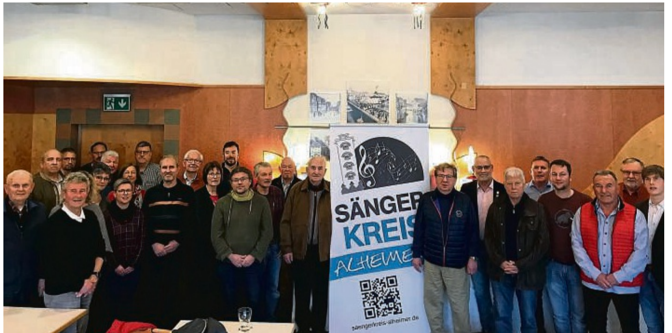
Tipps zum Vereinsleben standen im Fokus bei einem Infotag des Sängerkreises Alheimer.