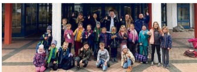
Die Schwimmhäuse vor dem Aqua Fit.

Als 2019 die Corona-Pandemie begann, wurden viele Schwimmbäder geschlossen. Es gab keinerlei Möglichkeiten für Kinder, ihre Schwimmfähigkeiten zu verbessern. Deshalb ist es der Stadtjugendpflege jetzt ein wichtiges Anliegen, dass die Kinder auch von städtischer Seite ein Schwimmangebot