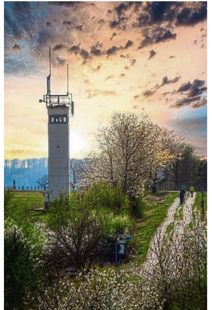
Ein Ort der Aufarbeitung und Aufklärung: Point Alpha war ein US-Beobachtungsstützpunkt an der innerdeutschen Grenze. Heute ist hier eine Begegnungsstätte.