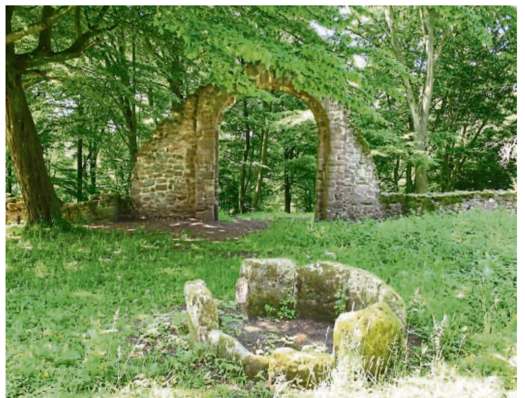
Der noch erhaltene Torbogen ist das Wahrzeichen der Gemeinde Wildeck.