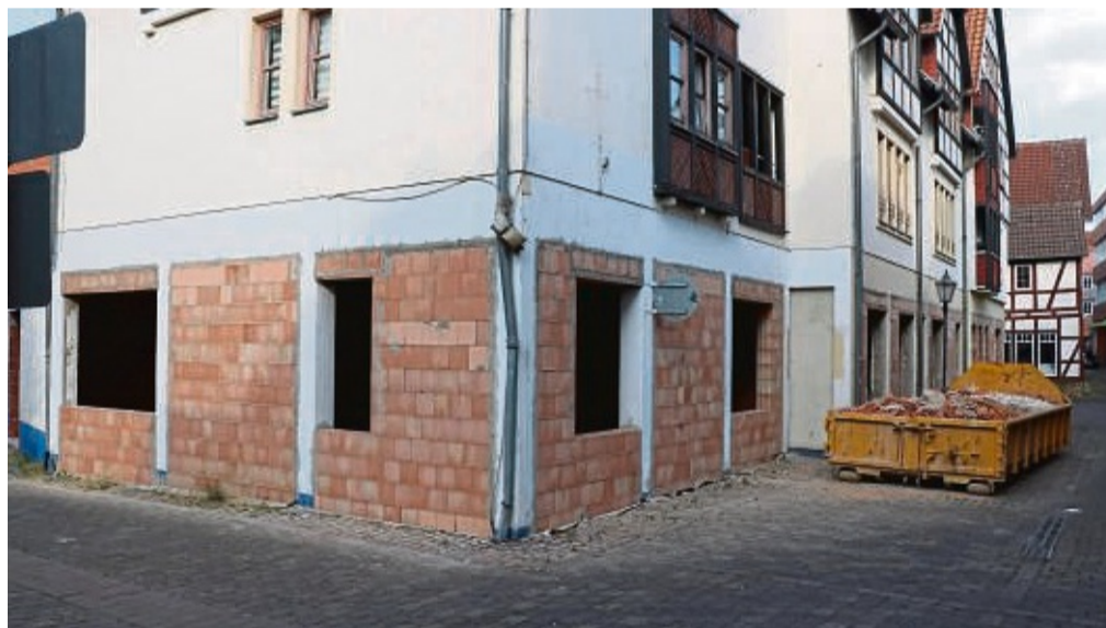
Das Gebäude an der Scheunengasse wird derzeit umgebaut. Die neu gemauerten Wände stehen dort, wo früher der Eingang von Sport Schild war.

Die künftigen Bewohner würden einen Teil ihres Tages mit ihrer Arbeit bei den Werkstätten verbringen. Zur übrigen Tageszeit bieten die