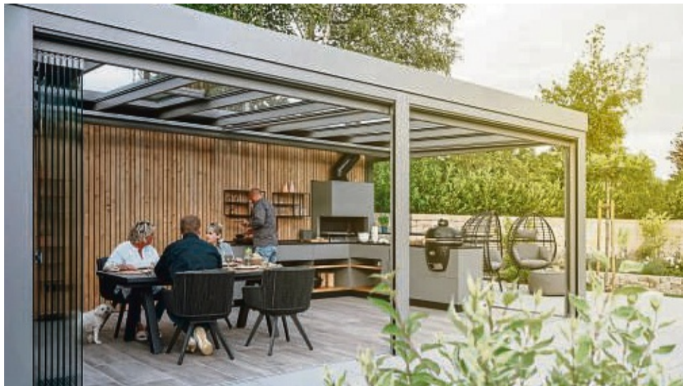
Grillgenuss bei jedem Wetter: Eine überdachte Outdoorküche macht unabhängig von den Launen der Witterung.

Wer den Kochbereich im Garten umfassend ausstattet, denkt daher früher oder später auch über eine feste Überdachung nach. Damit wird aus der Grillstelle ein