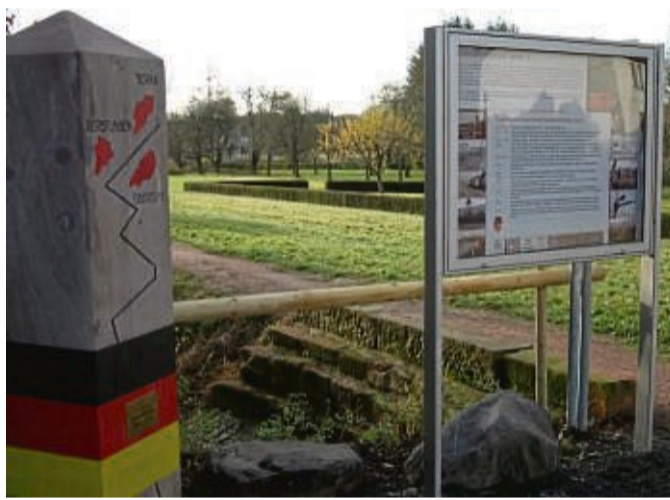
Der Grenzlehrpfad bietet Einblicke in die Geschichte.

Pflanzenwelt des Naturschutzgebietes „Rhäden“ lässt sich auf dem etwa acht Kilometer langen Rundweg auf vier Aussichtsplattformen bestaunen. Der Rhäden ist ein etwa 300 Hektar großes Niederungsgebiet in einer durch Salzauslagerungsprozesse und tektonische Vorgänge entstandenen Senke. Einst eine der größten