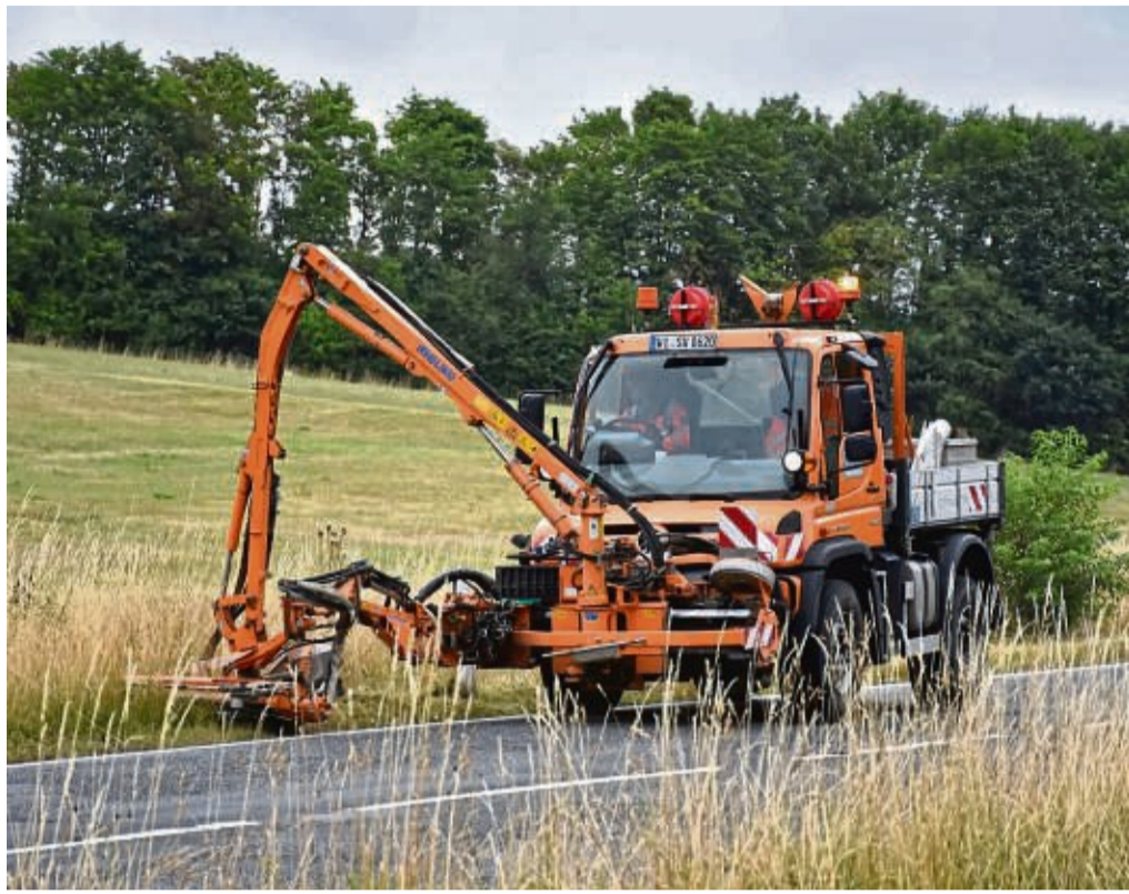
Sind derzeit ein häufiger Anblick im Landkreis: In mit Mäh-ausrüstung ausgestatteten Unimogs sorgen Mitarbeiter von Hessen Mobil für freie Sicht auf den Straßen.

Insbesondere in Einmündungs- und Kurvenbereichen müsse die Sicht für alle Verkehrsteilnehmer stets frei sein. Unterschieden wird dabei zwischen sogenannten Intensiv- und Extensivbereichen. Der Intensivbereich befindet sich unmittelbar neben der Fahrbahn. Der erste Schnitt erfolgt im Zeitraum Mai und Juni, der zweite zwischen August und Oktober. Dabei wird darauf geachtet, dass die zeitlichen Abstände möglichst groß sind. Bereiche, die im Frühsommer als letzte dran waren, kommen im Herbst entsprechend spät an die Reihe. Die wiederkehrende Mahd habe den Neben-