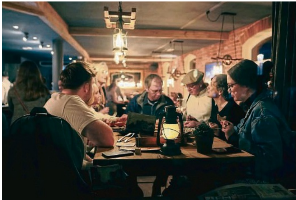
Greift die „goldenen Eisenbahnerjahre“ auf: Das Erlebnis-Wirtshaus Semm's Ecke an der Nürnberger Straße in Bebra ist im Stil der 20er-Jahre gehalten.

Der so hoch Gelobte selbst mag es lieber etwas bescheiden: „Eigentlich müsste der Preis an Bebra gehen und nicht an mich. So etwas klappt nur, wenn sich die Last auf viele Schultern ver-