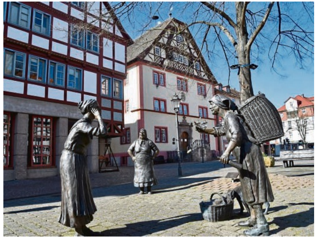
Die Stadt Rotenburg bittet um Vorschläge für Auszeichnungen.