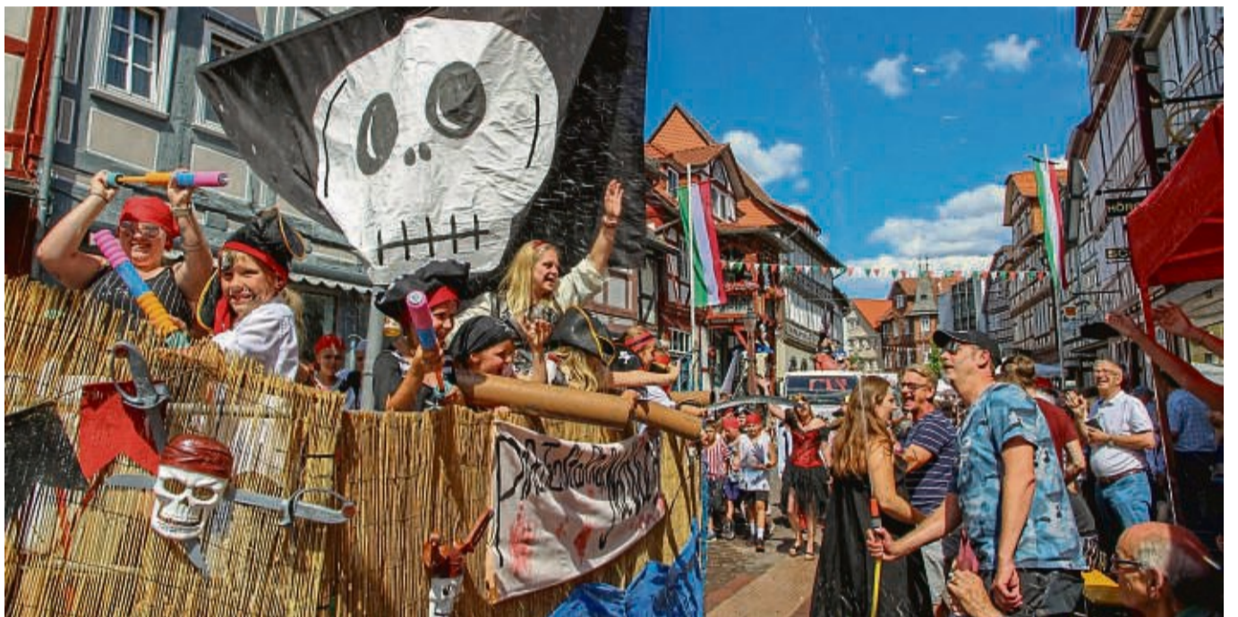
Beim Festzug sind in der Regel rund 50 Teilnehmer dabei. Dafür fehlen dieses Jahr noch ein paar Anmeldungen. Unser Foto vom Vorjahr zeigt den Handball-Nachwuchs der TG Rotenburg.