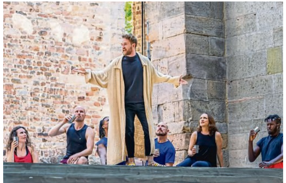
Bei der HZ-Matinee gab es erste Einblicke in die bald startende Festspielsaison. Hier wird eine Szene aus „Jesus Christ Superstar“ gezeigt.