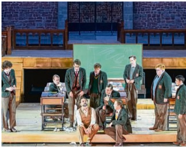
„Der Club der toten Dichter“ wird zum dritten Mal in Folge in der Stiftsruine aufgeführt.

Von „Jesus Christ Superstar“ bis hin zu „Das kleine Gespenst“