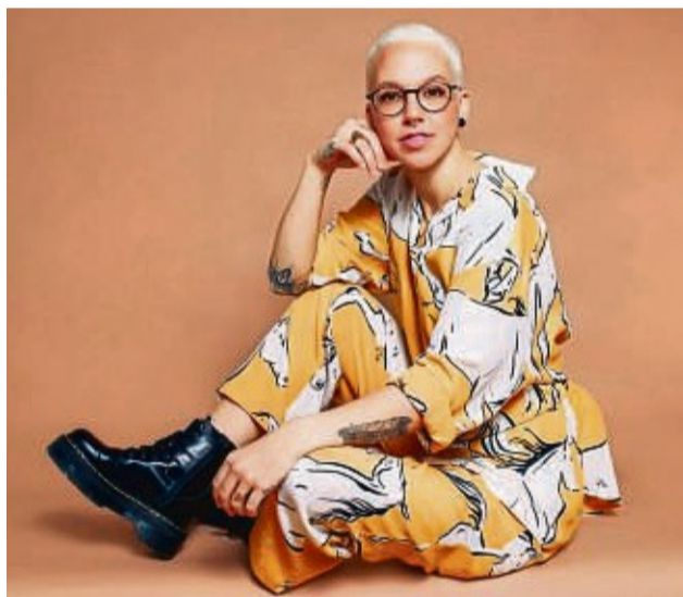
Stefanie Heinzmann steht am 31. Juli in der Stiftsruine auf der Bühne.