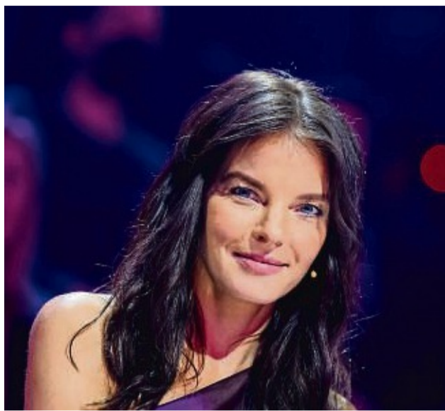
Yvonne Catterfeld tritt am 17. August in Bad Hersfeld auf.