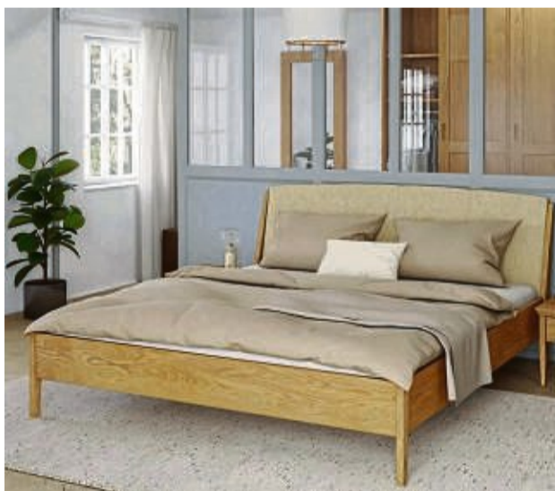
Betten und andere Möbel aus beispielsweise Eichenholz sind eine Augenweide in der Wohnung.

Manche Menschen befürchten, dass eine Bettkonstruktion aus Metall aufgrund elektromagnetischer Störfelder den erholsamen Schlaf behindern könne. Die Alternative sind metallfreie