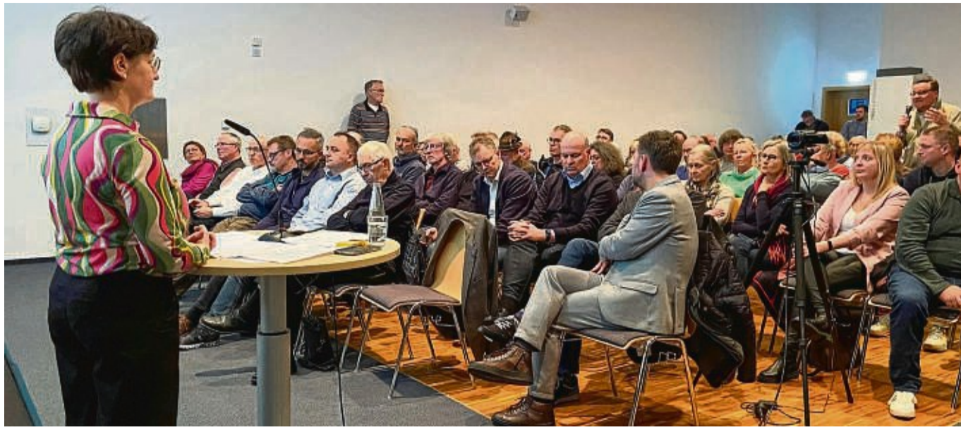
Der Zukunft-Innenstadt-Workshop fand in Bad Hersfeld statt.