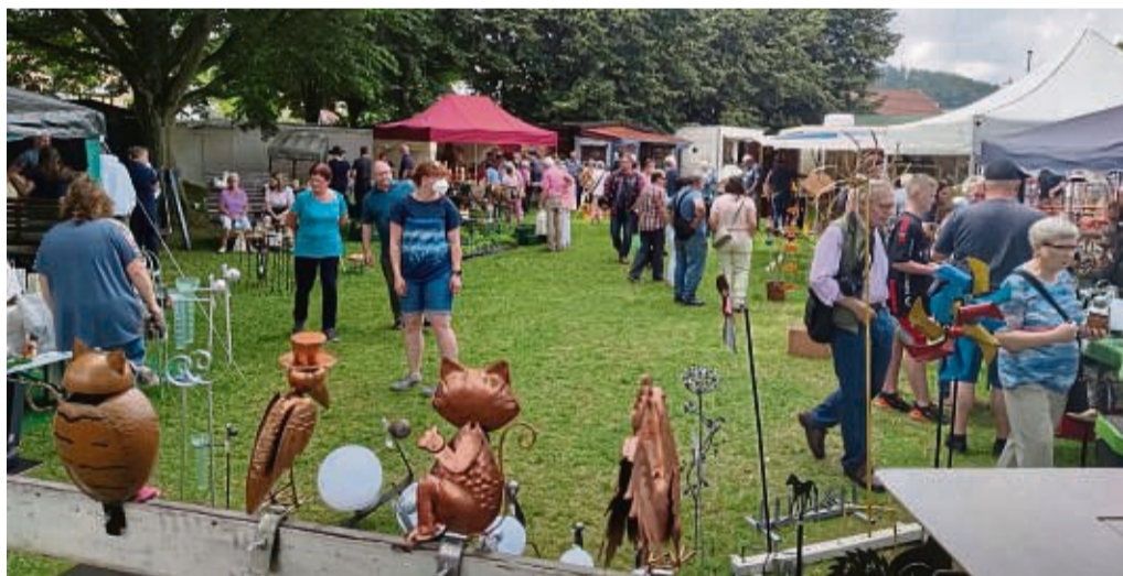
Beim Kuckucksmarkt in Braach gibt es ein großes Angebot an Waren zu entdecken.