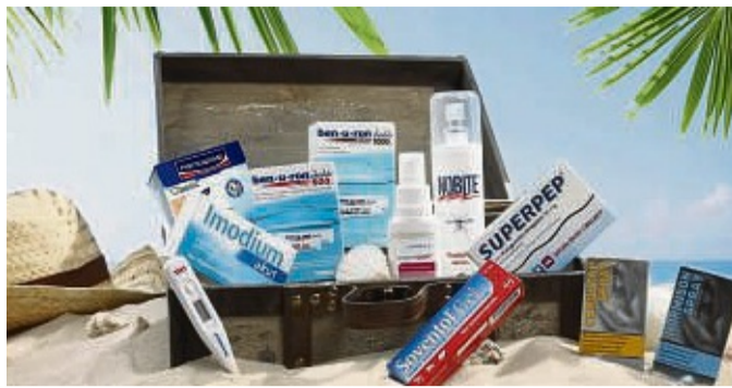
Eine Basisausrüstung an Medikamenten ist besonders bei Reisen mit Kindern wichtig.