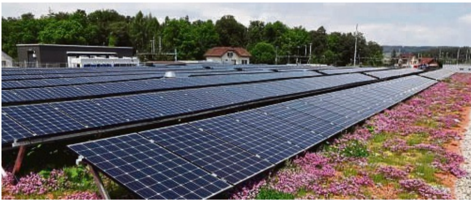
Die Gewinnung von Solarstrom oder eine umwelt- und klimafreundliche Bepflanzung: Viele Dachflächen lassen sich in Nutzdächer verwandeln.

Insbesondere Flachdächer bieten sich für eine Begrünung an. Das wertet das Eigenheim nicht nur optisch auf, sondern ist auch in ökologischer Hinsicht ein Gewinn. Die Möglichkeiten