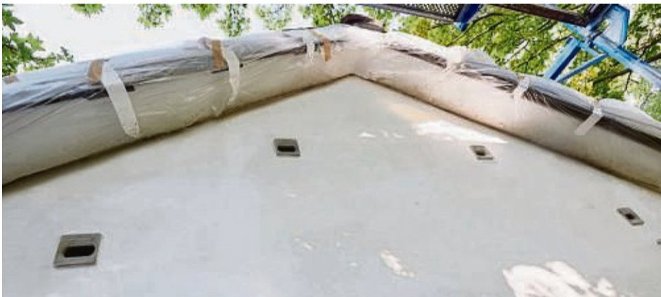
Spezielle Nistkastensysteme für die Fassade bringen Naturschutz und bauliche Anforderungen auf einen gemeinsamen Nenner.

Dichte Bebauung und zunehmende Flächenversiegelung, Klimaveränderungen und andere Umweltfaktoren haben direkten Einfluss auf die Artenvielfalt. Vor allem die heimische Vogelwelt ist in ihrem Bestand bedroht: 43 Prozent der 259 in Deutschland brütenden Arten gelten laut „Roter Liste“ des Naturschutzbundes Deutschland (NABU) als gefährdet.