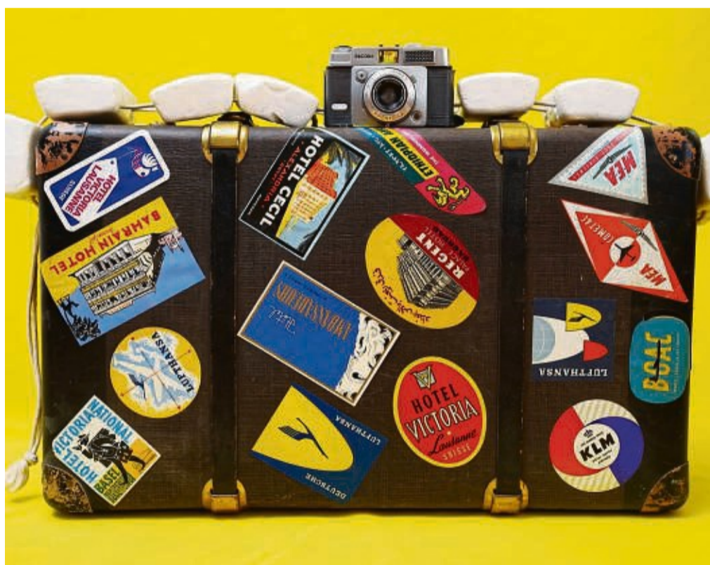
So mancher möchte jetzt gern seinen Koffer packen: Doch für Kurzschnäpper gibt es kaum noch preiswerte Angebote. Reisebüros empfehlen deshalb, rechtzeitig zu buchen.