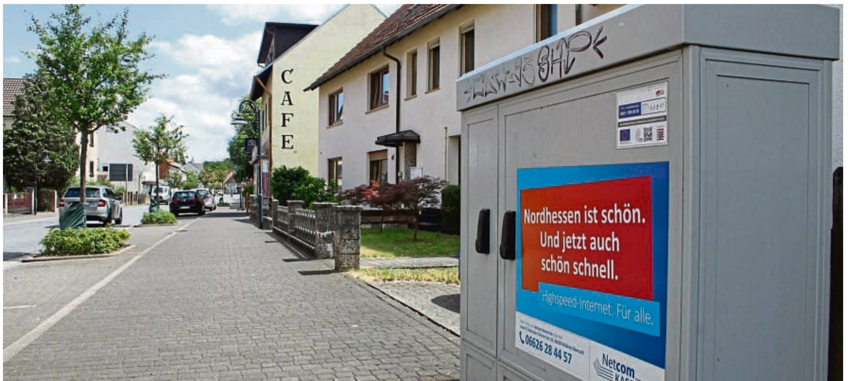
Glasfaserkasten in der Gemeinde Wildeck-Obersuhl: Die Firma Netcom Kassel hat im Wildecker Gemeindegebiet Infrastruktur für das Internet aufgebaut und wirbt auf ihrem Kasten für eine schnelle Verbindung.

„Die Firma GlasfaserPlus drängt darauf, dass ich einen Vertrag mit ihr unterschreibe und tut in Veröffentlichungen schon so, als ob eine Zusammenarbeit zustande kommt. Die will sich aber die Rosinen rauspicken und nur in Obersuhl für schnelles Internet sorgen. Das nützt mir nichts“, schimpft der Bürgermeister. „Die Firma UGG will dagegen in jedem unserer Ortsteile schnelles Internet über Glasfaser anbieten. Deshalb bin ich dafür, dass die UGG bei uns zum Zuge kommt.“