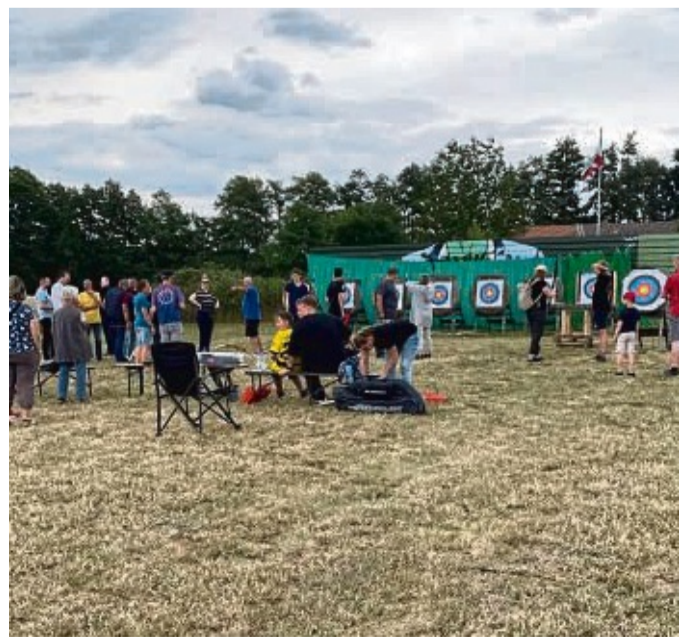
Spiel und Spaß bei den Rotenburger Bounty Bows: Die Besucher bekamen beim Tag der offenen Tür auch spannende Einblicke in die Welt des Bogensports.