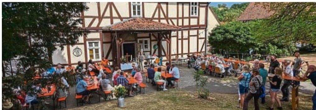
Ran ans Brot: Die gut besuchte Einweihungsveranstaltung des Backhauses in Seifertshausen.

Mit der Hilfe einiger engagierter Mitbürger und Geschäftsleute und dank finanzieller Unterstützungen durch das Förderprogramm „Starkes Dorf – wir machen