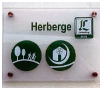
Unterkunft für Pilger: Am Lutherweg gibt es inzwischen eine Herberge.

Im laufenden Jahr sind wieder mehr Pilger anzutreffen, so auch größere Gruppen aus Schleswig-Holstein und Unterfranken. Auf dem Teilstück von Friedewald nach Bad Hersfeld bietet sich die direkt am Weg liegende Kathuser Pilgerkirche für eine Mittagspause an. In der tagsüber offenen Kirche kann man sich über Kathus und das Kirchspiel Petersberg informieren, einen Pilgerstempel erhalten, sich ins Gästebuch eintragen, eine Kerze anzünden, aber auch die Toilette nutzen und seinen Wasservorrat am Pilgerbrunnen auffüllen.