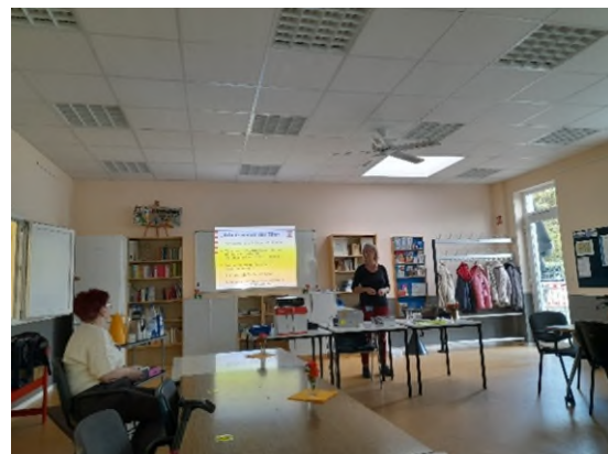
Austausch über den "Enkeltrick"-Vortrag.

Das Thema wird weiter aufgegriffen. Im Jahr 2023 geplant: Selbstverteidigung für Senioren.