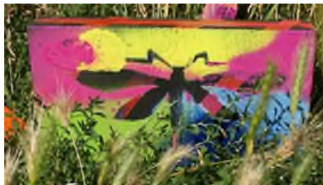
Ergebnis aus einem Kreativworkshop und Ankündigungsplakat.

Öffentlichkeitsarbeit: Plakat, Pressemeldung, Direktsprache.