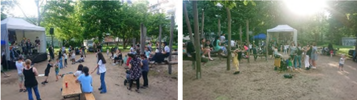
Eindrücke vom Senefelderquartier-Fest.

Verantwortlich: Quartiersmanagement. Weitere Beteiligte: RTSI, im Quartier aktive Gruppen, Vereine und Initiativen.