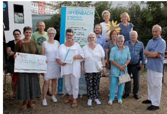
Preisträgerinnen und Preisträger des Klima- und Umweltschutzpreises mit Bürgermeisterin.

Wir haben den Klima- und Umweltpreis der Stadt Offenbach gewonnen, das Preisgeld soll im nächsten Jahr (2023) für den Bau von Vogeltränken verwendet werden. Hierzu gibt es schon Ideen. Pressebericht (Foto Offenbach Post) erfolgte, auch auf Social Media (Facebook). Weitere Aktionen wurden für die Mitmachwerkstatt geplant.