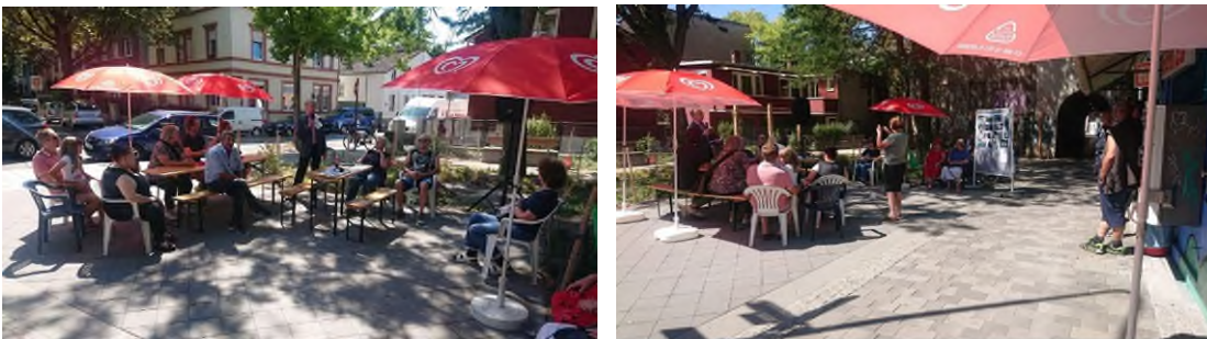
Umgestaltung Kurze Straße.

Instrumente und Methoden: häufige Präsenz / Termine vor Ort, Projektentwicklung mit weitreichender Vernetzung, Organisation und Materialbeschaffung, Öffentlichkeitsarbeit.