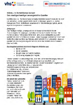
Ankündigungen für die Sprachangebote.