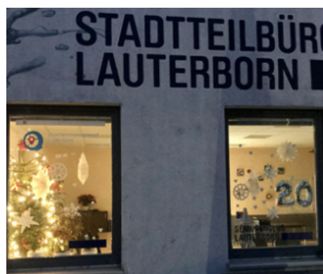
Adventsfenster im Stadtteilbüro Lauterborn.

Quartiersmanagement mit Eltern-Kind-Gruppe „Kreative Kinder“ und Freiwilligenzentrum Offenbach, beworben durch Social Media (Facebook) und Internetseite des Freiwilligenzentrums Offenbach. Der weitergegebene Leuchtkasten wird bei der Beleuchtung des Fensters eingeschaltet, um das Engagement des Stadtteilbüros „sichtbar“ zu machen. Es werden heiße Getränke und Plätzchen angeboten, es gibt Gelegenheit zum Gespräch mit dem Quartiersmanagement und dem Freiwilligenzentrum, vertreten durch Frau Jacob. Die Bastelarbeiten der Kinder können bewundert werden.