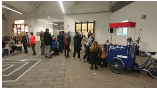
Parkhaus und Rolandpassage.