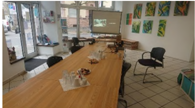
Sitzungsraum des Stadtteilbüros Südliche Innenstadt/Senefelderquartier.

Instrumente und Methoden: Einladung, Vorbereitung, Protokollierung, Moderation der Sitzungen.