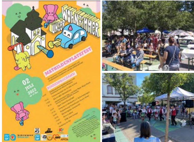
Plakat und Impressionen vom Mathildenplatzfest.

Nach der kurzfristigen Absage der Festplanungen 2021, waren alle Teilnehmenden in diesem Jahr sehr euphorisch und voller Einsatzbereitschaft. Das Mathildenplatzfest konnte erfolgreich durchgeführt werden. Die Resonanz der Besuchenden (schätzungsweise 500 Besuchende im Verlauf des Veranstaltungszeitraums) war sehr positiv. Auch die Standbetreiber sowie die Künstlerinnen und Künstler gaben positives Feedback. Eine erneute Durchführung und Teilnahme im nächsten Jahr wird gewünscht. Zusätzlich konnten auf diese Weise bestehende Kontakte vertieft sowie neue Kontakte geknüpft werden. Auch am Stand des Quartiersmanagements konnten viele Menschen über die Arbeit und Entwicklungen im Quartier informiert werden.