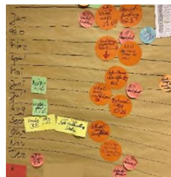
Ergebnisse der Projektaktionen.