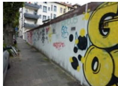
Begrünungs- und Gestaltungspotenzial im Mathildenviertel.