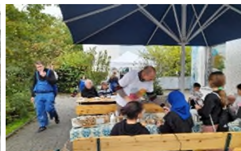
Viele Engagierte bei der Mitmachwerkstatt im Rahmen der "Engagierten Stadt".