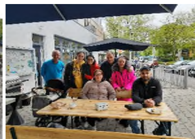
Nachbarschaftstreff vor dem Stadtteilbüro Lauterborn.