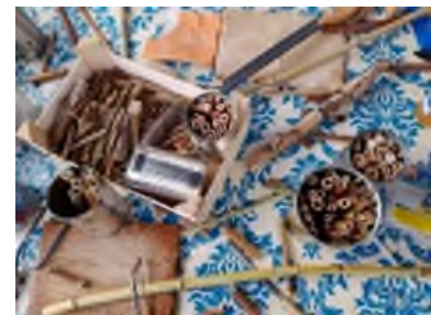
Nistkastenreinigung und Insektennistbau mit dem NABU.

noch Insektennisthilfen aus Konservendosen basteln. Sie wurden mit Bambushalmen gefüllt. Die Aktion wurde beworben durch Plakate, Social Media (Facebook) und Mundpropaganda/Netzwerknutzung der IB-Gruppe ELMO, Pressemitteilung in Offenbach Post.