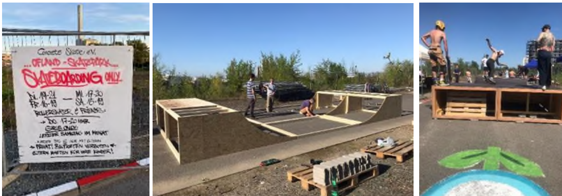
Förderung der Skate-Kultur.

Offenbacher Mitglieder des Vereins „Concrete Skate“ aus Frankfurt wollen die Skate-Kultur in Offenbach stärken und dabei im Hafen ein Angebot machen, das vor allem Jugendlichen aus dem Nordend zu Gute kommt. In Eigeninitiative wurde ein mobiler Skatepark aus Holz gebaut. Das Quartiersmanagement hat bei der Mittelbesorgung, mit dem Verfügungsfonds und bei Veranstaltungen mit Equipment unterstützt.