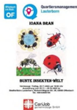
Veranstaltungsplakat "Bunte Insekten-Welt".

Weitere Ausstellungen/ Vernissagen anderer Künstlerinnen und Künstler sind denkbar.