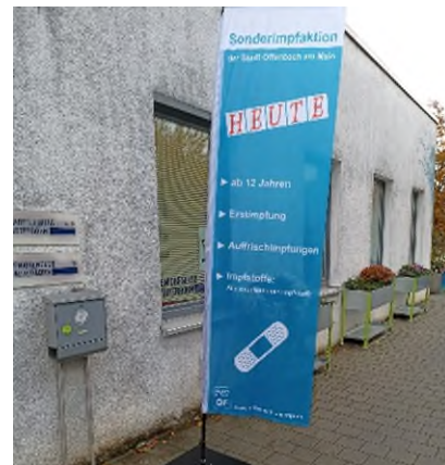
Banner-Impfkation im Stadtteilbüro.

Das Impfangebot wurde im Herbst 2022 wiederholt. Es endete mit der Schließung der Impfzentren und mobilen Impfstationen zum 31.12.2022.