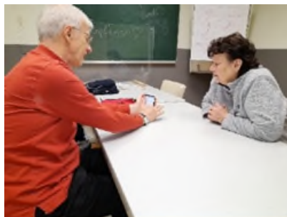
Smartphone-Beratung im Stadtteilbüro.

Das aus dem Seniorenlotsen-Projekt entstandene Angebot „Smartphone-Sprechstunde“ wird sehr gut angenommen. Die allgemeine Rückmeldung der Klienten ist sehr positiv, da das Angebote wieder regelmäßig bzw. nach Terminabsprache im Stadtteilbüro Lauterborn stattfindet. Besonders die gute Erreichbarkeit mit dem ÖPNV sowie die Barrierefreiheit des Stadtteilbüros werden sehr geschätzt. Die Berater sind selbst im Rentenalter und somit auf Augenhöhe mit den Ratsuchenden, dies wird auch besonders gut angenommen. Die über Wochen ausgebuchten Sprechstunden sprechen für sich. Öffentlichkeitsarbeit erfolgt über Social Media (Facebook und Instagram), Plakataushänge, Hinweis im Schaukasten des Stadtteilbüros Lauterborn und Pressemeldungen und auf der Internetseite der Stadt Offenbach und Caritasverband Offenbach sowie über Mundpropaganda zufriedener Nutzerinnen und Nutzer. Unser Berater ist auch in unterstützender Funktion für ein bei der Stadt Offenbach verortetes Digitalisierungsprojekt tätig, der andere in Heusenstamm für ein städtisches Beratungsangebot.