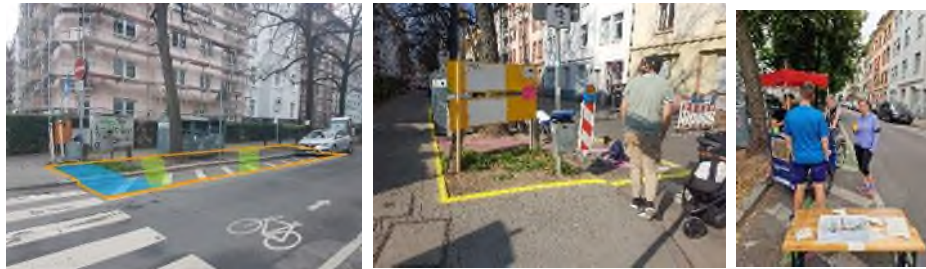
Fläche des Miniparks Ludwigstraße, Offenes Brett und Vor-Ort-Aktion.