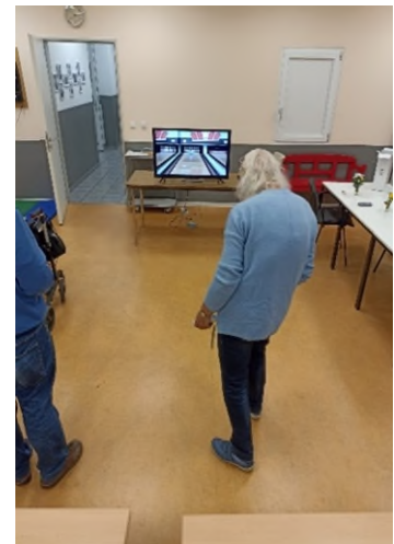
Spiel mit der Wii-Konsole.

Eine regelmäßige Teilnahme wurde erreicht, die Gruppengröße schwankt zwischen vier und sechs Teilnehmenden. Die Organisation wird durch einen ehrenamtlichen Mitarbeiter gewährleistet, es gibt kleine Snacks und Getränke. Die Spielerinnen und Spieler sind mit Eifer bei der Sache und haben viel Spaß mit den modernen Spielformen. Bekanntmachung durch das Monatsprogramm des Seniorenclubs, Aushänge und Mundpropaganda sowie Social Media (Facebook) und Pressemeldung und Internetauftritt Stadt Offenbach. Im Frühjahr 2023 wird der Spieleabend nochmals beworben werden.