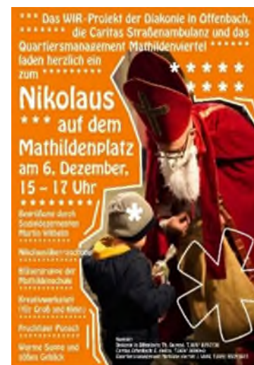
Ankündigungen und Impressionen vom Nikolausfest auf dem Mathildenplatz.

Synergieeffekte: Förderung des sozialen und kulturellen Zusammenhalts sowie der Vernetzung und Kooperationen im Quartier, Förderung der positiven Identifikation mit dem Mathildenplatz, Belebung Mathildenplatz.