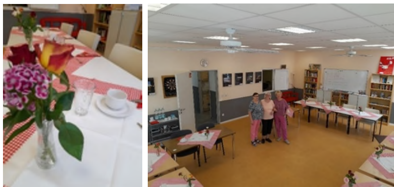
Impressionen aus der Vorbereitung für die Lauterborner Küche.

Alle zur Verfügung stehenden Plätze sind besetzt, die Gäste melden sich regelmäßig an, bzw. ab, wenn sie verhindert sind. Hier werden Kontakte geknüpft, aber hauptsächlich wird die Gesellschaft beim gemeinsamen Essen genossen.