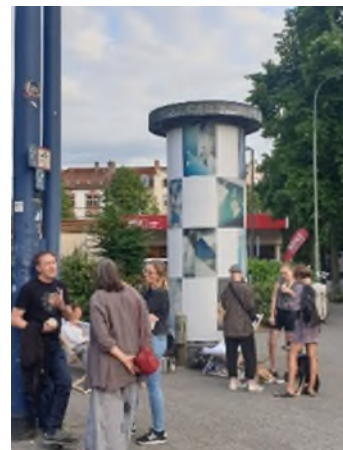
Bouleturnier und Kunst im Quartier.