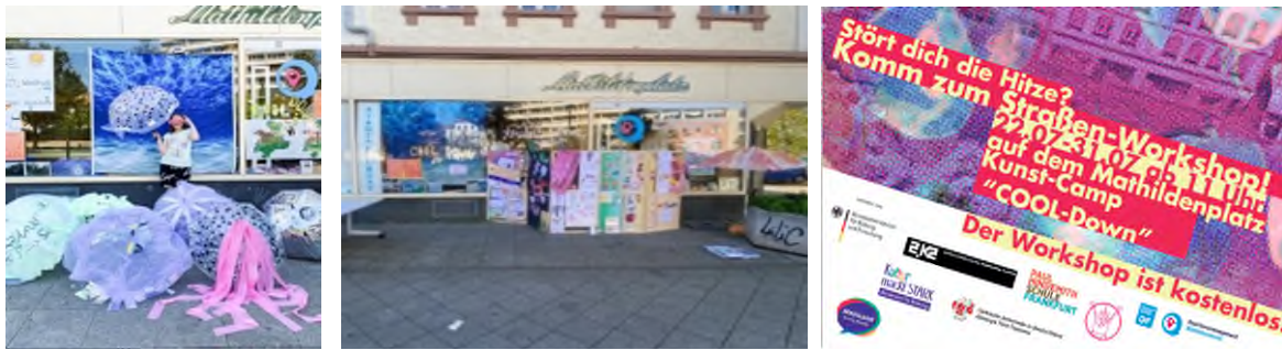
Ergebnisse des Cool-Down-Kunstcamps/Plakatankündigung.

Instrumente und Methoden, Ablauf: Kooperationsvereinbarung Künstlerinnen und Träger (TGD), Konzeptentwicklung mit Künstlerin in Abstimmung mit dem Umweltamt, Bereitstellung von Veranschaulichungs- und Informationsmaterialien des Umweltamts, Klärung Materialbedarf, Terminabstimmungen für die Workshops und Ergebnispräsentation (als Schaufensterausstellung), Teilnehmenden-Akquisition über Runden Tisch Innenstadt, Jugendhilfe an der Mathildenschule, KJK-Sandgasse sowie Direktansprache im nachbarschaftlichen Kontaktnetzwerk, Öffentlichkeitsarbeit, Fotodokumentation.