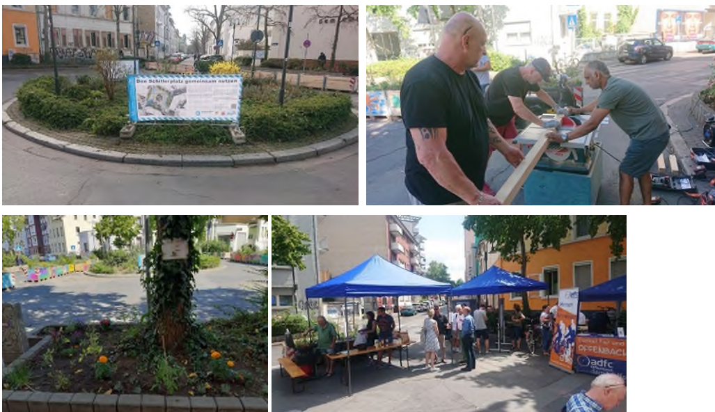
Aktivitäten rund um den Schillerplatz.

Der Mangel an wohnortnahen Freizeitflächen im Bereich der Geleits- und Luisenstraße und die Funktion des Schillerplatzes als Kreuzung zweier Fahrradstraßen, jedoch ohne Aufenthaltsfläche, veranlasste die Verantwortlichen, den Kreisverkehr aufzuheben, einen sogenannten Modalfilter einzurichten und die freiwerdenden Flächen einer nachbarschaftlichen Nutzung zuzuführen. Aufgabe des Quartiersmanagements war und ist es, sämtliche Interventionen vor Ort zu begleiten, zu moderieren und zu unterstützen.