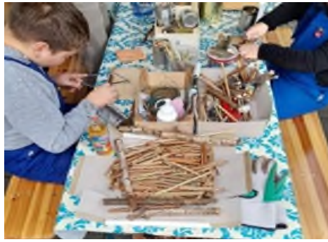
NABU-Aktion auf dem Lauterbornfest. Plakatankündigung Lauterbornfest.

Glücksrad des Caritasverbands erfreute sich großer Beliebtheit. In lockerer Atmosphäre kamen die Menschen ins Gespräch und die Resonanz des Festes war sehr positiv, ebenso das Feedback der Standbetreibenden.