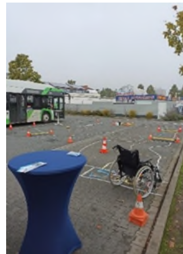
Rollstuhl-Parcours des Quartiersmanagements am Präventionstag.