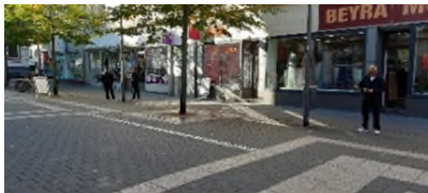
Untere Herrnstraße nun ohne Sitzmöglichkeiten.

Die Situation im MLP erweist sich im Spätsommer als unauffällig. Durch die Erneuerung und Ausweitung der Freizeit- und Sportangebote (Boule und Tischtennis) zeigte sich erhöhte Durchmischung der Klientel. Der Wunsch nach einer öffentlichen Toilette wurde häufig geäußert. An der EHG entstand durch das Verhalten einiger im öffentlichen Raum ein Problem. Daraufhin wurde sowohl mit den Menschen auf der Gasse als auch mit allen Gewerbetreibenden im Umfeld gesprochen. Durch die aufsuchende Arbeit, vermehrte Kontrollen der Stadtpolizei, Demontage der Sitzmöglichkeiten und Schließung eines Dönergrills hat sich die Situation mit dem sich verschlechternden Wetter zum Herbst 2022 hin entspannt.