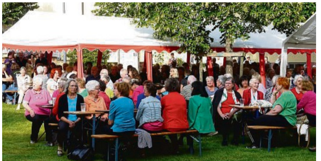
Wunderschönes Ambiente: Das Publikum bei der Schlosshofmusik in Philippsthal war am Sonntagabend von dem Freiluft-Konzert sichtlich angetan.