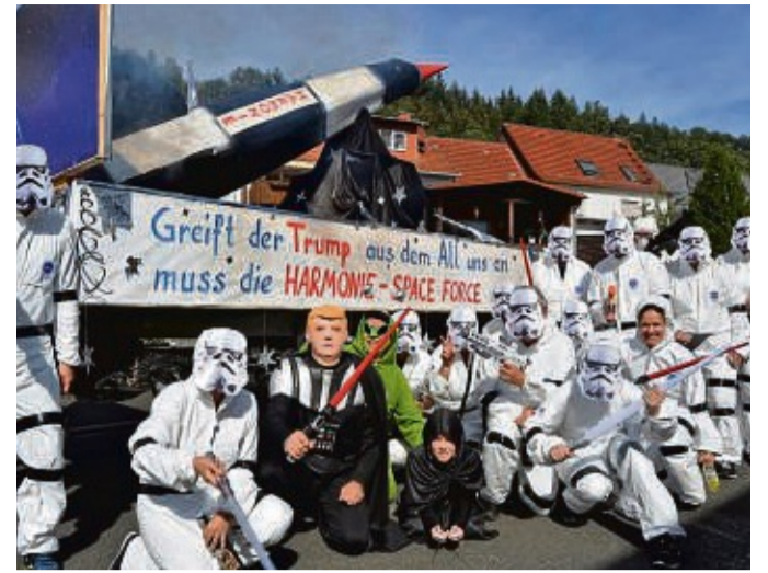
An Fantasie mangelt es nicht beim Kirmes-Festzug in Ronshausen, wie unser Archivbild aus dem Jahr 2018 beweist.