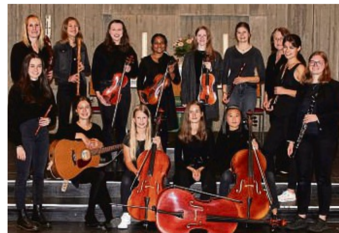
Sie freuen sich auf das Konzert: Das Folk-Ensemble und der Chor Singclusive der Musikschule Schmitt lädt für Samstag in die Auferstehungskirche ein.

Der Eintritt ist frei, um Spenden für den Förderverein der August-Wilhelm-Mende-Schule wird gebeten. zwk