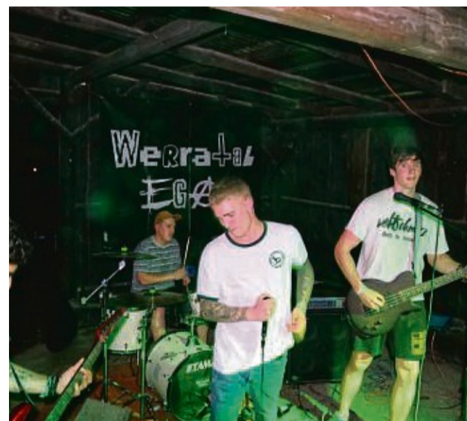
Aus Heringen: Die Punker von „WerratalEgal“ hatten Songs aus ihrem aktuellen Album „Alkohol und Kokolores“ im Gepäck.

red/czi Anmeldung unter mobil 01 71/ 1 90 80 32, Tel. 0 66 23/74 55, E-Mail: conny.haag@arcor.de oder über die Facebook-Seite „Sofa-Concerts für Jedermann“