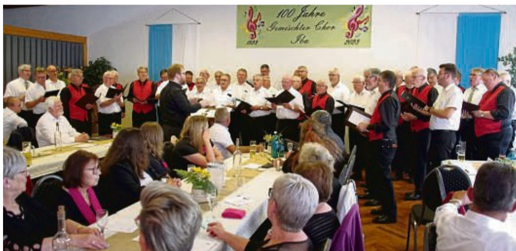
Den Abschluss bildete der Bezirkschor der Männer mit „Ich weiß ein Fass in einem tiefen Keller“ und „Aus der Traube in die Tonne“ sowie das gemeinsam gesungene „Hessenlied“. Mehr Bilder unter hna.de/rotenburg