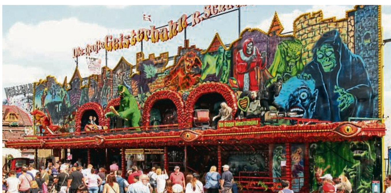
Die Geisterbahn ist nichts für schwache Nerven, denn in den dunklen Räumen warten „lebende Dämonen“ auf die Besucher des Lullusfestes.