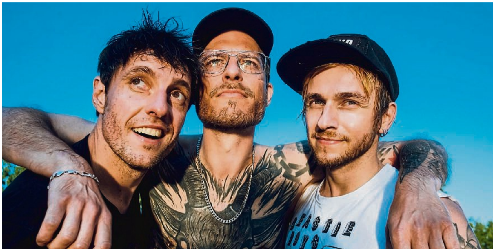
Itchy sind in Odensachsen dabei: Die Musiker nannten sich noch bis vor einigen Jahren Itchy Poopzkid.