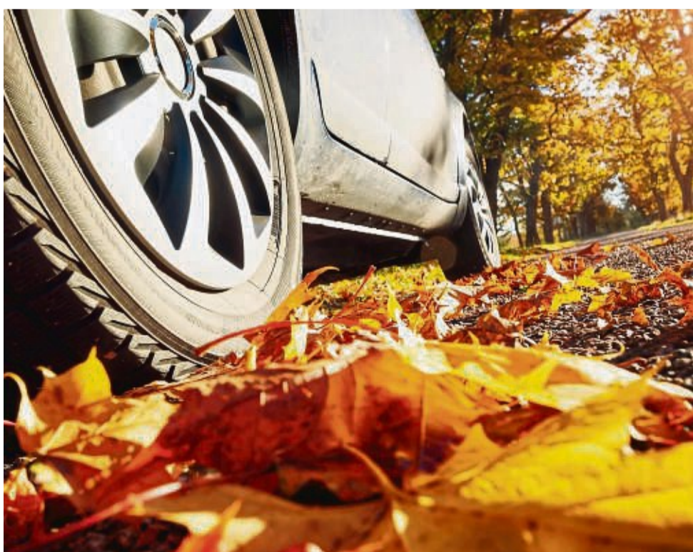
Wenn im Herbst die Fahrbahnen mit Feuchtigkeit und Laub rutschig werden, müssen Reifen, Wischerblätter und Beleuchtung top in Schuss sein.

Beim Reifenwechsel kann die Werkstatt den Zustand der Winterreifen prüfen: Liegt das Restprofil noch bei mindestens drei Millimetern? Sind die Pneus schadenfrei? Gerade im Herbst und Winter auf Fahrbahnen mit Nässe, Raureif oder Eis ist ein perfekter Zustand besonders wichtig. djd