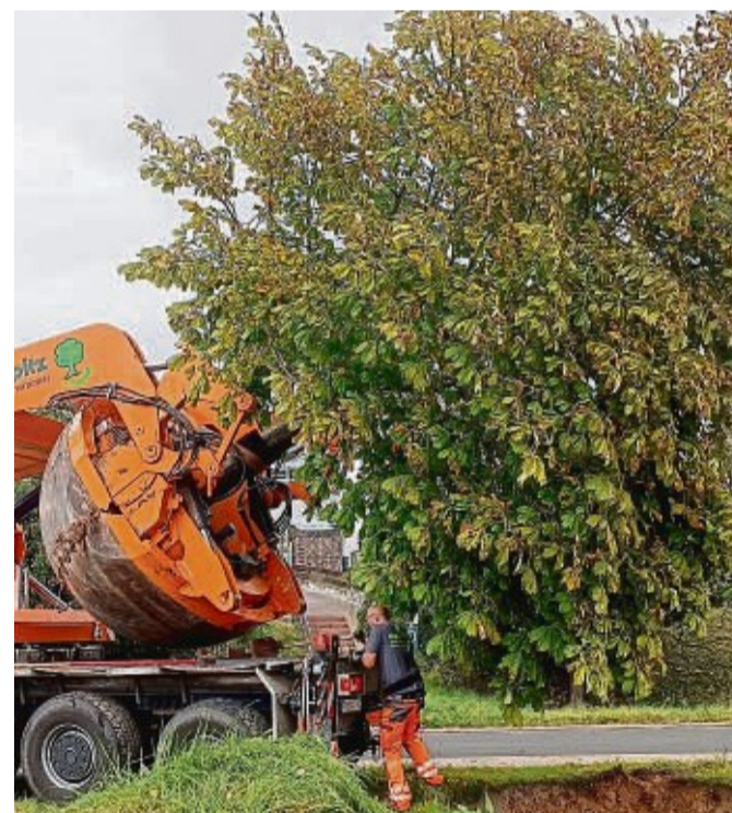
Bei der erfolgreichen Großbaumverpflanzung von Lispenhausen nach Rotenburg kam schweres Gerät aus Bayern zum Einsatz.