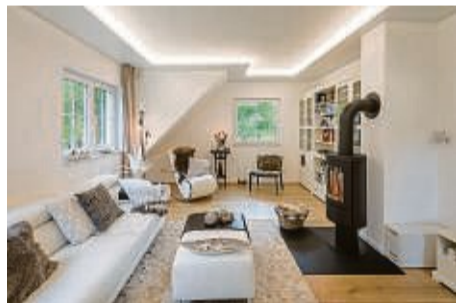
Mit Licht dein Wohnzimmer verzaubern

LED-Beleuchtung: Die Decken sind so vielseitig, dass du sie harmonisch jedem Wohnstil anpassen kannst. Wohn-, Schlaf- und Esszimmer sowie Küche, Flur und Bad erhalten damit schnell ein neues Gesicht. Montiert werden sie einfach unterhalb