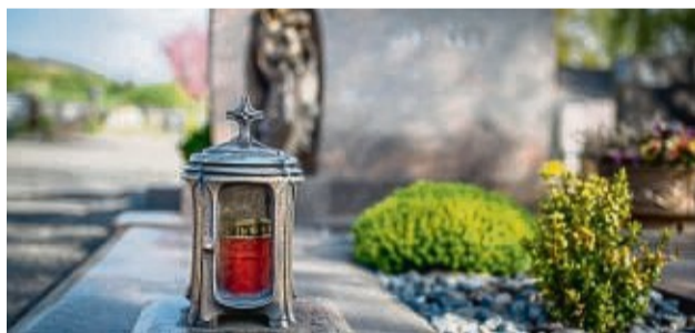
Gräber können individuell an die Verstorbenen erinnern.

Ort des Erinnerens auf den oder die Verstorbenen anpassen