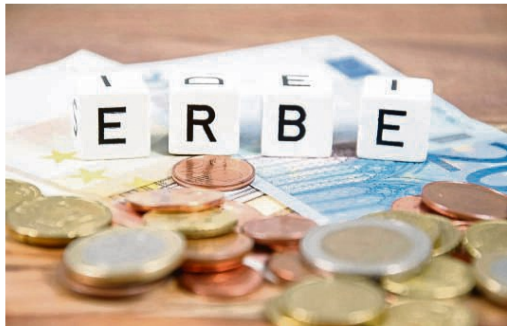
Worauf muss ich beim Verfassen meines Testaments achten? Dieser und weiteren Fragen widmen sich die Referenten in ihrem Vortrag.