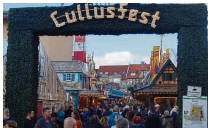
Das Lullusfest und der verkaufsoffene Sonntag sind gleich zwei gute Gründe, um zum Wochenende nach Bad Hersfeld zu kommen.