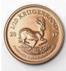
Auch Goldmünzen gibt es zu gewinnen.