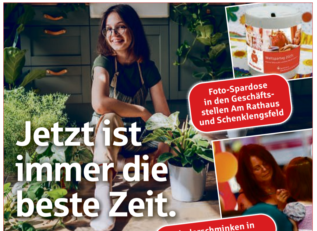
Foto-Spardose in den Geschäftsstellen Am Rathaus und Schenklingfeld