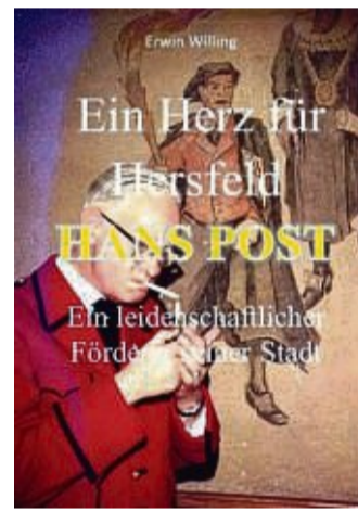
Ein Herz für Hersfeld: So sieht das Buch aus.