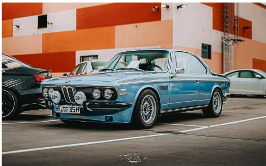
Autoausstellung auf dem Parkdeck des Rotenburg Centers: Das absolute Highlight-Fahrzeug war ein BMW 3.0 CS Alpina B2.