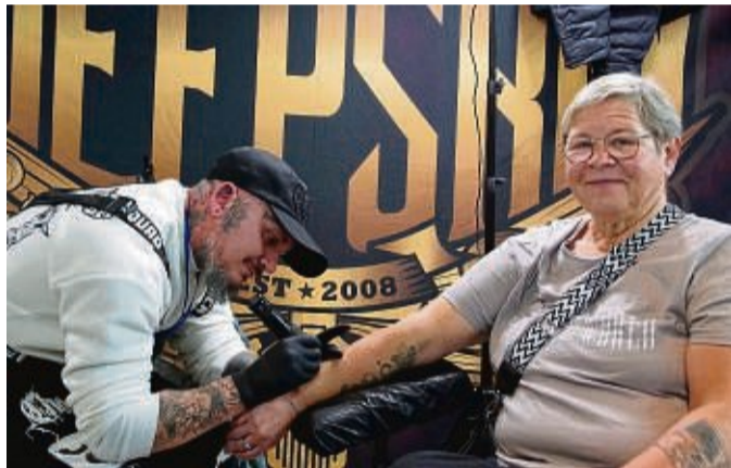
Modeerscheinung Tattoo? Alle Altersklassen begeistern sich für den permanenten Körperschmuck. Weitere Fotos finden Sie unter hersfelder-zeitung.de