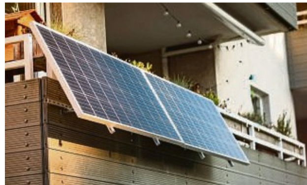
Die Sparkasse verlost ein Balkonkraftwerk zur eigenen Stromgewinnung!

Sparkasse Bad Hersfeld-Rotenburg Marketing und Werbung Dudenstraße 15 36251 Bad Hersfeld