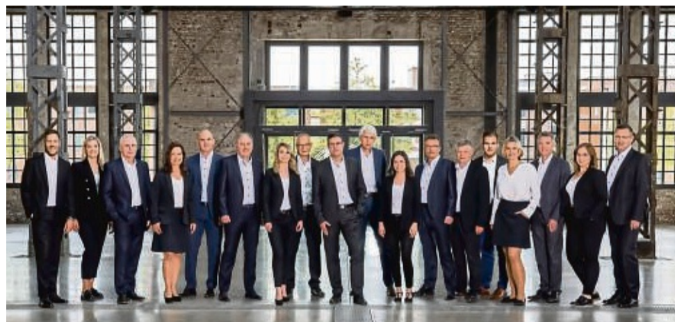
Die Firmenkunden- und Gewerbekundenberaterinnen und Berater der Sparkasse beraten gerne persönlich, online oder vor Ort.

Am besten, Sie vereinbaren zeitnah einen Beratungstermin in der Sparkasse.