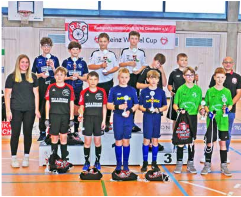
Siegerehrung der U13