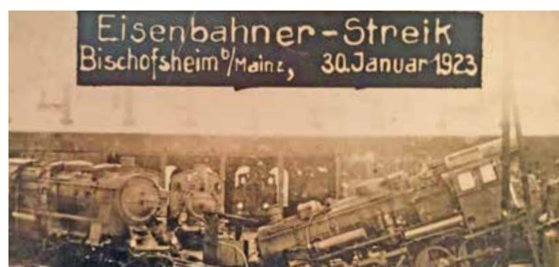
Eisenbahnerstreik 1923. Passiver Widerstand am Rundlokschuppen in Bischofsheim

Die Erinnerung an den „Passiven Widerstand“ ist also eher eine ambivalente Angelegenheit. Schuld und Sühne sind die eine Seite der Geschichte, der Wunsch nach Freiheit und Wohlstand eine andere. So erklärt sich sicherlich auch ein Dokument aus offensichtlich besseren Zeiten: 11 Männer im Anzug mit Schlips und Schnorres und der Bildunterschrift: