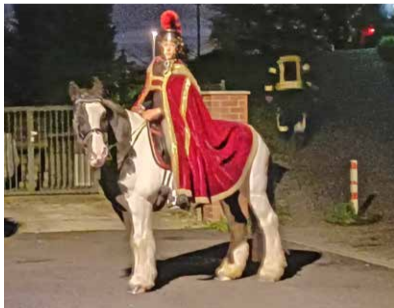
St. Martin 2022 in Gustavsburg

St. Martin-Team Mainspitze/Alexandra Ries – Am Samstag, 11. November, um 18 Uhr sind in Bischofsheim alle Kinder und Familien mit ihren Laternen zu einer Andacht mit Martinsspiel in die Katholische Kirche Christkönig eingeladen. Direkt im Anschluss findet der Laternenumzug zur Evangelischen Kirche statt. Dort werden Martinsweck geteilt sowie Glühwein und Kinderpunsch angeboten. Der Evangelische Posaunenchor wird die Veranstaltung mit Martinsliedern begleiten.