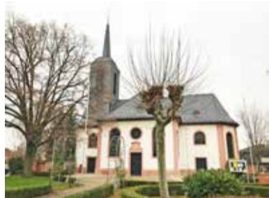
Evangelische Kirchengemeinde Ginsheim