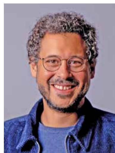
rael und Palästina.

Die Grundanliegen der Reformation prägen die evangelischen Kirchen bis heute: Die Botschaft soll immer verständlich sein. In Luthers Worten ausgedrückt: Die Predigenden müssen „dem Volk aufs Maul schauen“. Das bedeutet aber nicht, den Menschen nach dem Mund zu reden, sondern vielmehr die aktuellen gesellschaftlichen Themen im Blick zu haben. Damit sind wir auch schon bei einem weiteren Kernanliegen der Reformation: Bildung. In der Kirche sollte alles verständlich sein, damit sich jeder einzelne Mensch fortbilden kann und so den Weg für eine mündige Religionspraxis geebnet wird. Am Reformationstag soll auch nicht verschwiegen werden, dass diese Grundanliegen zu äußerst blutigen Umwälzungen in Politik, Wirtschaft und Kultur geführt haben. Mit dem Blick auf die gegenwärtige Lage im Nahen Osten beten wir an diesem Reformationstag für Frieden in Is-