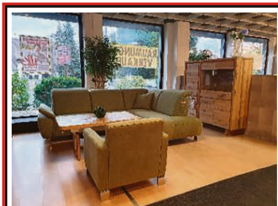
Hochwertige Eckgarnitur mit Sessel mit Kopf- und Armlehnenfunktion

Z.B. PALOMA Eckgarnitur Farbe olivgrün früher € 4.051,00 jetzt € 1.985,00 Abholpreis