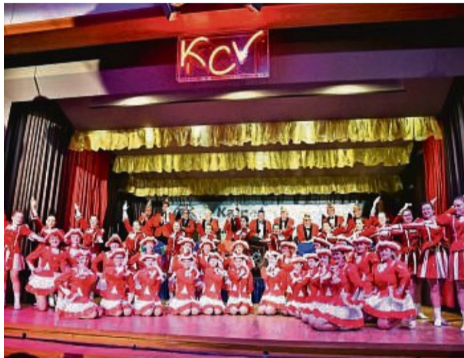
Erste Prunksitzung in Ronshausen: Narren feierten im Februar diesen Jahres ihren Karneval.

Weitere Infos und alle Termine gibt es auch auf der Website kcv.digital und über die Social Media Kanäle (Facebook: Kultur- und Carnevalverein e.V. Ronshausen und Instagram: kcv_ronshausen ) des Vereins.