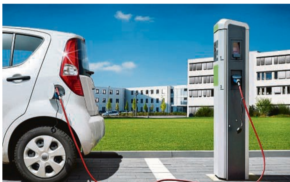
Fahrtipps sinnvoll nutzen: Während die Familie eine Rast einlegt oder Pendler zur Arbeit gehen, erhält das Elektroauto frische Energie.

Ein Tipp für das Laden unterwegs: Wer mit einem modernen E-Auto auf DC-Ladesäulen mit hoher Ladeleistung setzt, spendiert