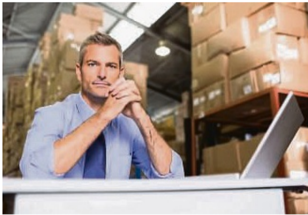
Ältere Bewerber heben sich durch Berufserfahrung, Verantwortungsbewusstsein, Mentoring-Kompetenzen und mehr ab.