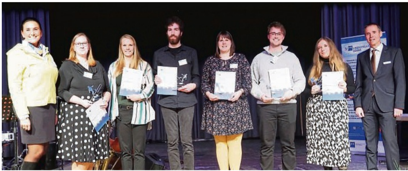
Die IHK zeichnete Spitzen-Azubis der Sommerprüfungen in Sontra aus, hier die Besten aus dem Werra-Meißner-Kreis.