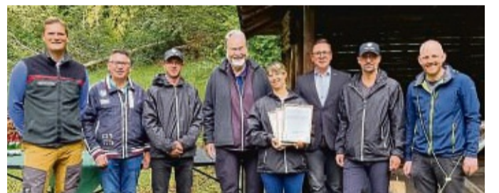
Große Freude über die Zertifizierung herrschte bei der Einweihung der Premium-Wanderwege in Rotenburg.

Die Zertifizierung ist für drei Jahre gültig. Im Mai 2026 werden die Wanderwege erneut auf ihre Tauglichkeit als Premiumwanderweg und als Premiumspazierwanderwege geprüft, informiert die Marketinggesellschaft Rotenburg. red/tek