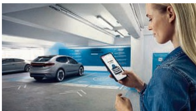
Ein- und ausparken per App: Software und Vernetzung ermöglichen viele neue Funktionen fürs Auto.

Ein Beispiel dafür: Statt in der Innenstadt lange und mühsam nach einer Parkmöglichkeit zu suchen, kann das Software-definierte Automobil von morgen den