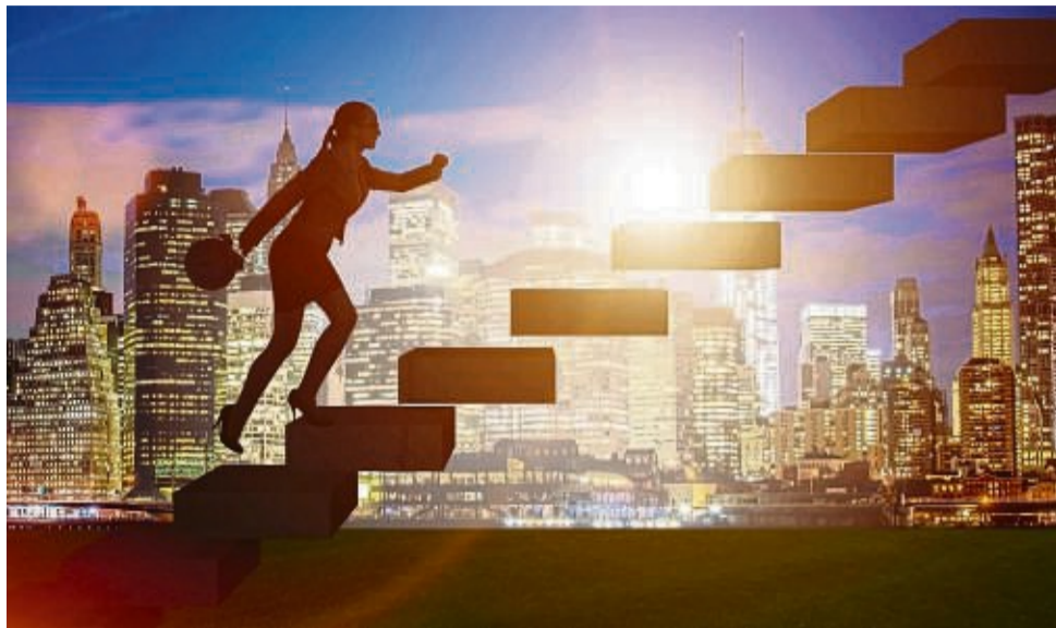
Quereinsteiger haben aufgrund der aktuellen Berufswelt gute Aufstiegschancen in Unternehmen, die Fachkräfte suchen.

Auch jüngere Arbeitnehmende profitieren von den erweiterten Recruiting-Strategien: Lange war der Druck auf junge Talente enorm,