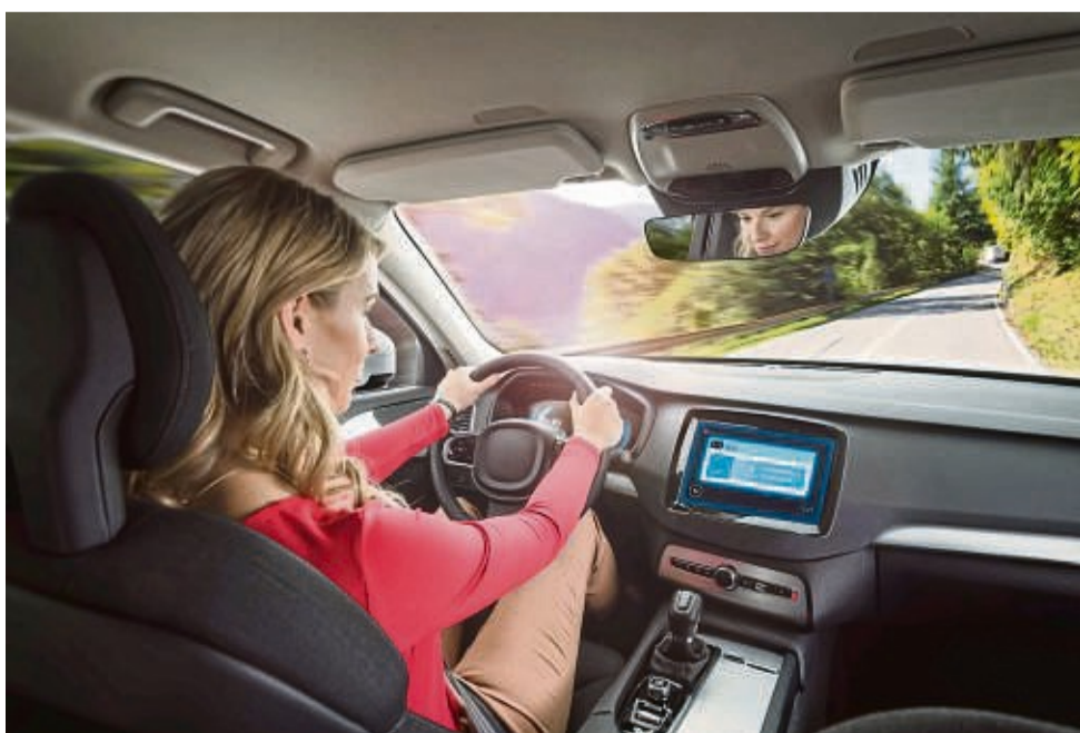
Moderne Software-Systeme und vielfältige Anwendungen machen aus dem Auto einen Computer auf vier Rädern.