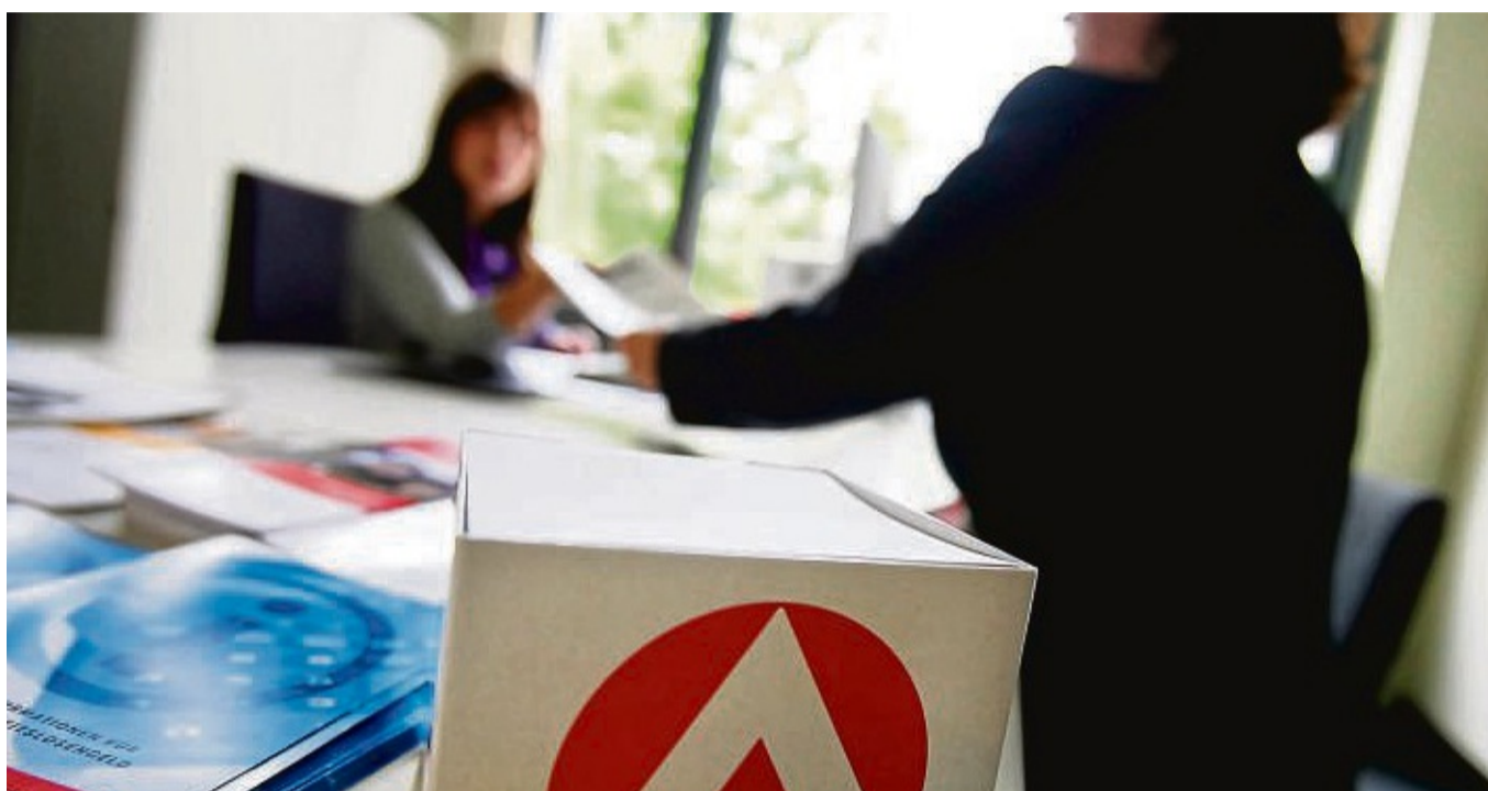
Der Anstieg der Arbeitslosigkeit im Vergleich zum Vorjahr betrifft in Waldhessen insbesondere die Städte Bebra und Bad Hersfeld und mit Abstrichen Rotenburg.