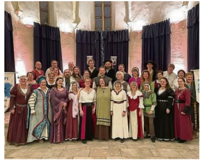
Historische Gewänder im historischen Gemäuer des Kosters Cornberg: Die Rotenburger Gruppe „Saltare in Luna Noctis“ hatte zum Workshop eingeladen.