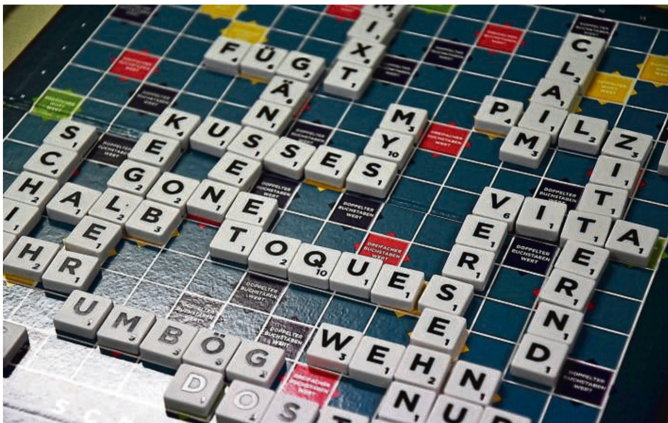
Scrabble ist ein Klassiker , bei dem es auf Köpfchen und Wörter ankommt und bei dem jedes Wort zählt – ganz besonders natürlich im Finale, bei dem dieses Foto entstand.

Beim 1948 erfundenen Scrabble-Spiel ist das ja so eine Sache. Einerseits muss man Glück haben und gut legbare sowie möglichst viele Punkte einbringende Buchstabensteine aus einem Säckchen ziehen. Andererseits muss man bildbare Worte irgend wann aber auch so legen können, dass sie auf das Scrabble-Brett passen, das sich im Laufe des Spiels zu einem wahren Kreuzworträtsel-Gebilde entwickelt. Nach dem geltenden Regelwerk sind nicht nur Grundformen, sondern alle denkbaren