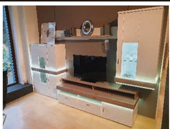
Hochwertige Wohnwand Ausf. Weiss mit Beleuchtung

Die zehn Jahre jüngere Titelverteidigerin kann nicht mehr mithalten, denn das Säckchen mit den Steinen ist leer. Beide reichen sich die Hand und nach diversen Gratulationen erklärt die in sich ruhende Gewinnerin dem unerfahrenen Beobachter: „Man muss sich immer auch in die Situation des Gegners versetzen und einen Plan A und einen Plan B haben. Wenn mir das nicht gelingt, bin ich irritiert.“