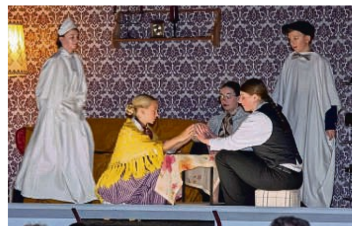
Geisterbeschwörung: Der Blick in die Glaskugel soll zur Aufklärung verschiedener Mordfälle beitragen. Die Mansbacher „Jugendbühne“ inszenierte die Kriminalkomödie „Mörder mögen´s messerscharf“. Weitere Fotos unter hersfelder-zeitung.de

Denn das Publikum verfolgte stets aufmerksam die mit Spannung sowie Humor