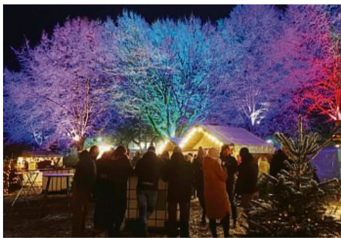
Stets stimmungsvoll: Der Wintermarkt in Braach.

Braach – Am ersten Adventswochenende, am Samstag, 3. Dezember und Sonntag, 4. Dezember, veranstaltet der Kuckucksmarkt e.V. Braach wieder eine Winter-Edition des beliebten Kuckucksmarktes. Die Gäste erwarten viele weihnachtlich dekorierte Stände. Und mit dem Einsetzen der Dämmerung werden die Bäume auf dem Gelände bunt angestrahlt und sorgen für ein ganz besonderes Flair.