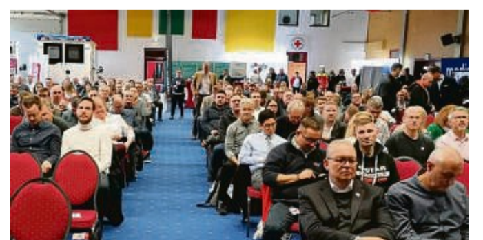
Rund 400 Teilnehmer befassten sich beim 20. Rettungsdienstsymposium in Hohenroda mit der Zukunft der Hilfsstrukturen.

Durch Fachkräftemangel, Überalterung der Gesellschaft und der Arztstruktur, mehr Teilzeitstellen und weil ein großer Teil der Mediziner es ablehne, in ländlichen Strukturen zu arbeiten, könnten künftig ein Drittel der Stellen nicht mehr besetzt werden. Wichtig sei daher die Stärkung der ländlichen ambulanten Versorgungsstrukturen inklusive Fachärzten. Nach 20 Jahren kehrt das Rettungsdienstsymposium Hohenroda den Rücken: Die nächste Auflage findet am 21. und 22. November 2024 in Kassel statt.