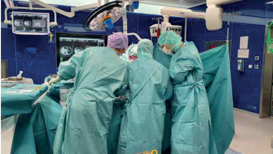
Während Operateure bei OPs schwitzen, frieren Pflegepersonal und Patienten häufig. Kühlkleidung soll dies ändern.