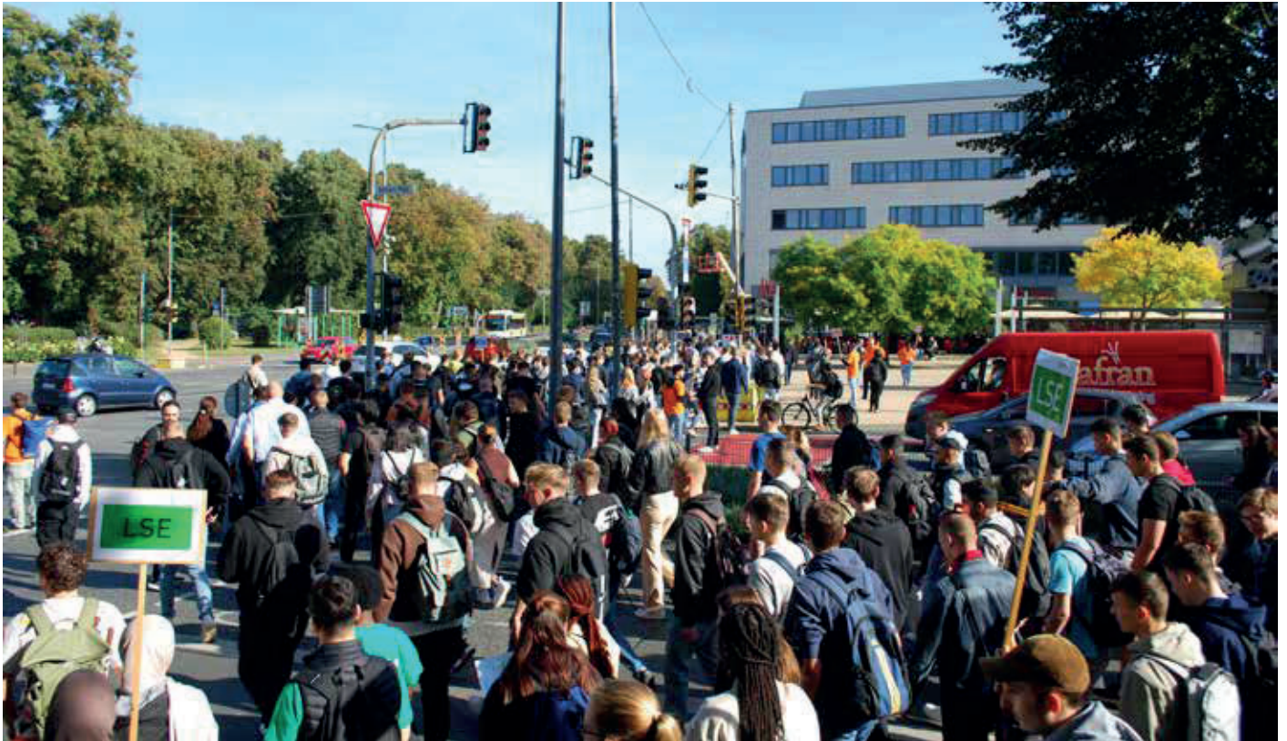
Am Begrüßungstag sorgten die „Erstis“ in Gießen für Hochbetrieb zwischen Kongresshalle und THM-Campus.