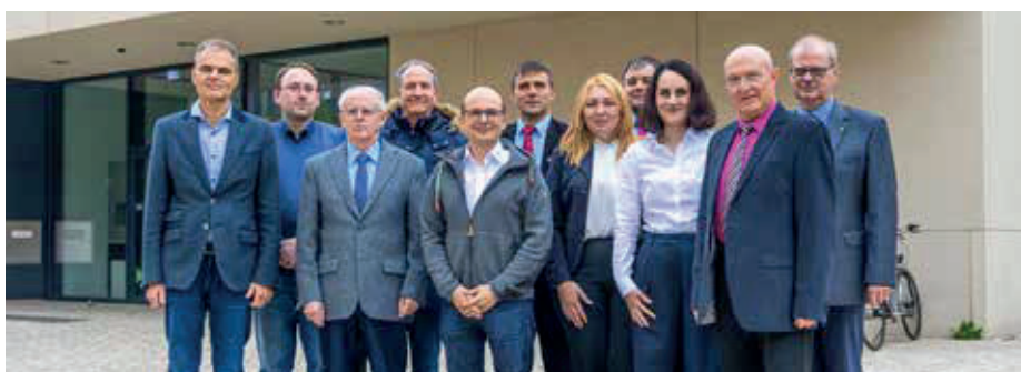
Gäste aus Mittel- und Osteuropa besuchen einmal im Jahr die THM.

Neben hochschulpolitischen Themen steht bei den regelmäßigen Treffen aber