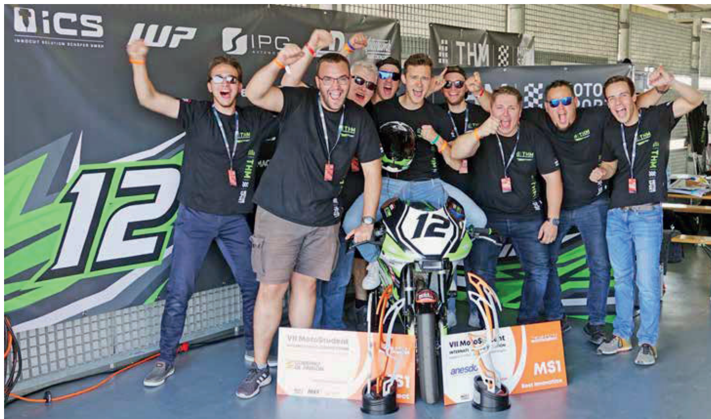
Der Rennstall THM Motorsport Friedberg hatte beim "MotoStudent 2023" in Spanien mehrfach Grund zu jubeln.

Mit zwei Siegerpokalen und weiteren hervorragenden Platzierungen ist das Team von THM Motorsport Friedberg vom „MotoStudent 2023“-Wettbewerb in Spanien zurückgekehrt. Die Studierenden aus drei Fachbereichen holten bei der internationalen studentischen Konkurrenz mit ihrer Rennmaschine zwei Spitzenplätze im Wertungsteil „MotoStudent 1“ (MS1).