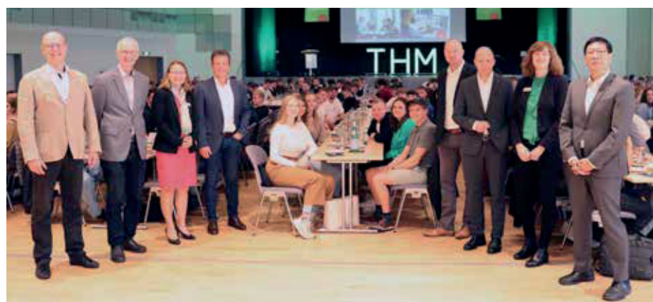
Bei StudiumPlus in Wetzlar begrüßten die Verantwortlichen von ZDH und CCD sowie die Leiterinnen und Leiter der Studiengänge ihre Neuen.

Von den Neuimmatrikulierten bei StudiumPlus haben über 300 Wetzlar und knapp 170 eine der Außenstellen in Bad Hersfeld, Bad Vilbel, Bad Wildungen, Biedenkopf, Frankenberg und Limburg als Studienort gewählt. In der Nachfrage der Neulinge liegen die Bachelorprogramme Betriebswirtschaft (125) und Bauingenieurwesen (100) vorne. ■