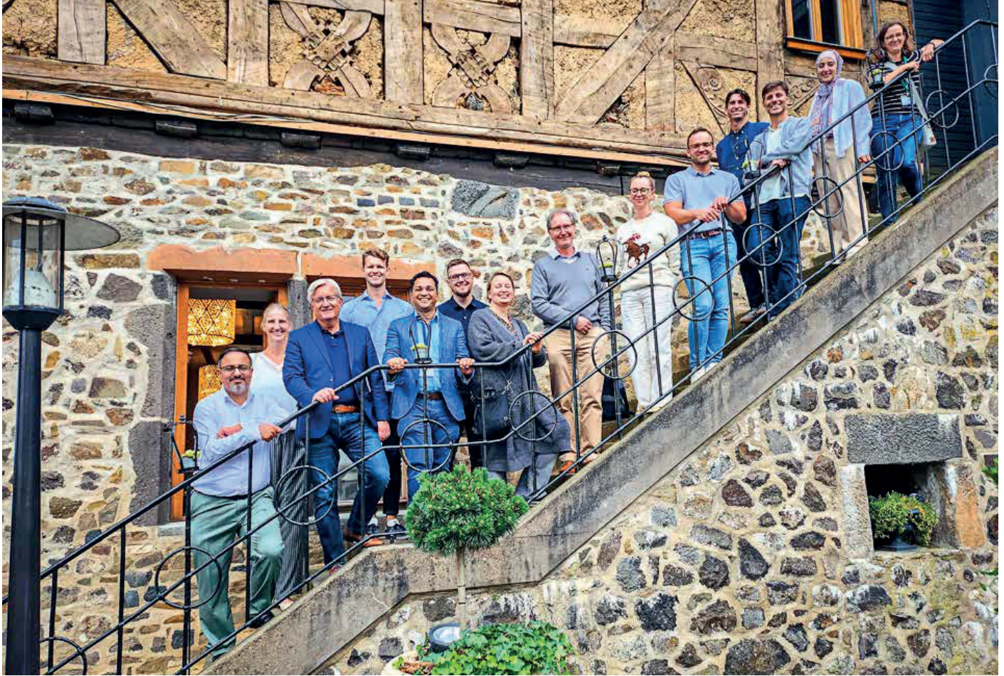
Internationale Fachleute haben sich auf Einladung von THM und JLU in Gießen zu Fortschritten in der regenerativen Medizin ausgetauscht.