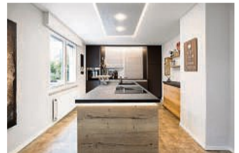
Die richtige Deckengestaltung für Ihre Küche

Nirgendwo kannst du deinen eigenen Stil so gut verwirklichen wie in deiner Wohnung. Plameco bietet dir dazu flexible Zimmerdecken in vielen verschiedenen Farben und Dessins. Ob matt, hochglänzend, mit Zierprofilen, oder