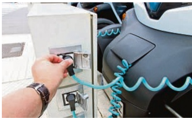
Auch wenn der Absatz von E-Autos strauzelt, haben Werkstätten gut zu tun.

Gut ausgelastete Kfz-Werkstätten, Kaufzurückhaltung bei Neufahrzeugen und ein stabiles Geschäft mit Gebrauchtwagen – so lässt sich die Lage des Kraftfahrzeuggewerbes im zu Ende gehenden Jahr 2023 zusammenfassen.