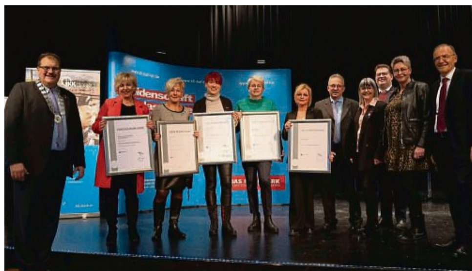
Für 40 und 25 Jahre wurden diese Friseurinnen in feierlichem Rahmen mit entsprechenden Urkunden geehrt.