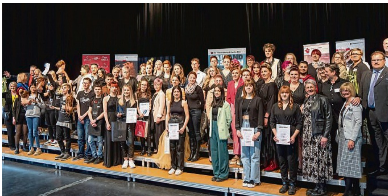
Das Leistungsfrisieren stieß auf großes Interesse. Am 17. März 2024 ist es wieder so weit.