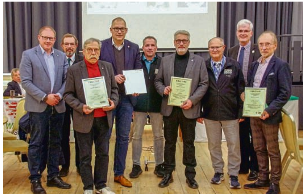
Verdiente Mitglieder der Kreisverkehrswacht und ihre Fürsprecher bei der Ehrung im Hessischen Hof in Bebra. Ausgezeichnet wurden nicht nur engagierte Personen, sondern auch beteiligte Kommunen.