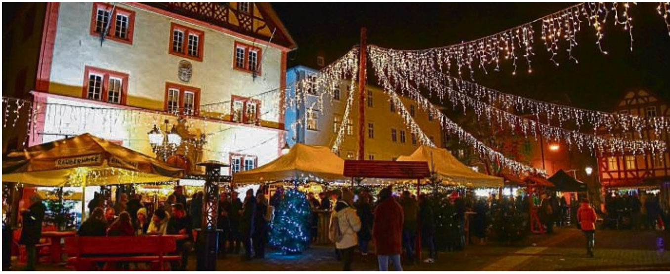
Lichtermeer auf dem Marktplatz: Der Rotenburger Weihnachtsmarkt war ein Hingucker.