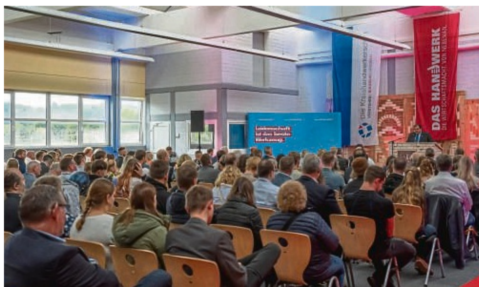
Neben den Malern und Lackierern für Gestaltung und Instandhaltung wurden auch Frieseure, Baugeräteleiter und viele weitere im Sommer freigesprochen.

Mit der Übergabe der Prüfungszeugnisse wurden weitere Prämierungen an die Innungsbesten in Form von Gutscheinen und Karriereschecks der Handwerkskammer Kassel durch die zuständigen Prüfungsausschüsse und Obermeister überreicht. Für die jungen Fachkräfte, aber auch für Familie, Freunde und Ausbilder ein Moment voller Freude und des Stolzes.