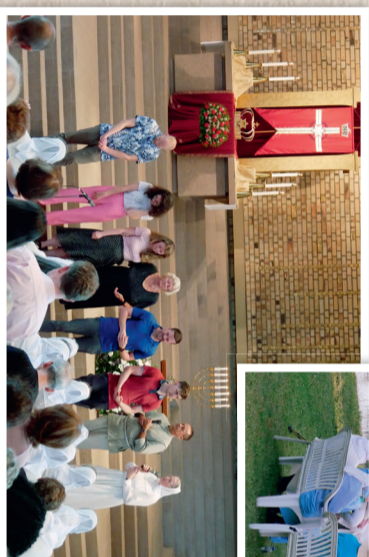
Das Yad b'Yad Leitungsteam wird gesegnet