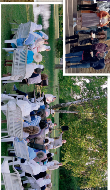
Singen am See