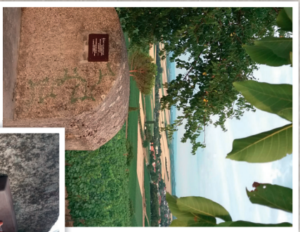
Wingertsheise im Wonnegau