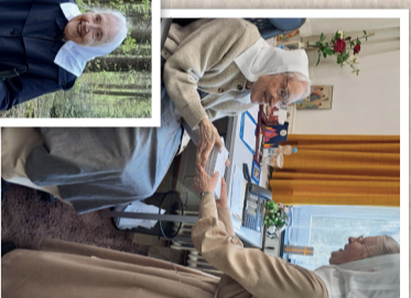
Die Prioriergeneration ist noch aktiv