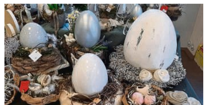
Schon jetzt an Ostern denken: Kunstvolle Eier werden die Besucher des Handwerkermarktes begeistern.

Gemälde, Teddybären, Frühlings-Floristik, getöpferte Blumen, Patchworkarbeiten und Wohndekorationen aus Stoff, Glas, Holz und Keramik und Beton runden das umfangreiche Angebot ab. Auch der Schraubenfigurenmacher ist wieder dabei.