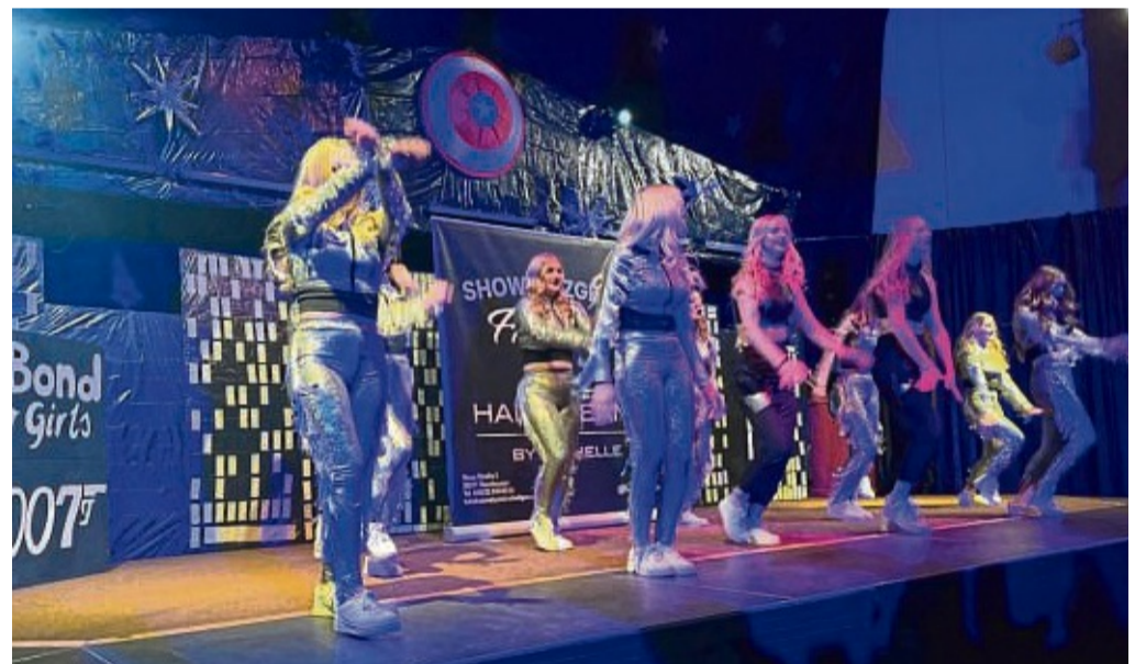
Tanzende Geheimagentinnen: Die Firestorms aus Kathus traten in Niederaula als 007-Bond-Girls auf.