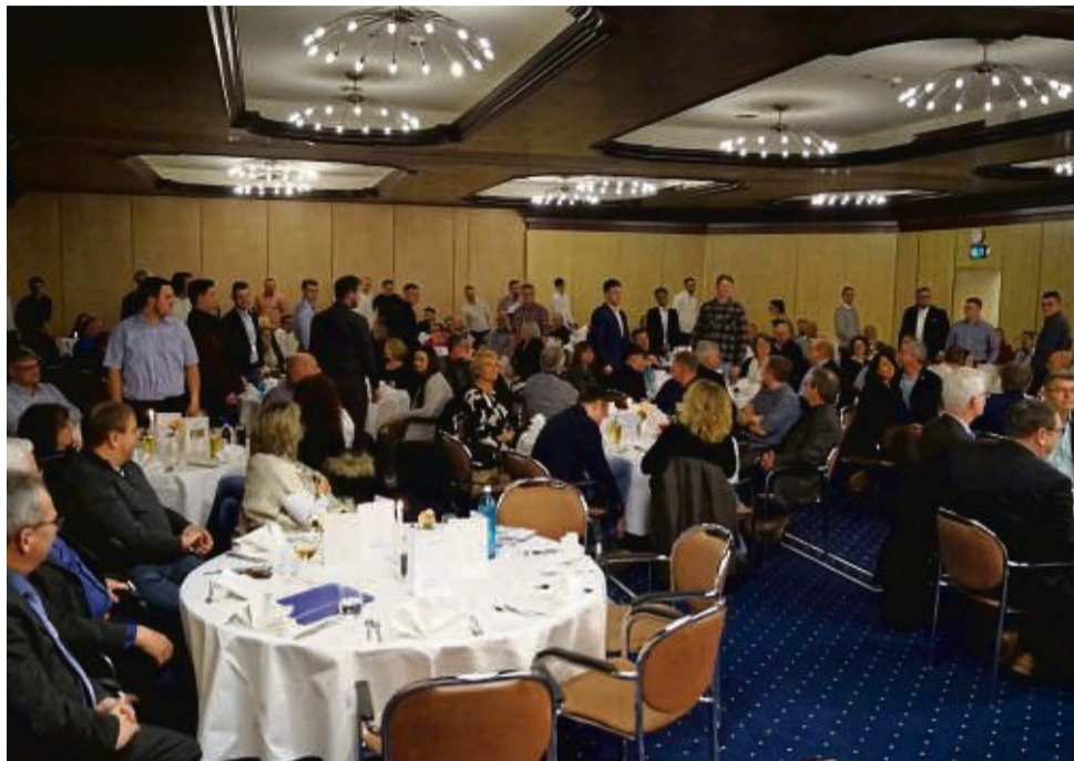
Zur feierlichen Freisprechung haben sich alle Junggesellen von ihren Plätzen erhoben. Weitere Fotos auf www.hersfelder-zeitung.de .

Es gibt viel zu tun in der Region und darüber hinaus. Sanierungen, Erneuerungen und Neubauten sind ein stetes Thema. Auch die In-