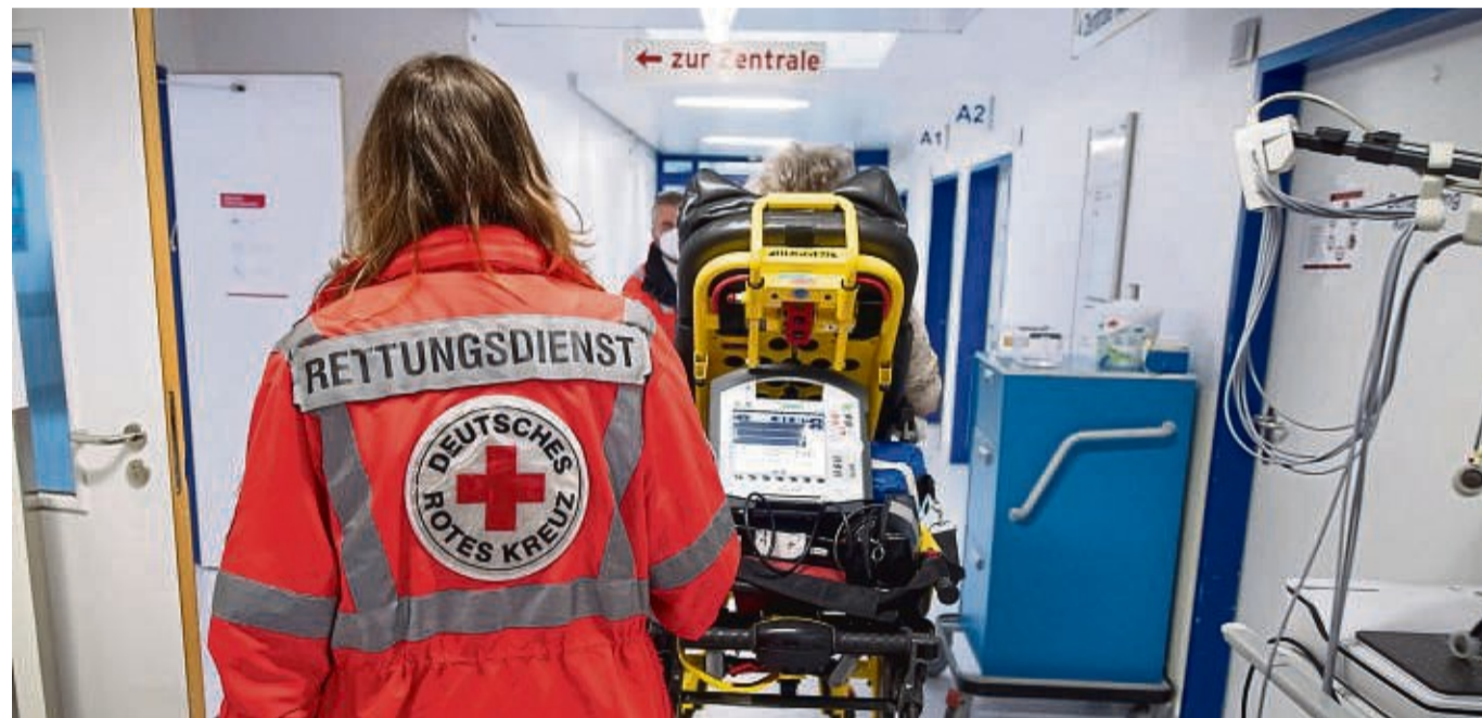
Der DRK-Kreisverband Hersfeld-Rotenburg fordert eine stärkere finanzielle Beteiligung vom Land Hessen.