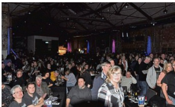
Viele Besucher waren gekommen , um die Gruppe Sacarium im Lokschnuppen Bebra zu sehen.