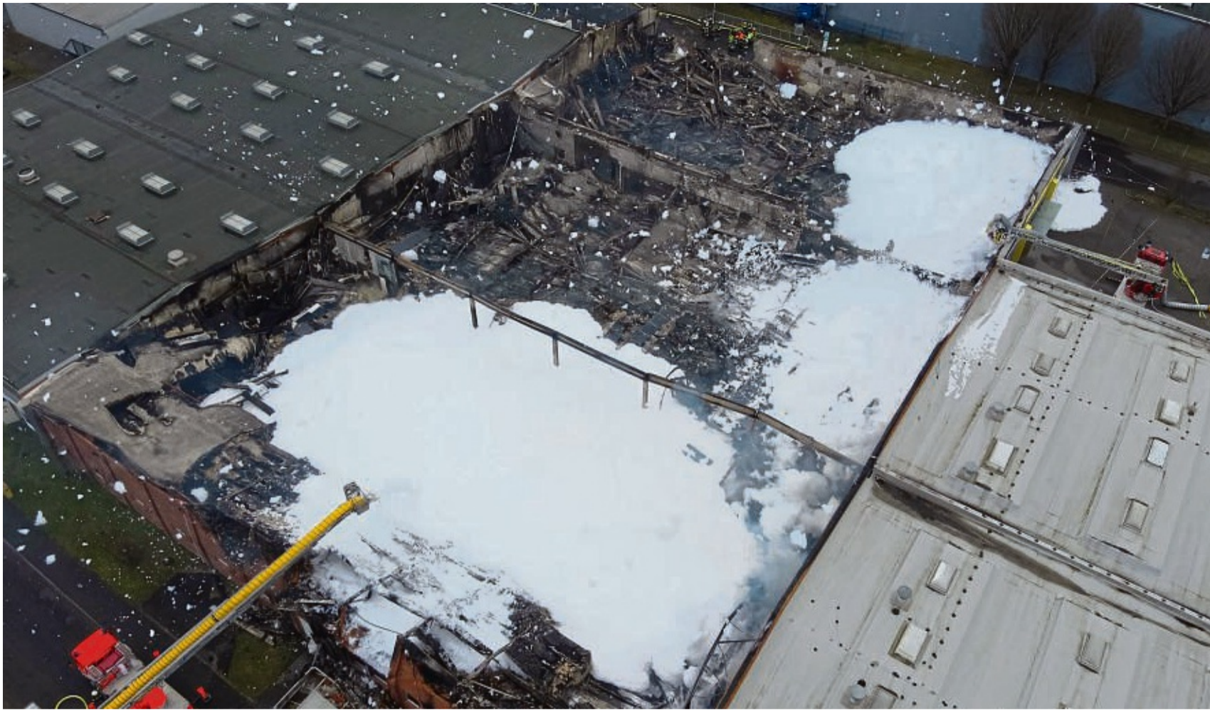
Blick von oben: Das Dach der rund 3800 Quadratmeter großen, ehemaligen Fabrikhalle ist komplett eingestürzt. Von den Drehleitern aus wurde die Brandruine mit Schaum abgedeckt, um Glutnestern den Sauerstoff zu entziehen.