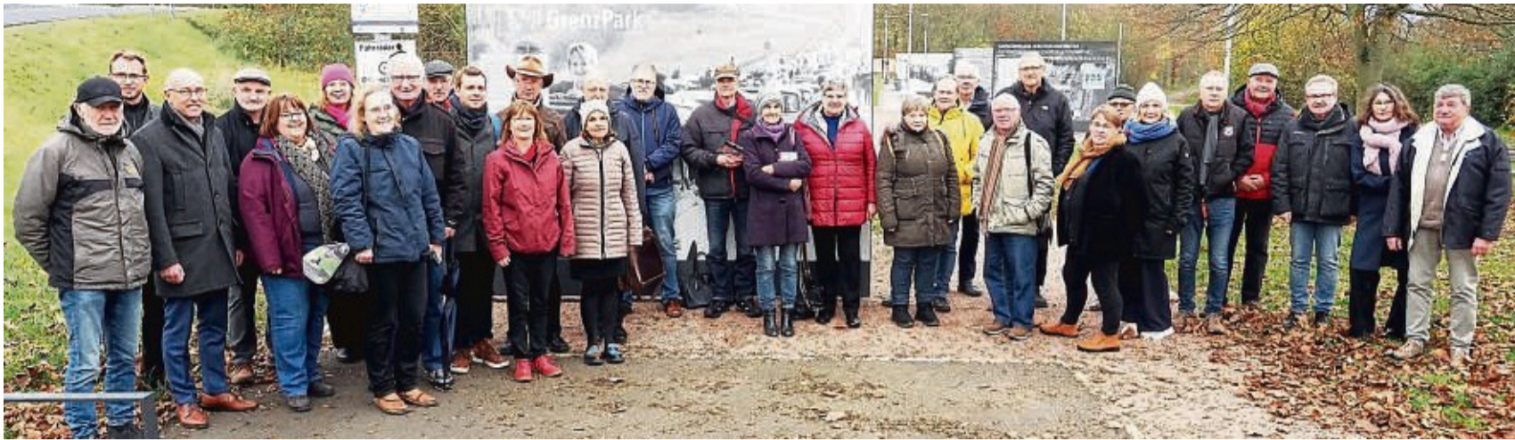
Auftakt in Herleshausen: Gut 40 Teilnehmer aus drei Leader-Regionen in Hessen haben den Werra-Grenz-Park in Herleshausen besucht und den Auftakt zum Netzwerk „Erinnerungskultur“ gemacht.