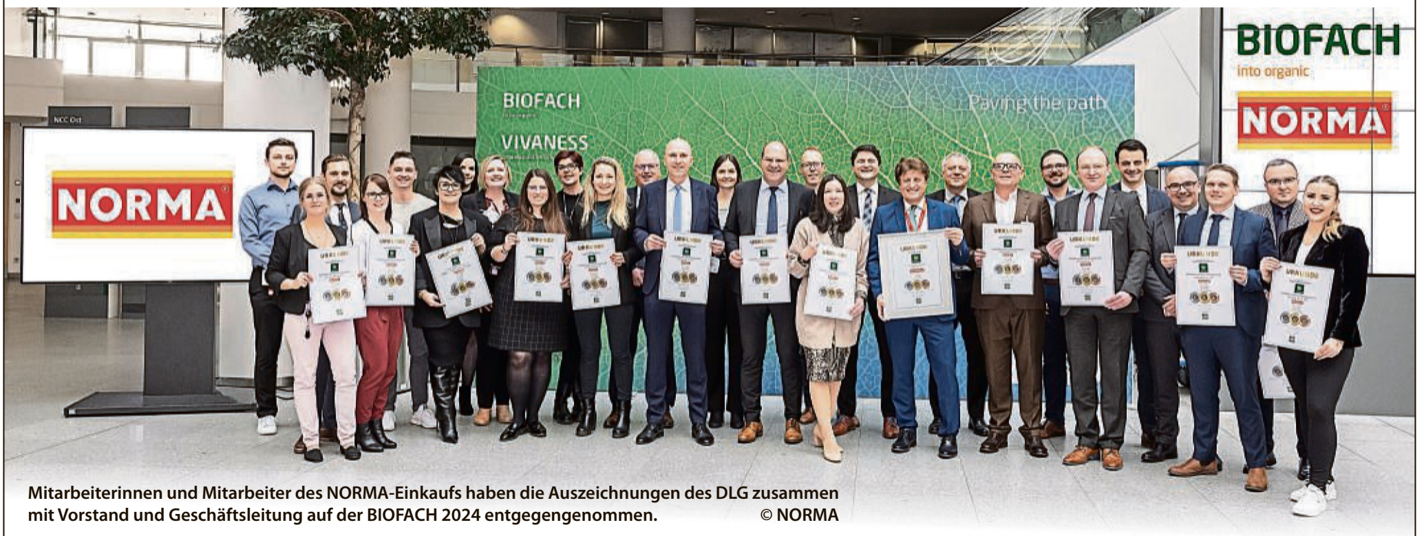
Mitarbeiterinnen und Mitarbeiter des NORMA-Einkaufs haben die Auszeichnungen des DLG zusammen mit Vorstand und Geschäftsleitung auf der BIOFACH 2024 entgegengenommen.

Der expansive Discounter NORMA mit Hauptsitz in Nürnberg ist in Deutschland, Österreich, Frankreich und Tschechien mit bereits mehr als 1.450 Filialen am Markt.