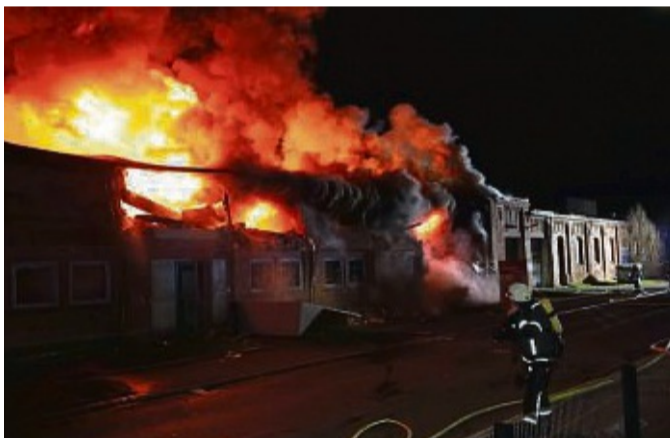
Im Vollbrand: Als die ersten Einsatzkräfte eintrafen, schlugen bereits hohe Flammen aus dem Möbelmarkt zwischen Landecker Straße und Gutenbergstraße.

Sie haben die Einsatzkräfte der Nacht in zweiter oder teilweise dritter Schicht abgelöst. Es ist ein langer, kräftezehrender Einsatz, der die