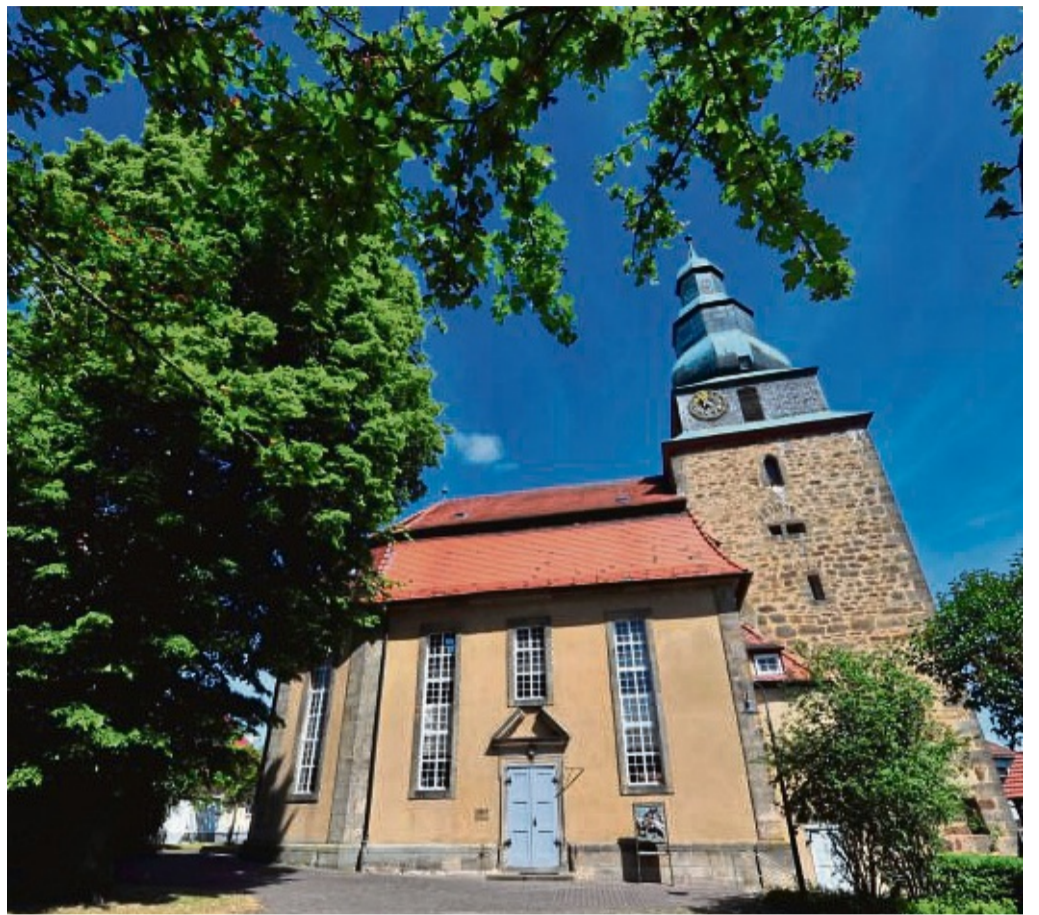
Die evangelische Pfarrkirche Mauritius des Kirchspiels Schenkklengsfeld.

17 Uhr: die evangelisch-reformierte Kirchengemeinde Obersuhl lädt zum Gottesdienst in das evangelische Gemeindehaus in Obersuhl ein, die evangelische Martin-Luther-Kirchengemeinde in Wildeck ins DGH nach Raßdorf. 18 Uhr: das Kirchspiel Rockensüß feiert den Gottesdienst in der Ev. Kirche Rockensüß 19 Uhr: der Gottesdienst des Kirchspiel Nentershausen findet in der Ev. Kirche Nentershausen statt.