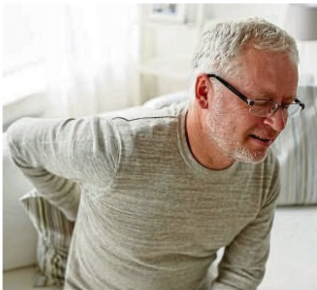
Nierensteine können sehr schmerzhaft sein. Rund fünf Prozent der Erwachsenen haben Schätzungen zufolge mindestens einmal im Leben solche Steine, und bei fast jedem zweiten Betroffenen bilden sich Nierensteine erneut.

Der Anteil an Kalzium- und Magnesiumionen im Wasser, der den Härtegrad bestimmt, hat keinen Einfluss auf die Bildung von Nierensteinen. Das haben jüngst britische Forscher bestätigt. djd